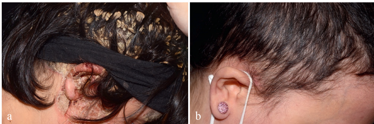
3. a, b ábra

A psoriasis kezelése a fekvőbeteg osztályokról, ahol a betegek sokszor heteket töltöttek bőrbetegségük kezelése kapcsán, gyakorlatilag teljes mértékben átkerült a járóbeteg ellátás keretei közé, a betegség súlyosságától függetlenül.