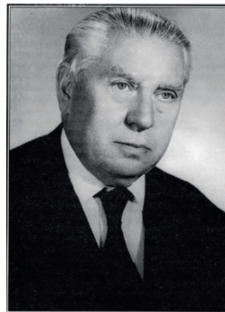
2. ábra Professzor Szodoray Lajos (1904–1980)