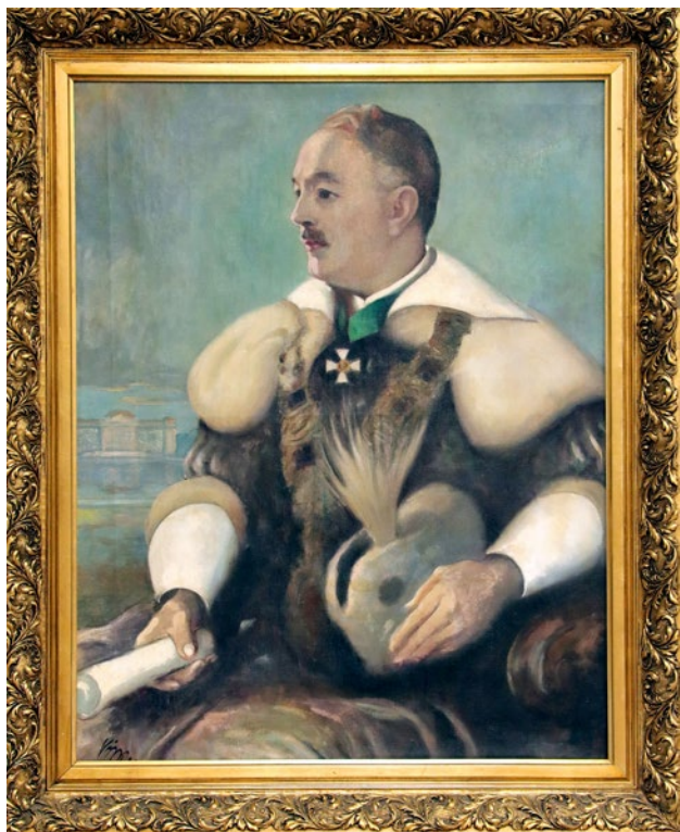
1. ábra Professzor Neuber Ede (1882–1946)

si kar dékánja volt, 1937-ben az MTA levelező tagjává választották, 1943-ban lett rendes tag. 1938-ban, Nékám professzor halála után, Neuber Ede meghívásra Budapestre távozott a Budapesti Egyetem Bőr- és Nemikórtani Klinikájának élére (2).