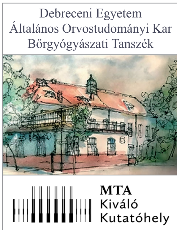
13. ábra MTA Kiváló Kutatóhely

A Debreceni Egyetem Bőrgyógyászati Klinikájának fejlődése jól szemlélteti a bőrgyógyászati szakma rohamos fejlődését is az elmúlt 100 év alatt. A bőrgyógyá-