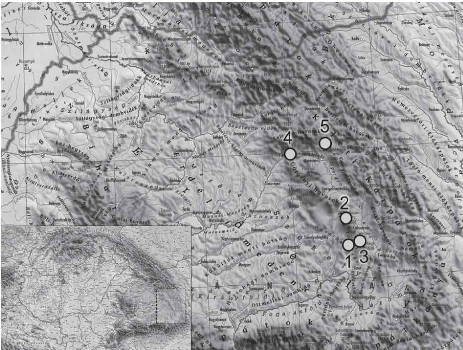
1. ábra. A vörös áfonya minták gyűjtési helyei (1 = Büdösfürdő; 2 = Madarasi-Hargita; 3 = Lucs; 4 = Galónya; 5 = Bélbor)

Románia legnagyobb tőzeglápja, 1079 m feletti magasságban. A 120 hektáros láp 1955 óta védett. Félreeső helyzete miatt kevésbé érik külső hatások, leszámítva a legeltetést és a láp peremén az erdőkitermelést. Jellemző növényzete a tőzeges aljzaton kialakult erdefenyő, luc és nyírfajok alkotta tajgaerdő maradvány ( Pinetum sylvestris-Eriophoretosum vaginati ) (Soó 1944 cit. in POP 1960). Az aljnövényzetet az északi fenyvérek jellemző fajai alkotják, az Empetrum nigrum L., Betula nana L., Andromeda polifolia L. mellett legnagyobb mennyiségben az áfonyafajokat találjuk ( Vaccinium myrtillus L., V. vitis-idaea L., V. oxycoccus subsp. microcarpum (Turcz. ex Rupr.) Kitam.) (POP és SĂLĂGEANU 1965). A mintákat egymástól nagyobb távolságra, mintegy 3 km-re gyűjtöttük: az 1-est a tőzegláp pereméről, a 2-est a területet átszelő Kormos-patak közeléből, a 3-as a külön állományt alkotó