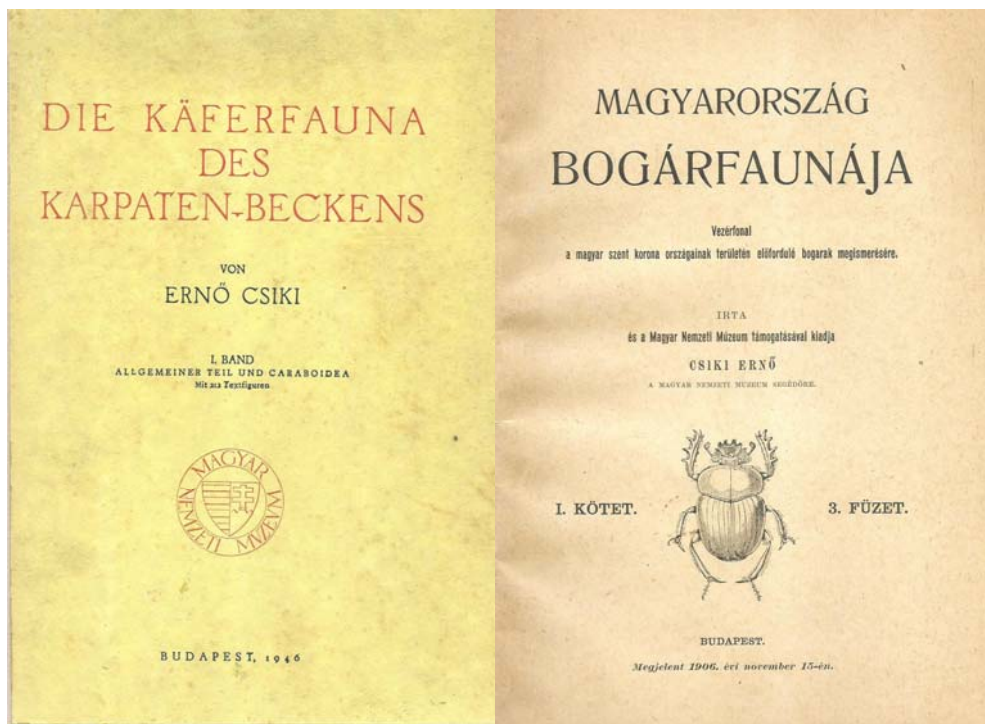
2–3. ábrák. 2: CSIKI ERNŐ 1946-ban megjelent német nyelvű monográfiájának ( Die Käferfauna des Karpaten-Beckens ) címlapja. 3: CSIKI ERNŐ 1905 és 1908 között megjelent magyar nyelvű monográfiájának ( Magyarország bogárfaunája ) címlapja.

Figures 2–3. 2: Cover page of ERNŐ CSIKI's monograph in German in 1946 ( Die Käferfauna des Karpaten-Beckens ). 3: Cover page of ERNŐ CSIKI's monograph in Hungarian between 1905 and 1908 [ The beetle fauna of Hungary ].