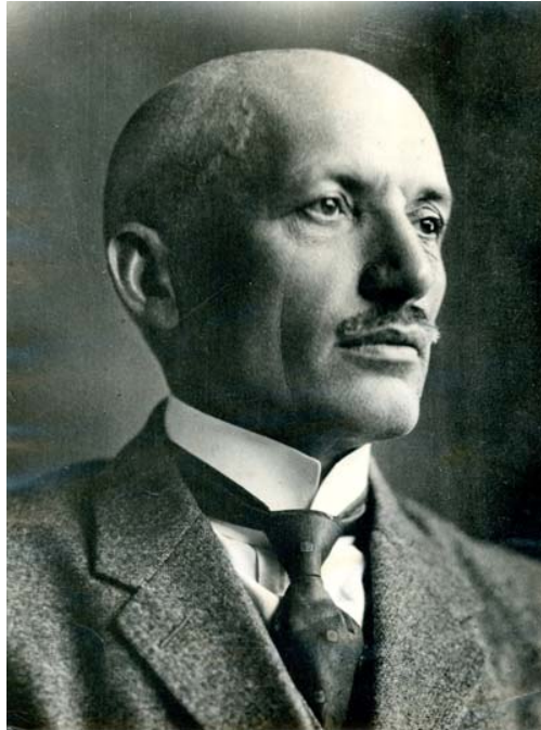
1. ábra: CSIKI ERNŐ (1875–1954) arcképe.

Figure 1. The portrait of ERNŐ CSIKI (1875–1954).