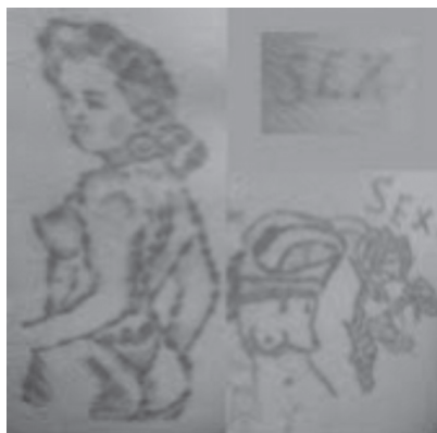
3. számú kép

A heteroszexuális kapcsolattól való megfosztottság: A heteroszexuális kapcsolattól való megfosztás az előzőleg rendezett életet élő elítéltet kínozza a legjobban. A frusztráció mértéke a szexuális szükséglet csökkentésével enyhíthető (lásd pornográf tartalmú könyvek, újságok, képek, illetve homoszexuális kapcsolatok). A börtönben készült tetoválások során leginkább az akt, félakt jelenik meg, de találkozunk szexualitást kifejező női portréval vagy „szex” feliratokkal is. (3. számú kép)