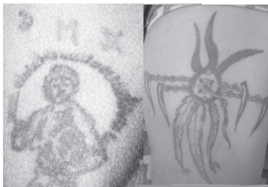
2. számú kép

foglalkozásokra járni. A fogvatartottnak azonban ez kevésnek bizonyul: kap ételt, de olykor más, a megszokottól eltérő ízekre vágyik, az intézetekben hiánycikket képez a szeszes ital, de megjelenik az igény az egyediséget kifejező ruhadarabok birtoklására, az egyéniség kifejeződésére is. A börtöntetoválásokat tehát sokan egyéniségük, személyiségük kifejezésére használják. Megfigyelhető, hogy kedvenc színészt (pl. Bruce Lee), mesehőst, kiemelt jelentőséggel, olykor mágikus tulajdonsággal felruházott tárgy képét varratják magukra az illetők. (2. számú kép)