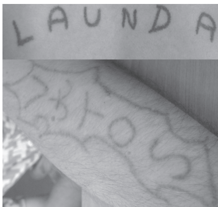
5. számú kép