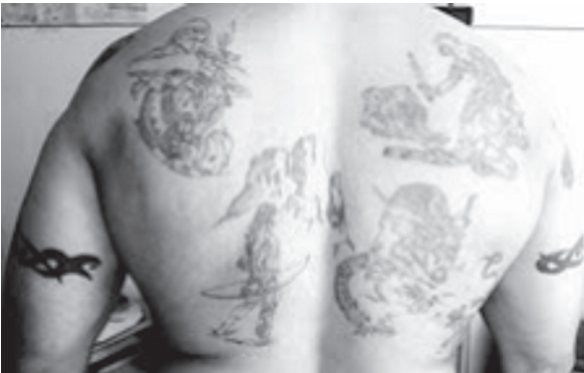
6. számú kép – „Küzdelem”

Tekintettel arra, hogy a tetoválások rejtetten, „titkosan” készültek, ezért a keletkezés folyamata nem volt megfigyelhető. A személyes interjú során kitértem a ke-