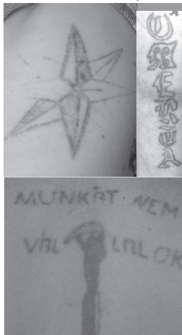
4. számú kép