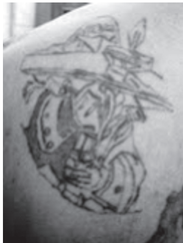
7. számú kép – „Tell Vilmos”

Az intuíció olyan észlelésnek tekinthető, amelyben az inger (pl. a rajzi jelenység) csak részben vagy egyáltalán nem tudatosodik, és az észlelő csak a végeredményt ismeri fel: a képnek az észlelőre gyakorolt hatását (Vass 2011).