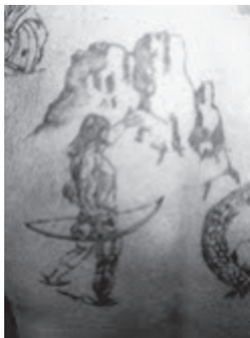
8. számú kép – „Vadászat”

A kép alatt ősembernek látszó, izmos emberi alak látható, aki egyik kezében íjat tart, másik kezét a magasba emeli. Ez a kéz láthatóan kevésbé kidolgozott, jelentőséggel nem bír a vizsgálati személy számára. Megemlíteném a kép elemzése során egy, a rajzvizsgálatkor meglehetősen gyakran használt fogalom, a kinesztetikus empátia. A szakkifejezés azt jelenti, hogy a tetoválást elemző személy az ábrázolt alak testtartásának utánzásával törekszik testi átéléssel megfejteti és szóban megfogalmazni a rajzban kifejezendő érzéseket (Vass 2011). Az alakzat kissé görnyedt testtartása jelezheti a bizonytalanságot, megfigyelhető, hogy a figura stabilitásából kibillenthető, ugyanakkor erősnek mutatkozik. A test izmainak kidolgozottsága, a test „belesüppedése” a talajba szintén erőre utal. A figura azt közvetíti, hogy „menne is, meg nem is”. (8. számú kép)