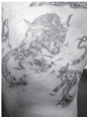
9. számú kép – „Harc”

A negyedik tetoválás szintén egy jelenetet ábrázol, mely egy harc, küzdelem végét jelzi. A tetoválás kevésbé jó minősége miatt kezd fakulni, emiatt a fényképen is alig látható az ábra. A képen szintén egy katona látható, aki magabiztos testtartással legyőz egy szörnyet. A katona testtartása határozott, feltételezhetően tudja, hogy mit tesz. A vizsgálati személy elmondja, hogy a képen „ez a gladiátor egy nőt védelmez; egy tigris, vagy valami hasonló állat megtámadja a nőt, és őt védi meg”. (10. számú kép) Ezt a tetoválást ismételten saját életével hozza párhuzamba, számos alkalommal kellett már nőt megvédenie agresszív fellépéssel. „X.” korábban prostituáltakkal „foglalkozott”. A nők védelme azt is jelenti számára, hogy szereti a nőket, akikről a börtönben „csak fantáziálni lehet”. (Ez a jelenet tehát a heteroszexuális kapcsolatoktól való megfosztottság képi megjelenítése is.)