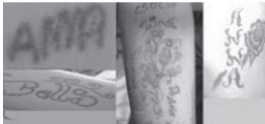
1. számú kép