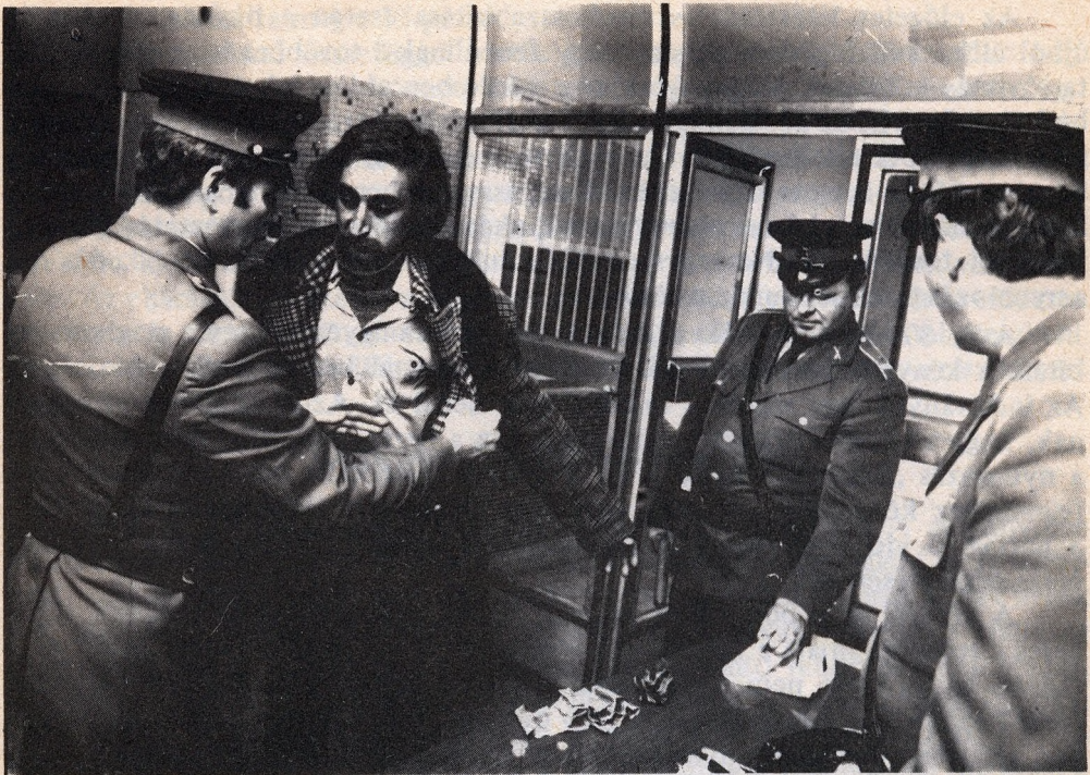
A gyanúsítottból előzetes lesz

A fiatakorúak előzetes letartóztatásakor a Be 302. §-ának első bekezdése még egy speciális feltételt tartalmaz: a bűncselekmény különös súlyát. A kérdés megítélése itt esetleg akkor okoz gondot, ha a bűncselekmény tárgyi súlya nem különösen nagy, de a fiatakorú családi körülményei, személyes életvezetése mégis az előzetes letartóztatás elrendelését támasztják alá a Be 92. §-ának első bekezdésébe foglaltak alapján.