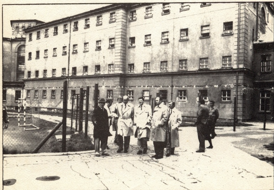
A finn bv-delegáció a Budapesti Fegyház és Börtönben