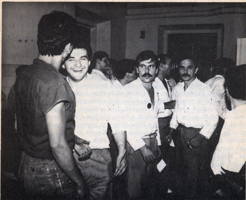
Az erőszakot talán a humor oldja legjobban

2. A gyerek, születése pillanatától kezdve kiszolgáltatottja a nevelésnek. Fizikai és pszichikai éretlenségénél fogva hosszú évekig nincs abban a helyzetben, hogy mást tegyen, mint azt, hogy eltűri ahogyan és amire nevelik. Ez akkor is igaz, ha a legdemokratikusabban, egyéni adottságaira és hajlamaira való legnagyobb tekintettel teszik ezt. Abban, ahogyan és amire egy gyereket nevelnek, mindig tőle idegen akarat a mérvadó. Az is az idegen akarat függvénye, ha a nevelés folyamatában a nevelő a legmesszebbmenőkig igyekszik figyelembe venni a gyerek akaratát. A dolgot ugyanis nem a gyerek dönti el.