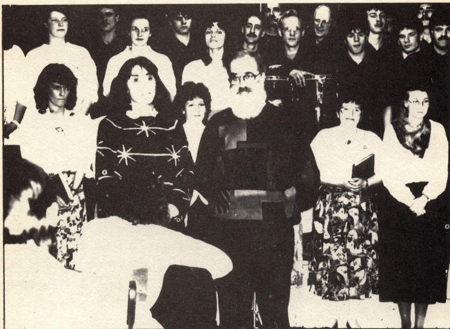
Német börtönmisszió a Markóban