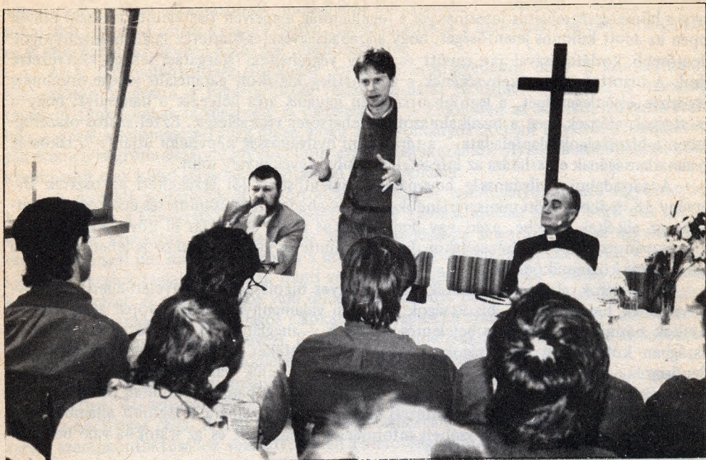
Fodor Gábor, a Fidesz parlamenti képviselője, az Országgyűlés emberjogi, kisebbségi és vallásügyi bizottságának elnöke elítéltekkel találkozik

Svédországban az ún. intézeti bizottságokban (Anstaltsnämnd) a letartóztató intézet alkalmazottai is helyet kaptak. A '74-es Bv-törvény előírásai szerint a bizottság vezetőjét – a helyi bíróság tagját vagy más jogi végzettségű személyt – a király nevezi ki. A bizottság tagja lehet még az intézet vezetője és egy alkalmazottja, továbbá két fő, akikkel szemben alapkövetelmény, hogy megfelelő ismeretekkel rendelkezzenek vagy hivatásszerűen vegyenek részt az elítéltek szociális támogatásának intézésében. Annak ellenére, hogy két intézeti alkalmazott is tevékenykedik a bizottságban, a svéd törvényhozás nagy súlyt helyez a bizottság függetlenségének a megőrzésére, ezért polgári tagjait a helyi önkormányzat választja.