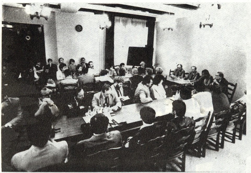
Snut Veri svéd professzor a különböző országok bűnügyi helyzetének összehasonlító vizsgálatáról tartott előadást az országos parancsnokság munkatársainak