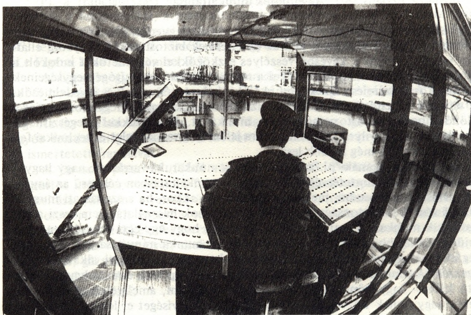
A biztonságos őrzéshez fejlett technika kívántatik

– meg kell akadályozni az életfogytiglanra ítélt és esetleges látogatója érintkezését;