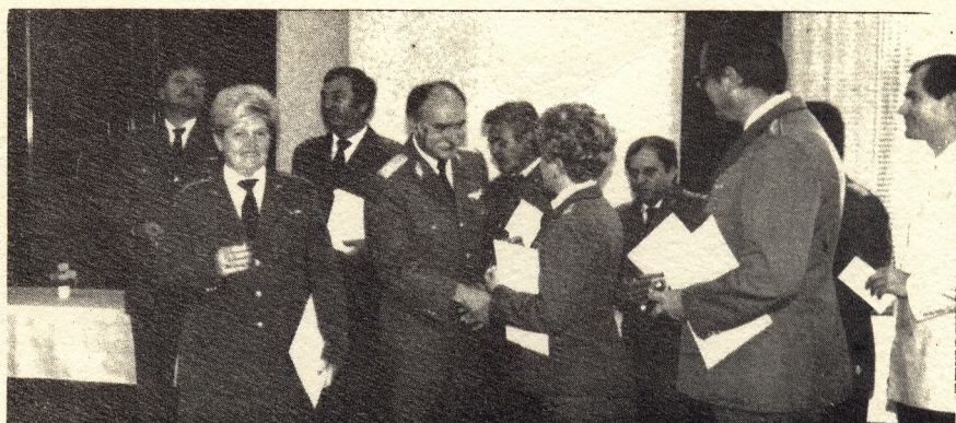
A fegyveres erők napján kitüntetett, illetve előléptetett néhány dolgozó