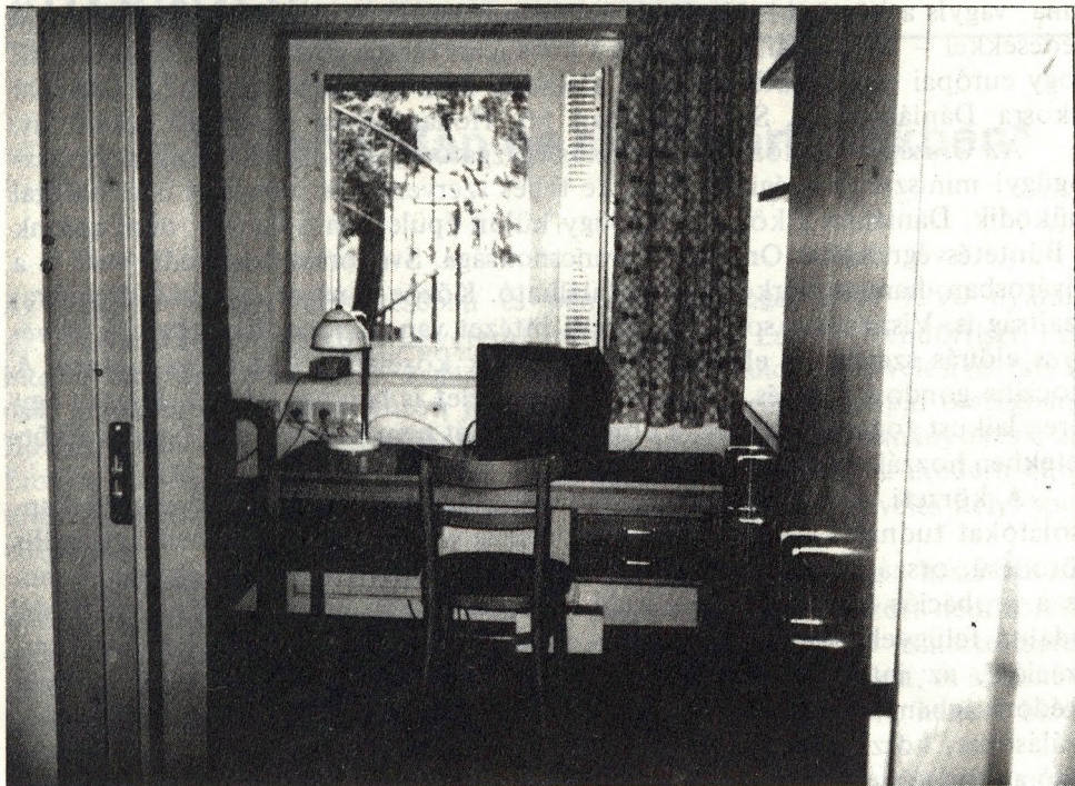
Tipikus skandináv zárka – íróasztallal, tévével

A skandináv országokban megszokott dolog, hogy az elítéltek és a tisztviselők egy idő után összekeverednek. Egyébként az úr megszólítás kölcsönös. A kisközösségek helyzetét gyakran jellemzik a pszichológiai biztonság kifejezésével, mert mindenütt konstruktív, együttműködő, kölcsönösen elfogadó légkör kialakítására törekednek, amelyik meggyőzi az elítélteket arról, hogy a javát akarják, ezért aztán nem is akar megszökni. A fogvatartott partnernek tekinti a személyzetet egy olyan kommunikációs viszonyrendszerben, amely hasznos és respektált társadalmi mintákat közvetít felé.