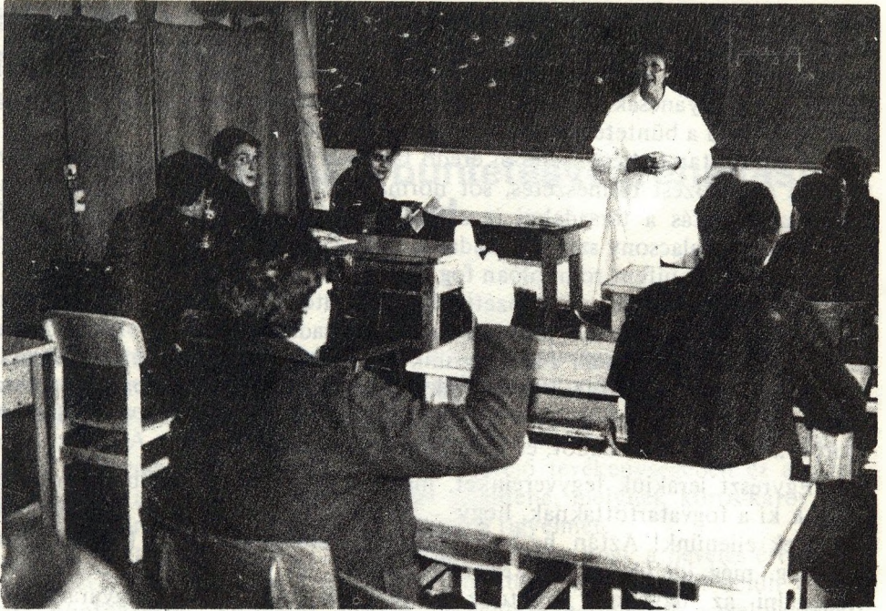
A továbbtanulás az egyik legbiztosabb fogódzó a szabadulás utáni beilleszkedéshez

A pártfogásra indíttatást érző emberek nem mérik fel korlátaikat, jó részüket magában és Istenben bízva ugrik a sötétbe. Karitatívitásuk mögé nézve nem ritkán furcsa pszichológiai, szociálpszichológiai mozzanatokot találunk. Gyakran egyfajta öngyógyításvágy, önterápia húzódik meg segíteni akarásuk mögött. Ez önmagában nem baj! A társadalomban regeteg ilyen tevékenység van, pl. a művészi hivatások zöme ide sorolható. Probléma ebből csupán akkor származik, ha az ember nem tudja vagy nem akarja ezt tudni magáról, és olyan emberekkel kerül szembe, akik lecsapnak erre az ártatlan öncsalására és alaposan rászedik. Így lehet a segítőtől a legvédtelenebb áldozat, így válhat a segítség egy támogató elvesztésévé és egy újabb sikeres bűncselekmény előkészítőjévé.