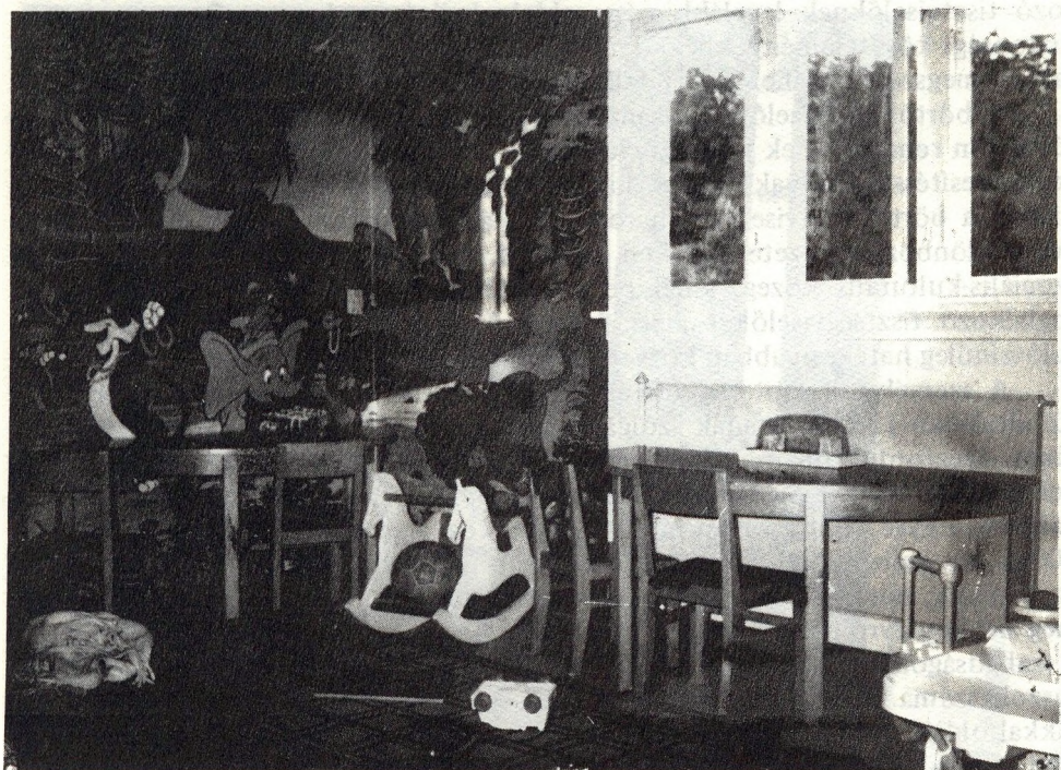
Az elítéltek gyermekeinek bölcsődéje egy dán nyitott börtönben

futballpálya, több helyütt minigolf- és tenispálya, meg heti 2–3 alkalommal igénybe vehető szauna. S természetesen nyilvános telefon (sic!) Az 5–6 m 2 -es zárkák szűkek, mozogni nemigen lehet bennük. A zárkaajtók azonban nappal mindig nyitva vannak, és az élet a közösségi helyiségekben zajlik.