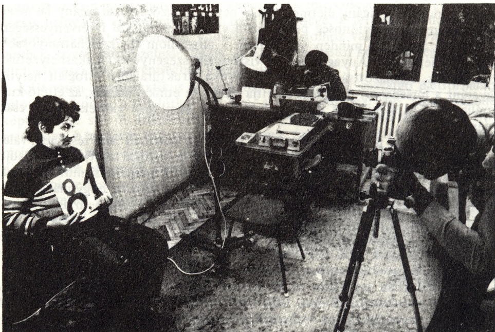
Az előzetes letartóztatásba vétel procedúrájának kezdete