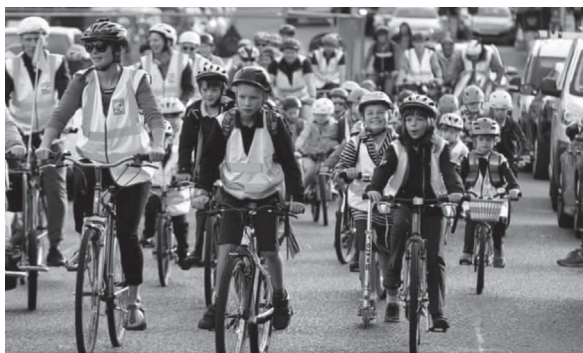
3. kép. Bicibusz Barcelonában

A bicibusz pilot program a világhírnevét a spanyol civileknek köszönheti. 2021 őszén öt spanyol család hívta életre a bicibusz fenntartható mobilitási programot a spanyolországi Sarriában (3. kép).