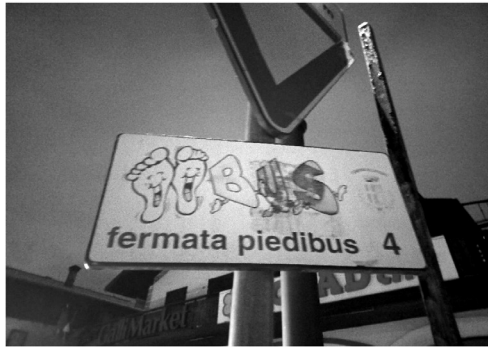
2. kép. Pedibusz megállót jelző tábla Livignóban, Olaszország

A WSB-program fókuszában az iskolás (általában 2–18 éves) gyermekek állnak. A cél egyrészt a gyalogos közlekedés arányának a növelése az iskolába járás tekintetében, másrészt pedig az iskolák környékén a reggeli közlekedési dugókat csökkenteni, azáltal, hogy csökken a gépjárművek torlódása az iskolakapuknál, vagyis hosszú távon legitimálja a gyalogos közlekedést, mint mobilitási módot. (Mendoza et al. 2012; Malucelli et al. 2017). A csoport előre meghatározott útvonalon, rögzített menetrend szerint jut el az iskolába, hasonlóan, mint egy buszjárat esetében és a kijelölt megállóban lehet csatlakozni a diákokhoz (2. kép) (Engwicht 1992).