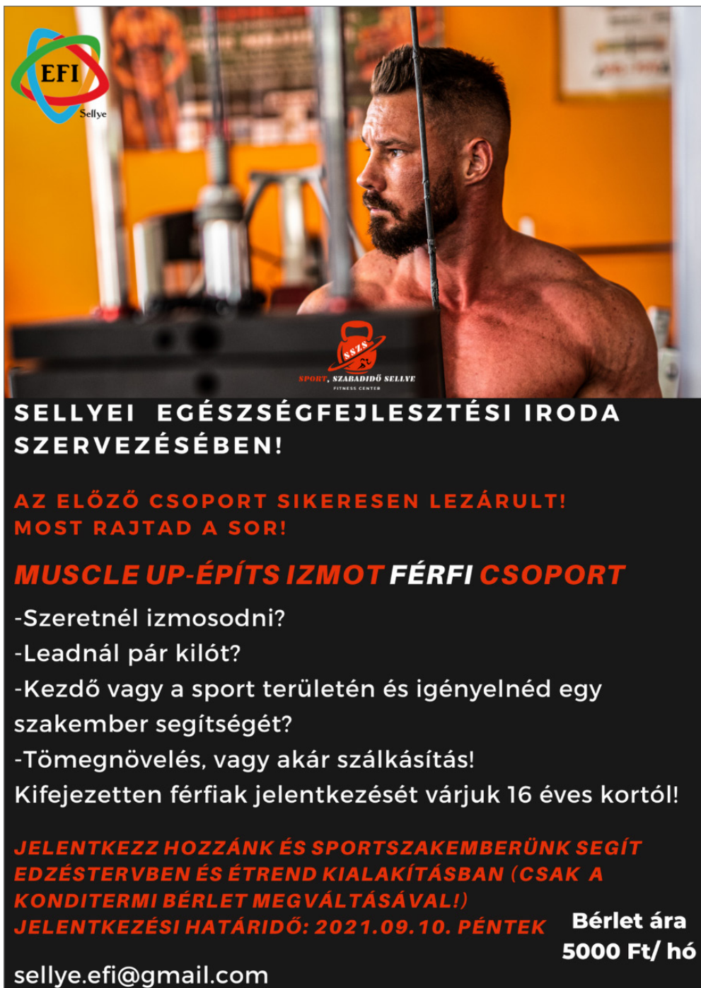
1. ábra: Az edzőtermi csoportfoglalkozás férfiaknak szóló plakátja (minta)

A női csoport létszáma folyamatosan csökkent a hetek során, végül 3 fő teljesítette a teljes 8 hetes programot. A férfiak csoportjában is csökkent