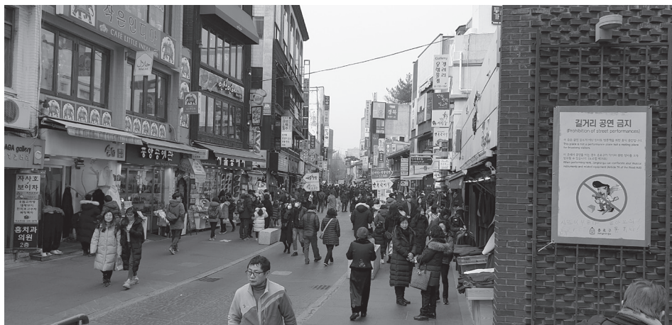
5. kép Cshonggyecheon hagyományos környéke ma sétálóutca és látványosság Photo 5 The traditional neighbourhood of Cheonggyecheon is today pedestrian street and attraction

A 2014-ben létrejött bizottság – CSO MJONG-RE vezetésével – az újbóli rekonstrukciót szorgalmazta, de figyelmen kívül hagyta, hogy a város egy folyamatosan változó közeg. A kritikusok szerint a „tereprendezésnek” degradált városfejlesztés és rekonstrukció viszont a kerület dzsentifikációját eredményezte (5. kép). JEON, C. – KANG, K. (2019) meg is jegyzi, hogy még a városrehabilitáció, a mesterséges tereprendezés legerősebb bírálója, a szociológus CSO MJONG-RE sem említette a környék ipari múltját, azt a társadalmi hely-