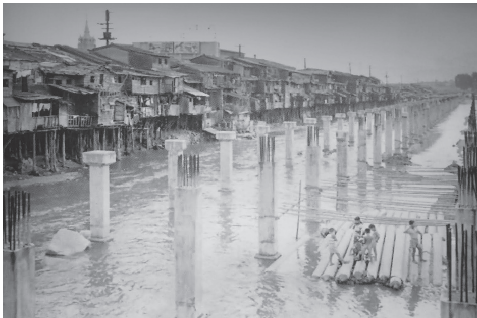
2. kép A Cshonggyecshon patak befedési munkálatai 1958-ban Photo 2 Covering the Cheonggyecheon Stream in 1958