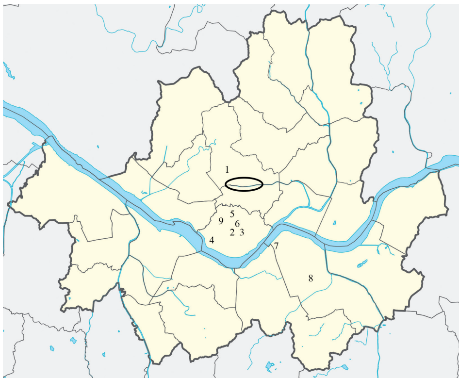
1. ábra A szövegben szereplő városrészek Szöulban.