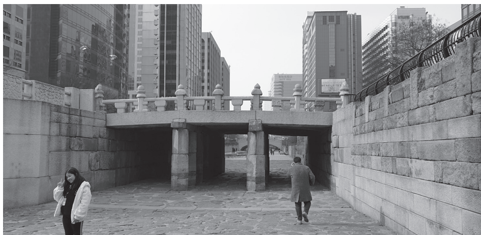
4. kép A Kvantongjo híd és környéke 2019-ben Photo 4 Around the Gwangtonggyo Bridge in 2019

patak, mint említettük, egy szennyvízelvezető volt, környéke pedig nyomornegyed. A befedést követő évtizedekben pedig nem volt mire emlékezni, hiszen a csatorna a föld alá került. Csatorna volt, hiszen természetes vízutánpótlását évszázadok óta elvesztette. A városépítészeti szemlélet szerint a városrész konzerválása olyan referenciára utalt, ami legfeljebb a történelemlékekben volt olvasható.