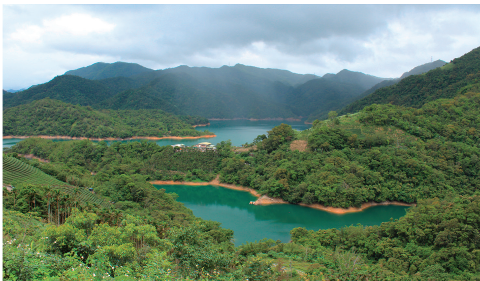
4. kép Víz tározó Tajpei közelében – New Taipei City, Shiding (Ezer sziget tava) Photo 4 Water reservoir in New Taipei City, Shiding (Thousand Island Lake)

E folyamatot három tényező okozza, illetve erősíti: az egyik, hogy a mezőgazdasági munka fizikai munkai igényessége nem vonzó számukra, másrészt a fiatalok nagy része tovább tanul (közülük nem kevesen külföldön) és utána szintén más szakmában helyezkedik el, végül a városi és a vidéki háztartások közti jövedelmi különbségek csökkentik a helyben mara-