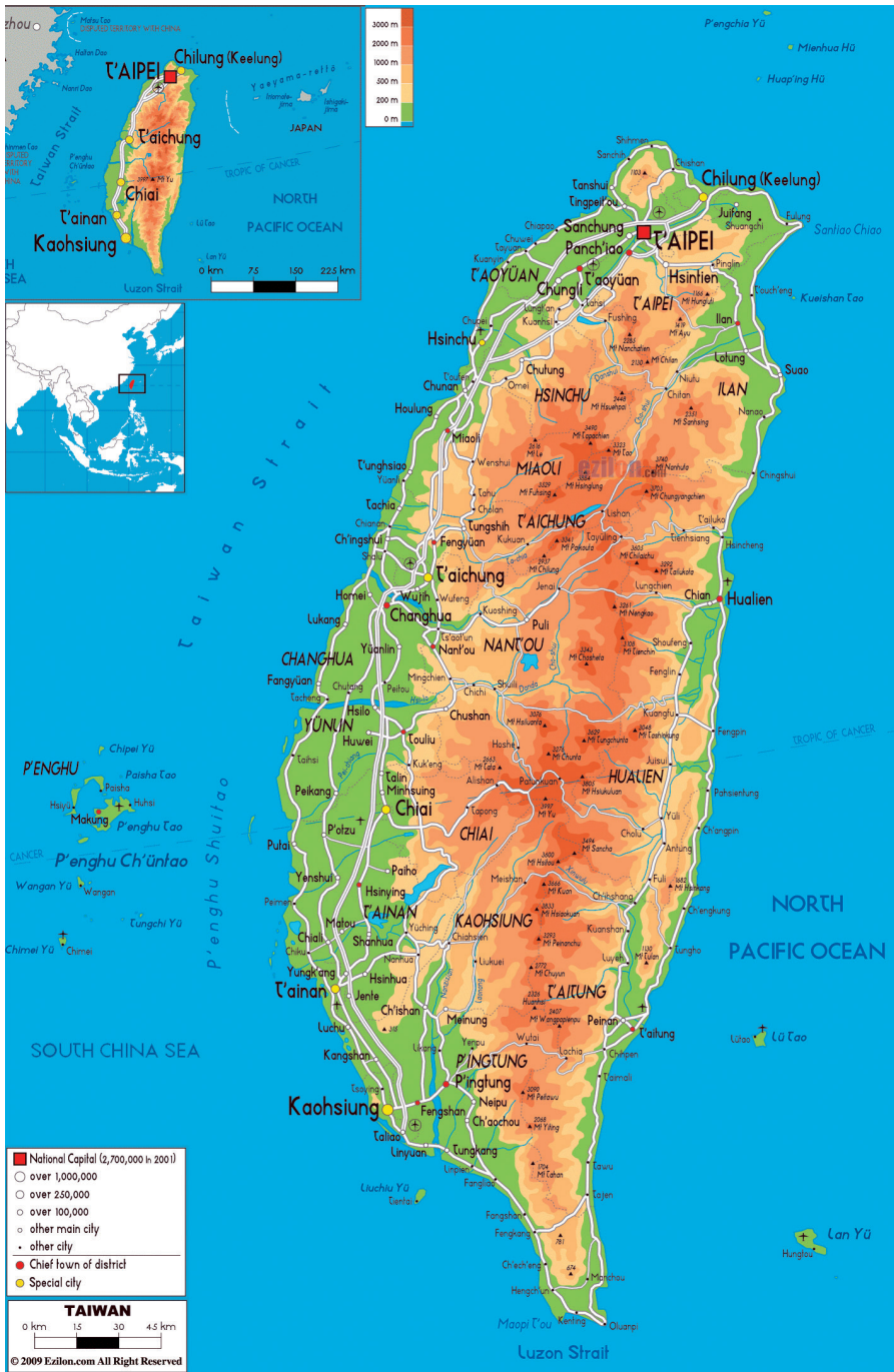
1. ábra Tajvan áttekintő térképe Figure 1 Map of Taiwan