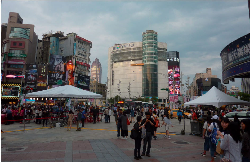
3. kép Tajpeji belvárosi utcarészlet

ve 519 milliárd USD), mind vásárlóerő-paritáson (PPP) számítva (1.125 milliárd USD). Az utóbbi tekintetében 2020-ban is várhatóan megtartja ugyanezt a pozíciót, míg a folyó áron számított GDP esetében előreláthatóan a 22. helyre kerül. Tajvan gazdasága – folyó áron – nagyságrendileg Argentínához vagy Svédországhoz hasonlítható, míg PPP bázison az ausztrál, vagy a lengyel gazdasághoz hasonló (3. kép).