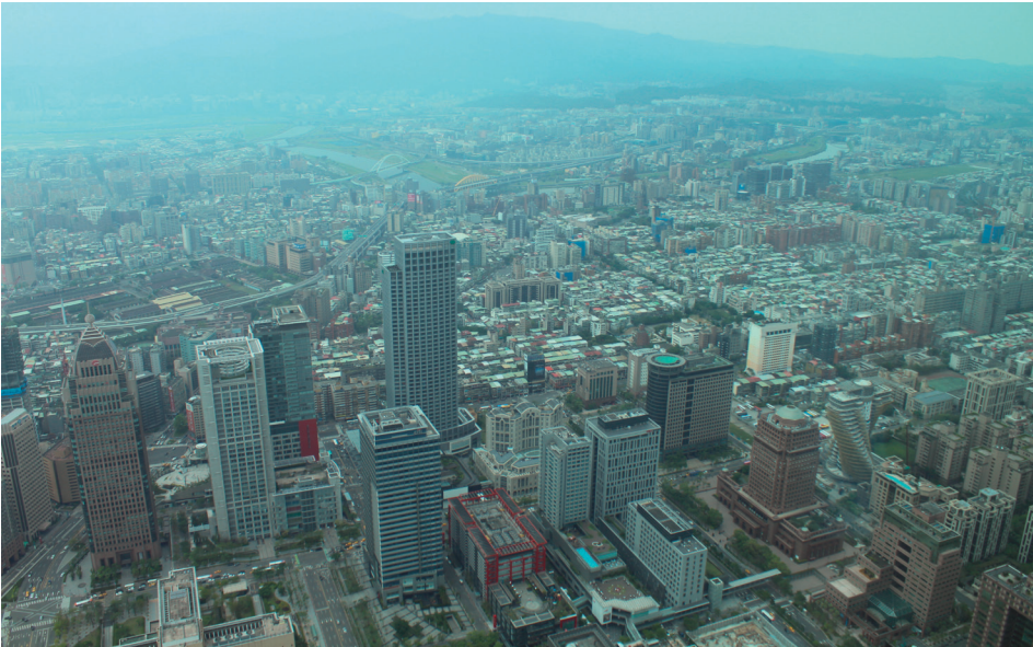
2. kép Tajpej látképe madártávlatból, a Tajpej 101 (101 emeletes) épületből Photo 2 Bird eye view of Taipei (from 101 Building)