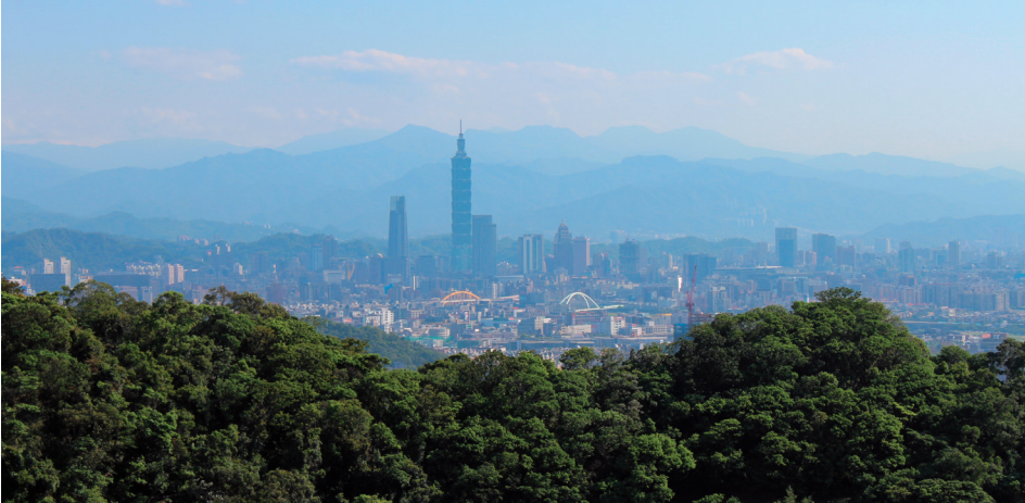
1. kép Tajpej látképe a környező hegyekkel Photo 1 A view of Taipei with the surrounding mountains

Tajvan gazdasági szerkezetében fokozatos hangsúlyeltolódás ment végbe a munkaerő-intenzív ágazatok felől a high-tech iparágak irányába. Ez utóbbiak közül a világgazdaság szempontjából is a legfontosabb az elektronikai iparág volt. Tajvan kiváló eredményeket ért el a félvezetők, az optikai-elektronikai, információtechnológiai, távközlési és elektronikai területen. Napjainkban a tajvani gazdaság súlypontja a nanotechnológia, biotechnológia, optoelektronika és az idegenforgalmi szolgáltatások irányában látszik elmozdulni, ezek az ágazatok alapvetően a fővárosban, Tajpejben és vonzáskörzetében koncentrálódnak (1-2. kép).