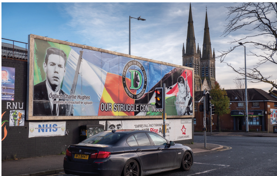
2. kép Palesztin mozgalmakkal szolidaritást vállaló nacionalista plakát a Divis Street/Northumberland Street sarkán, Kelet-Belfast katolikus negyedében

Forrás: Saját kép (kép készítésének ideje: 2023. 11. 11.)