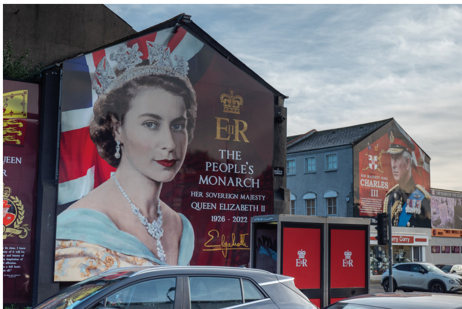
1. kép II. Erzsébet és III. Károly portréja a protestáns fellegvárnak számító kelet-belfasti Shankill Road/ Crimea Street sarkán (kép készítésének ideje: 2023. 11. 11.)

benálló felek nézeteinek kifejezési eszközeként és a teret aktívan formáló elemekként vizsgálni.