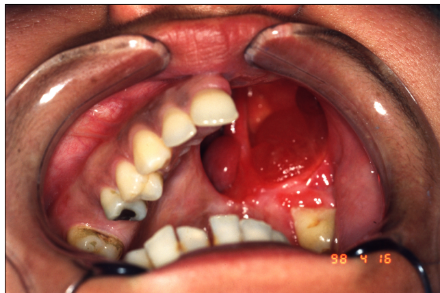
1. kép: A felső állcsont képe néhány hónappal a maxillarezekciós műtétet követően

A páciens 1997-ben, 25 éves korában maxillarezekciós műtéten esett át (1. kép), ezt követően egy interim, kapocs elhorgonyzású, obturátoros, részleges lemezes fogpótlás készült részére (2. kép), majd a műtétet követő 6 hónap elteltével kezdődött a végleges, obturátoros kombinált fogpótlás készítése. 2007-ben mandibularrezekciós műtéten esett át, ekkor az alsó fogak pótlására nem került sor. 2018 nyarán kereste fel ismét a Semmelweis Egyetem Fogpótlástani Klinikáját hogy az elhasználódott, elkopott, mozgathatóvá vált felső fog-