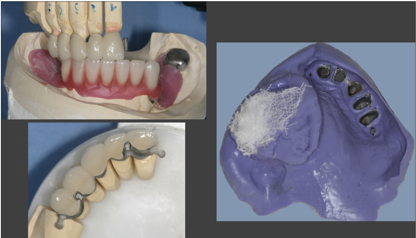
8. kép: A felső rögzített rész mattpróbája és az alsó részlegesen felállított fogpróba, valamint a felső situációs gyűjtő lenyomat monofázisos szilikon lenyomatanyag felhasználásával

mack®) situációs lenyomatot vettünk az orr- és orrmelléküregek tamponálása mellett (8. kép) [2]. A mestermintán és a szájból is ellenőriztük a fémlémezt, majd rögzítettük az interkuszpációs pozíciót harapásrögzítő szilikon segítségével (Occlufast+ Colour Zhermack®) [3]. Az overdenture és a kivehető rész fogpróbája során ellenőriztük az okklúziót, az archarmóniába való illeszkedést, továbbá a funkció közbeni (beszéd, nyelés, ivás) működését és a viaszból megformázott intranazális obturátor rész megfelelő kialakítását (9. kép).