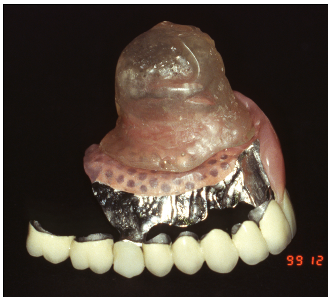
3. kép: Definitív, obturátoros kombinált fogpótlás laterális nézetből