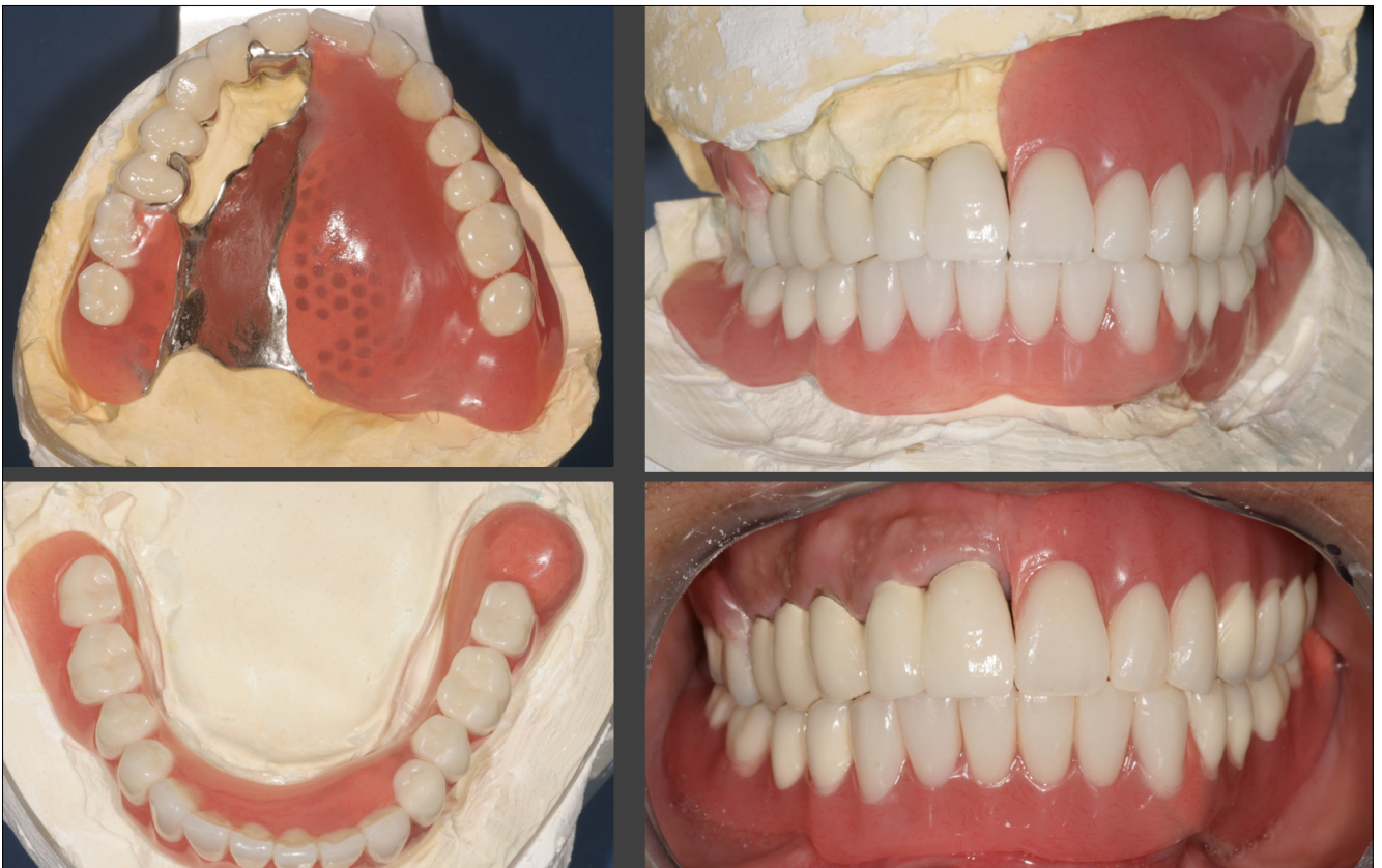
10. kép: A kész fogpótlások a mintán és a szájbán