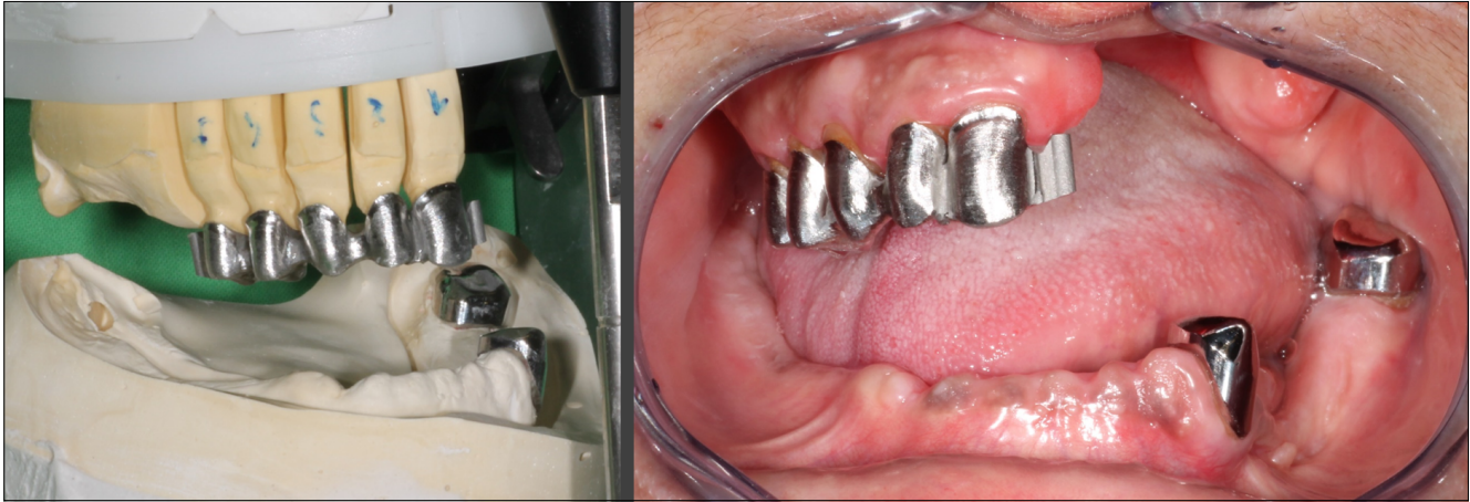
7. kép: A kombinált fogpótlás fix részének fémváza és a primer teleszkópok