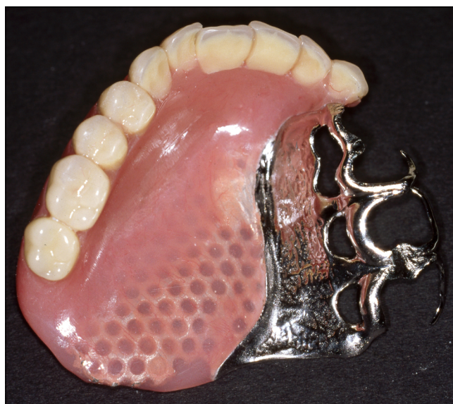
2. kép: Interim, kapocs elhorgonyzású, részleges lemezes fogpótlás occlusalis nézetből

pótlását újra készíttesse és alsó, hiányossá vált fogazatát pótoltsa.