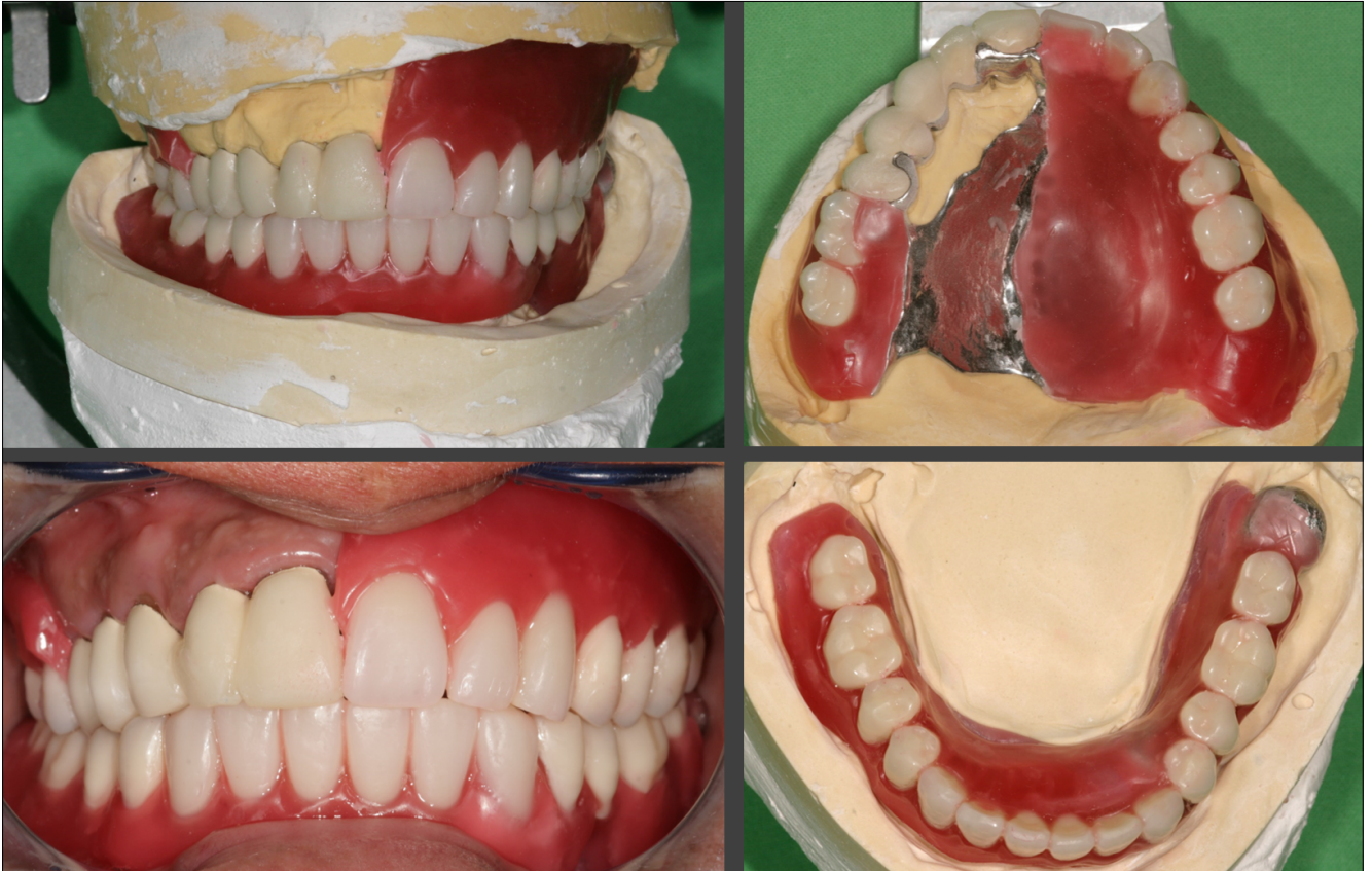
9. kép: A rögzített rész és a próbafogsorok a mintán és a szájbán