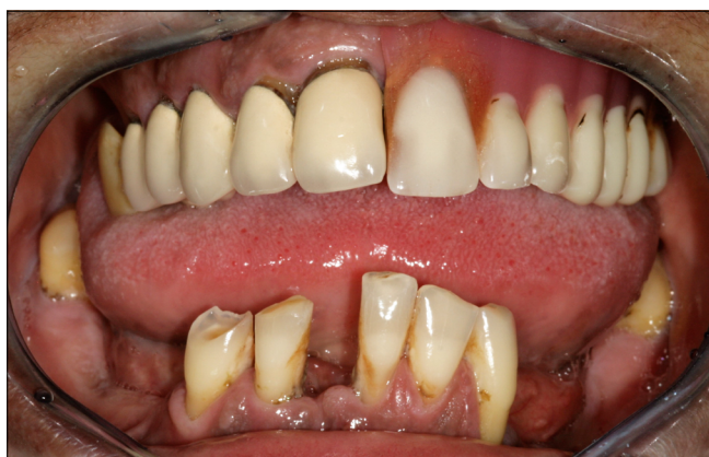
4. kép: Szájfotó a fogpótlásokkal. A mandibularezekció helye jól látható a bal alsó premoláris-moláris tájékon.