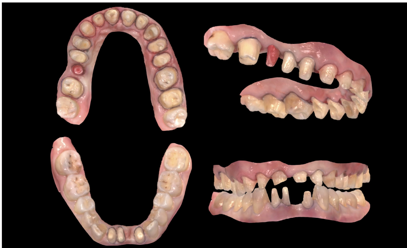
6. kép: Precíziós-szituációs szkenek