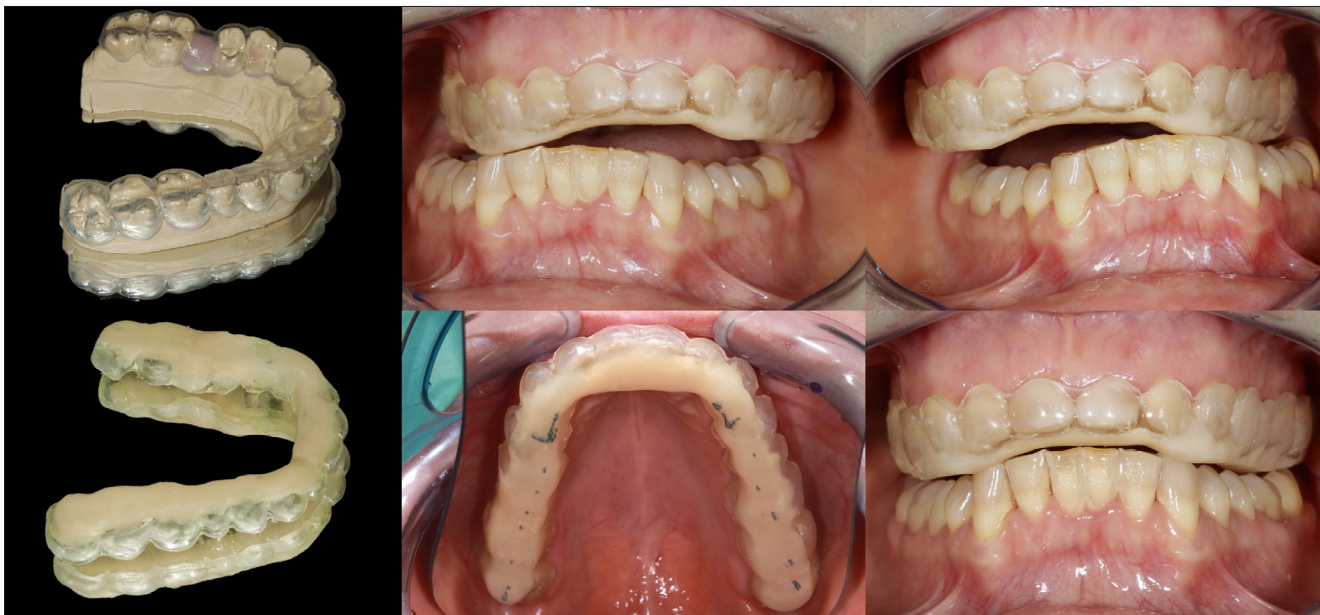
2. kép: Michigan-sín