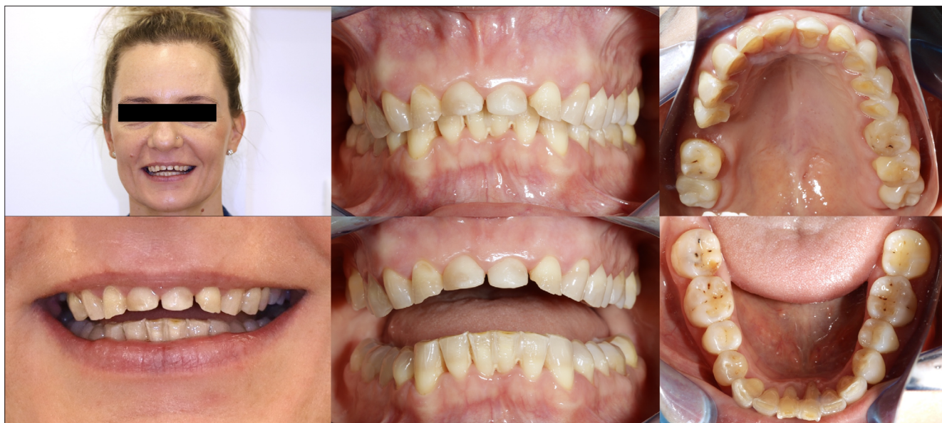
1. kép: Kiindulási fotók

fog reménytelen prognózisú, egyébiránt a parodontium megtartott volt, enyhe gingivitisszel és kevés supragingivalis fogkövel. A Fábán és Fejérdy protetikai foghiányosztályozás szerint a felső állcsont az 1.A, míg az alsó állcsont a 0. osztályba tartozott (1. kép).