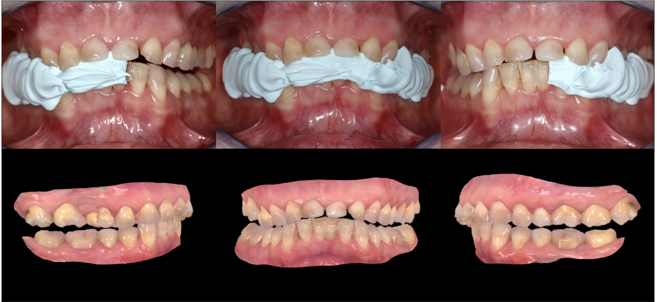
4. kép: Az új állcsontreláció rögzítése