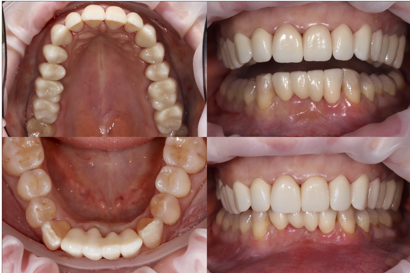
7. kép: Kész fogpótlás