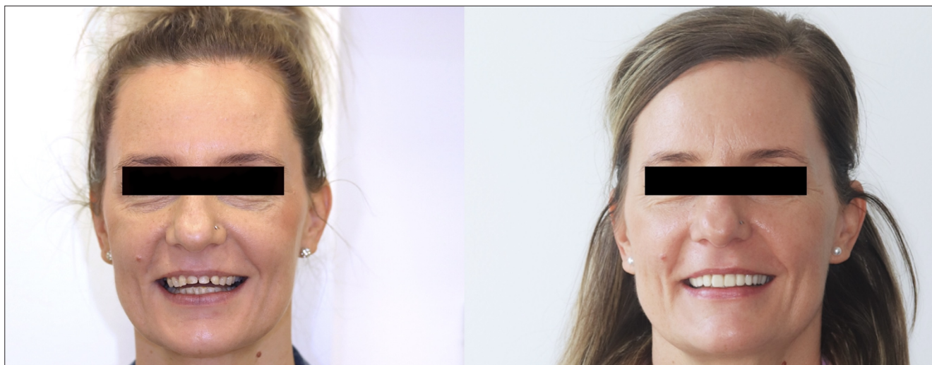
8. kép: Előtte-utána fotók

szájhygiénéről, a fogpótlás funkciójáról és esztétikájáról. Páciensünk félévente professzionális szájhygiénés kezelésen esik át, elégedettségét pedig a végső mosolyfotó kiválóan szemlélteti (8. kép).