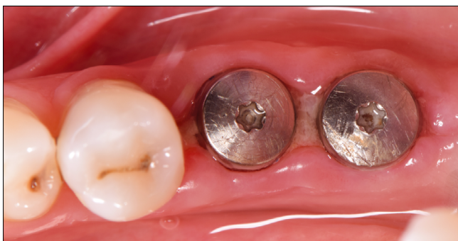
6. kép: Korai gyógyulás – 2 hét

A rövid távú gyógyulás során (varratszedés 2 hét után) már látható a megvastagított biotípus, valamint a kezdődő keratinizáció a szabadon maradt kollagén mátrix felszíneken. (6. kép)