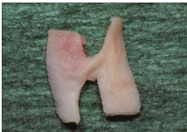
4. kép: „H” alakban megformázott kollagén mátrix

A gerincéli metszés a vékony keratinizált sáv közepén történt, hogy mindkét lebenyszél tartalmazza – ha kis mennyiségben is – a keratinizációhoz szükséges sejteket. Az implantátumok behelyezését követően a nagy primer stabilitásnak (35 Ncm) köszönhetően az implantátumokat gyógyulási felépítményekkel láthattuk el a műtét során. (2., 3. kép)