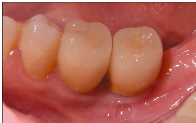
8. kép: Utánkövetés – 1 év

Az implantátumokra csavarral rögzített fix fogpótlás került, és 1 éves utánkövetés után is egészséges, stabil és esztétikus lágyszövet profilt tapasztaltunk, az egyéni szájhigiéne a nehezen elérhető terület ellenére is optimális volt. (8. kép)