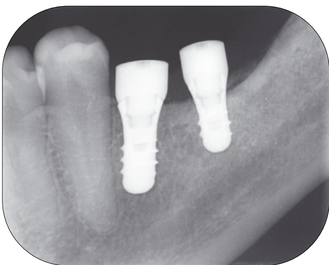
2. kép: Postoperatív periapicalis rtg.