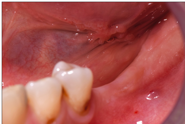
1. A és B kép: Kiindulási klinikai szituáció