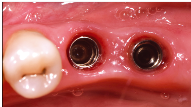
7. kép: Teljes gyógyulás – 2 hónap

A gyógyulás teljes befejeztével (2 hónap) a lágyszövet vastagodása és a keratinizáció kiszélesedése a területen egyértelműen látható, színben, textúrában eltérés a környező szövetektől nincsen, ellentétben a hagyományos szabad íny graft technikánál tapasztalható esetekkel. (7. kép)