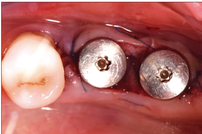
5. kép: Kollagén mátrix, gyógyulási csavarok és matracöltés által immobilizálva

A H alakú kollagén összekötő része fedte a két implantátum között szabadon maradt denudált gerincfelszínt, míg a „H” forma szélső részeit a lebenyszélek alá helyeztük be (tunnel-technikával).