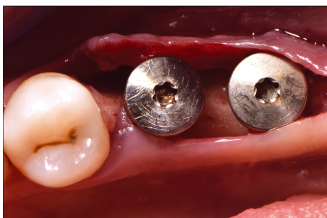
3. kép: Gerincéli metszés és gyógyulási csavarral ellátott implantátumok, behelyezést követően

ens nem dohányzó, szisztémásan egészséges, kimondottan jó szájhygiéjával rendelkezik, fogágybetegségtől mentes. A CT-vizsgálat eredménye alapján a bal alsó hiányzó molárisok (36, 37) területére standard átmérőjű (d: 4,1 mm) rövid (36: 8 mm; 37: 6 mm) (Straumann Roxolid) implantátumokat terveztünk behelyezni csavarozott korona felépítménnyel.