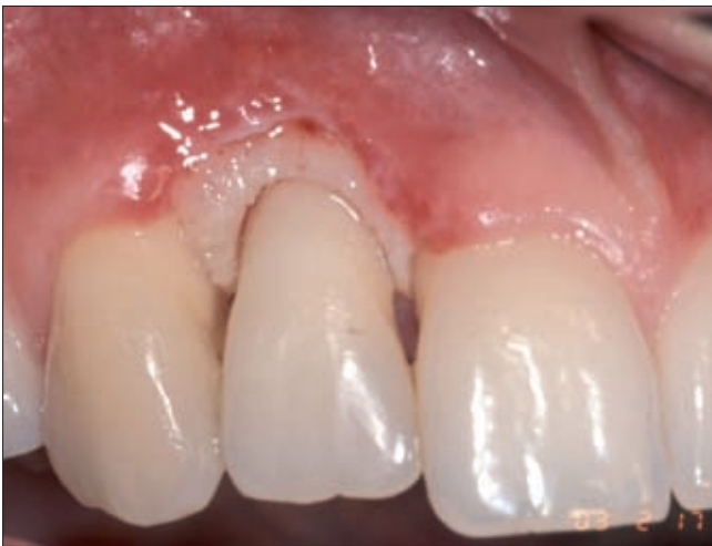
1a. ábra. Kiindulási klinikai kép.

Páciensünk klinikánkon két héttel a gyökérkezelés után jelentkezett. Az érintett fog körül a szabad ínszél és a gingiva propria teljes egészében hiányzott, a sző-