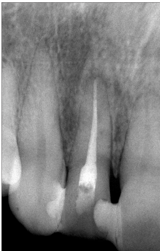
3. ábra. Végleges gyökértömés radiológiai képe

rendeltünk (amoxicillin 500 mg + klavulánsav 125 mg) [Augmentin 675 mg, GlaxoSmithKline, Brentford, Egyesült Királyság] és szükség szerint fájdalomcsillapítót