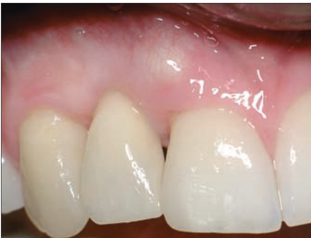
6a. ábra. Hároméves kontroll

A műtét utáni 9. évben betegünk ismét panasszal tért