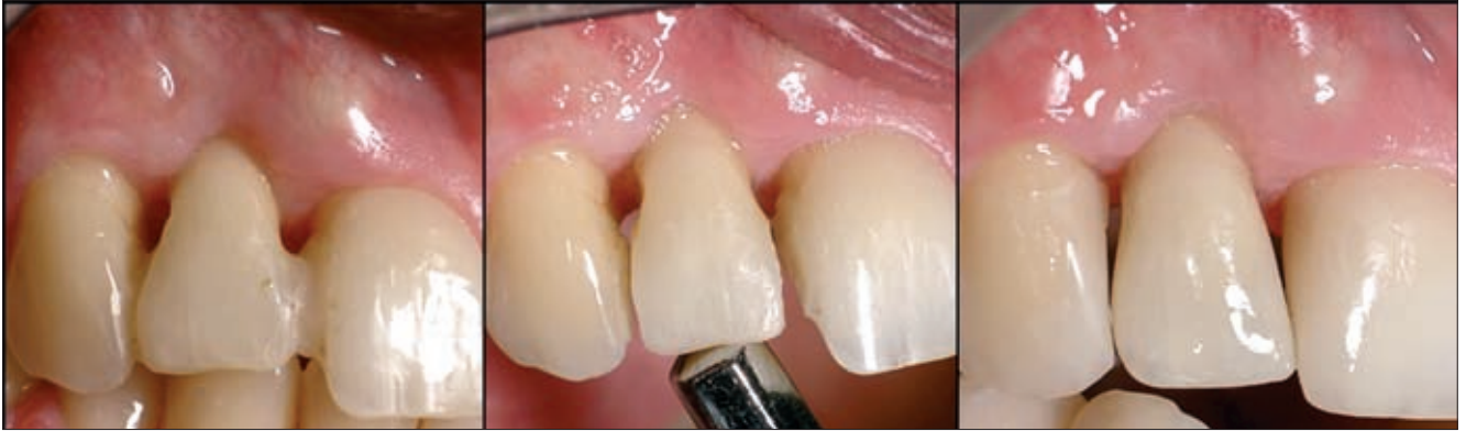
5 a–c. ábra. Másfél évvel a műtét után a parodontális szövetek állapota stabilnak bizonyult, a mozgathatóság megszűnt, ezért a sánt eltávolítottuk és direkt kompozit felépítést végeztünk

(6a. ábra). A fog stabilitása nem romlott, és állapota teljesen stabilizálódott. Mivel páciensünk elégedett volt az esztétikai eredménnyel, további mukogingivális korrekciós műtetre nem került sor. A hétéves kontroll vizsgálat során páciensünk parodontiuma teljesen épnek bizonyult, a fog egyáltalán nem volt mobilis és a tasak 3–4 mm-nél nem volt mélyebb. A papilla tovább erősödött és a röntgenfelvétel szerint, az interdentá-