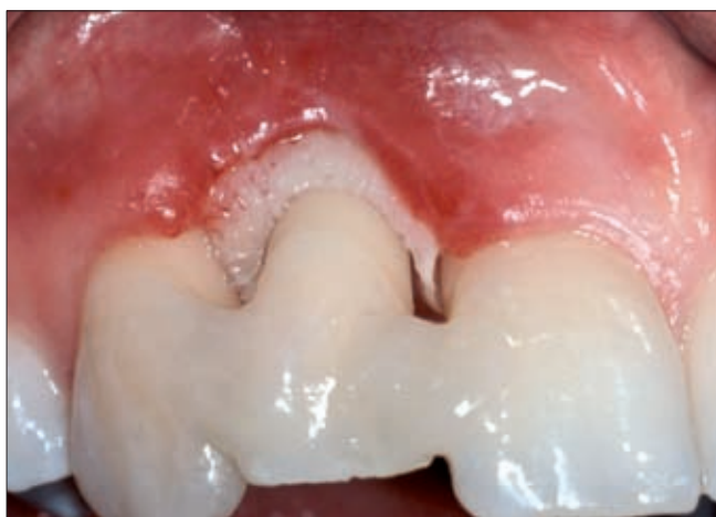
2. ábra. A mobilissá vált fog ideiglenes sínezése üvegszállal erősített kompozittal

jektív panaszai csökkentek és az elkövetkező 10 hónap során a lézió lágyrész-borítása sokat javult. Ekor a funkció és esztétikum helyreállítása érdekében