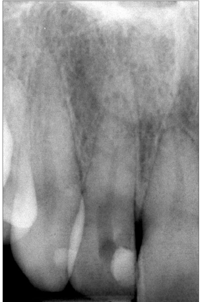
1 b. ábra. Kiindulási röntgenfelvétel

tó a laterális és periapikális gyökérhártyarés kiszélesedése mellett (1b. ábra). Mielőtt klinikánkra került, páciensünk, már több fogorvossal konzultált, akik leginkább az extrakciót javasolták. Ugyanakkor betegünk szerette volna a kismetsző fogát minden áron megtartani, hiszen fogazata és parodontiuma egyébként egészséges volt.