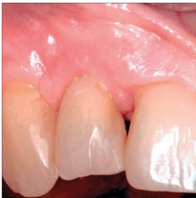
8. ábra. Műtét utáni kontroll egy évvel a korrekciós műtét után

tek. Betegünk első jelentkezése után majd tíz évvel a jobb oldali felső kismetsző foga továbbra is funkcióban van, parodontális állapota kielégítő (8. ábra).