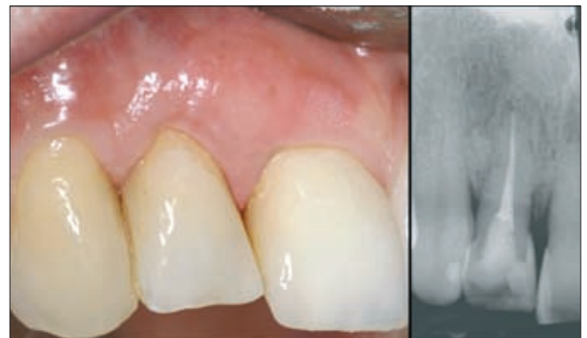
6 b, c. ábra. Hétéves kontroll

kompozit sánt eltávolítottuk, hogy megfigyelhessük, milyen mértékben rögzült a fog. Mivel a kismetsző teljesen stabilizálódott, úgy döntöttünk, hogy az érintett fogakat direkt kompozit héjjal, illetve tömással állítjuk helyre (5. a–c ábra). Ezt követően betegünket először háromhavonta, majd később félévente rendeltük vissza. Ennek során az ínypapilla jelentős mértékű érési folyamaton ment át, és kezdte kitölteni az approximális fogközt