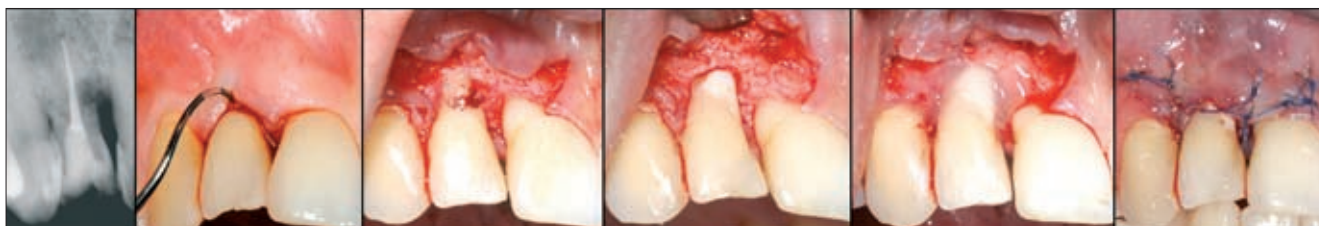
7 a–f. ábra. A 8. évben kialakult külső gyökér-rezorpció röntgenképe és műtéti ellátása üvegeionomer tömással és zománcmátrix derivátummal

tegekben kialakuló ANUP végül a rögzítő apparátus súlyos pusztulását okozza [6]. Bár a prezentált esetben is súlyos ínynekrózissal és alveoláris csontveszteség-