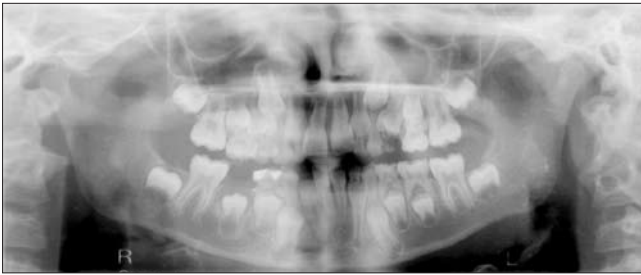
4. ábra. OP-felvétel, 2010, október. A 45 fogcsíra előtörésben megelőzte az ellenoldali második premolarist

Az egyéves ellenőrzés alkalmával tapasztaltuk, hogy a páciens napi 10–12 órában hordja a kivehető helyfenntartó készüléket, így biztosítva van a 45 fog előtöréséhez szükséges elegendő hely. Az OP felvételen jól látható, hogy a 45 fogcsíra előtörésben megelőzte az ellenoldali második premolarist. Ez a 85 tejfoggyökér hiányának tudható be, mert így semmi nem akadályozza a fogcsírát az eruptióban. Nagy valószínűséggel a 45 fog előtörése hamarabb fog bekövetkezni, mint a többi premolarisé (4. ábra).