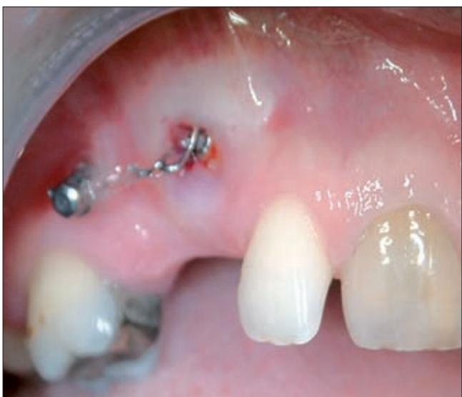
3a ábra. A horgonylat terhelése a lágyrészek gyógyulása után

lól az 5–6 vagy a 6–7 fogak közé helyeztük. A minicsavarok behelyezésével egy időben eltávolítottuk a perisztáló tejfogakat, feltártuk az impaktált szemfogakat, melyekre ortodontiai brackettet ragasztottunk. A horgonylatot a lágyrészek gyógyulása után terheltük. Az ortodontiai fogmozgatóhoz nikkel-titán rugót és elasztikus gumigyűrűket használtunk, folytonos erővel (3a–c ábra). A rögzített fogszabályozó készüléket az impaktált szemfog elmozdulása és tengely korrekciója után helyeztük fel. Ezzel egy időben távolítottuk el a minicsavart.