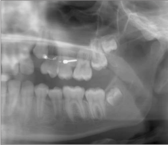
4b ábra. 7 hónappal a kezelés kezdete után