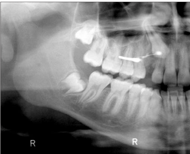
5b ábra. A perzisztáló tejfog és a számfeletti fog eltávolításával egyidejűleg minicsavart helyeztünk be, és megkezdtük a szemfog extrúzióját

lett rövidebb ideig viselniük a pácienseknek. Egy páciensnél egy, egy másik esetben mindkét szemfog kezelése sikertelen volt ankilózis miatt. Egy esetben a palatinálisan behelyezett minicsavart bukkálisan vála-