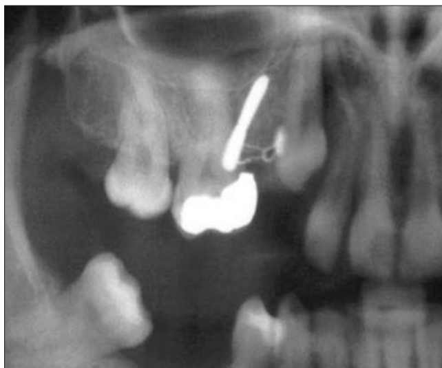
3c ábra. A fog elmozdulása 10 hónappal később