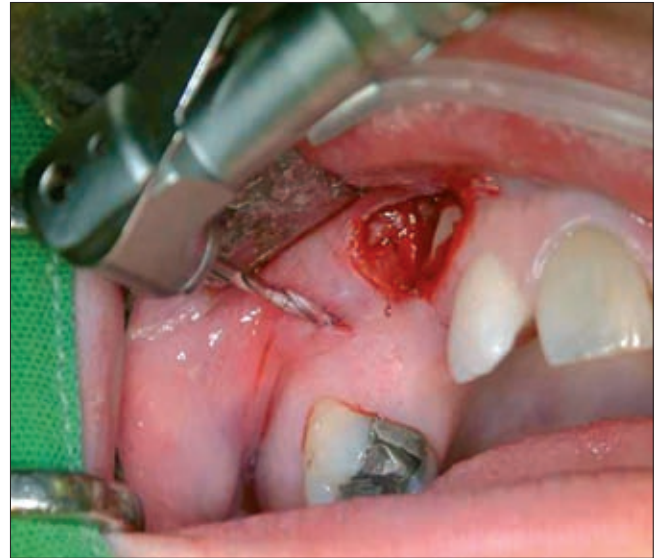
2a ábra. Előfúrás

2003 és 2007 között 28 páciensen 31 impaktált maxilláris szemfog esetén alkalmaztunk ortodontiai minicsavart, szkeletális elhorgonyzás céljából. Tizenhat nőt és 12 férfit kezeltünk, az életkor 14 és 63 év között változott (átlagéletkor 24 év). Huszonkét fog palatinálisan, 9 bukkálisan helyezkedett el. Klórhexidinnel tör-