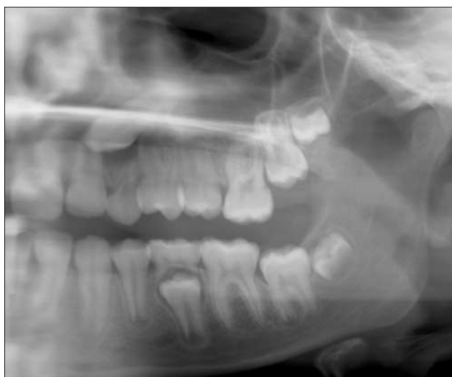
4a ábra. 14 éves páciens a kezelés kezdete előtt