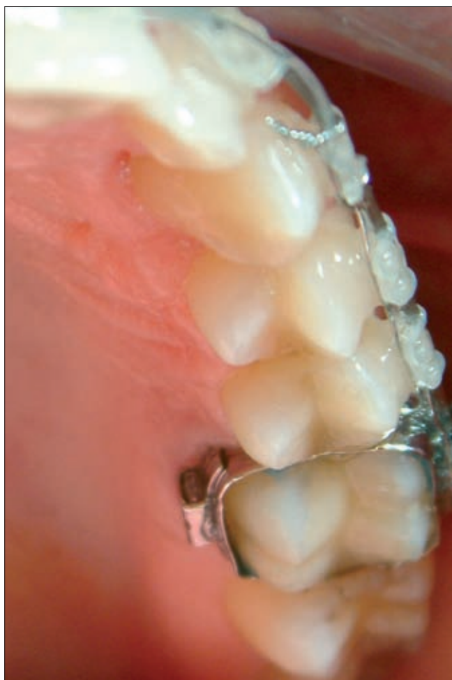
6c ábra. A kezelést rögzített fogszabályozó készülékkel fejeztük be

dékozó fisztula és szűnni nem akaró fájdalom miatt, az ortodonciai kezelés megkezdése előtt eltávolítottuk. További 3 csavart kellett eltávolítani a szemfog elmozdulása után, de a tengely korrekciója előtt, a fejrész