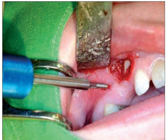
2b ábra. A minicsavar behelyezése

tendő öblítés után a minicsavarokat (Leone, Firenze, Olaszország) helyi érzéstelenítésben, előfúrást követően, a mukoperioszteumon keresztül helyeztük az interradikuláris szeptumba. 1,5 mm átmérőjű, 8–10 mm hosszúságú csavarokat alkalmaztunk. A bukkálisan elhelyezkedő szemfogak esetében a csavart az áthajlás felől a moláris és premoláris területre (1a–b; 2a–c ábra), a palatinálisan lokalizált fogaknál a száypad fe-