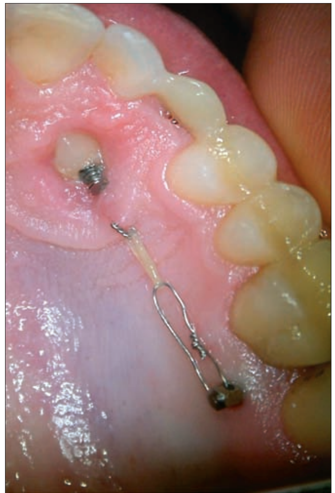
6a ábra. 35 éves páciens palatinálisan impaktálódott szemfogának extrúziója

lett rövidebb ideig viselniük a pácienseknek. Egy páciensnél egy, egy másik esetben mindkét szemfog kezelése sikertelen volt ankilózis miatt. Egy esetben a palatinálisan behelyezett minicsavart bukkálisan vála-