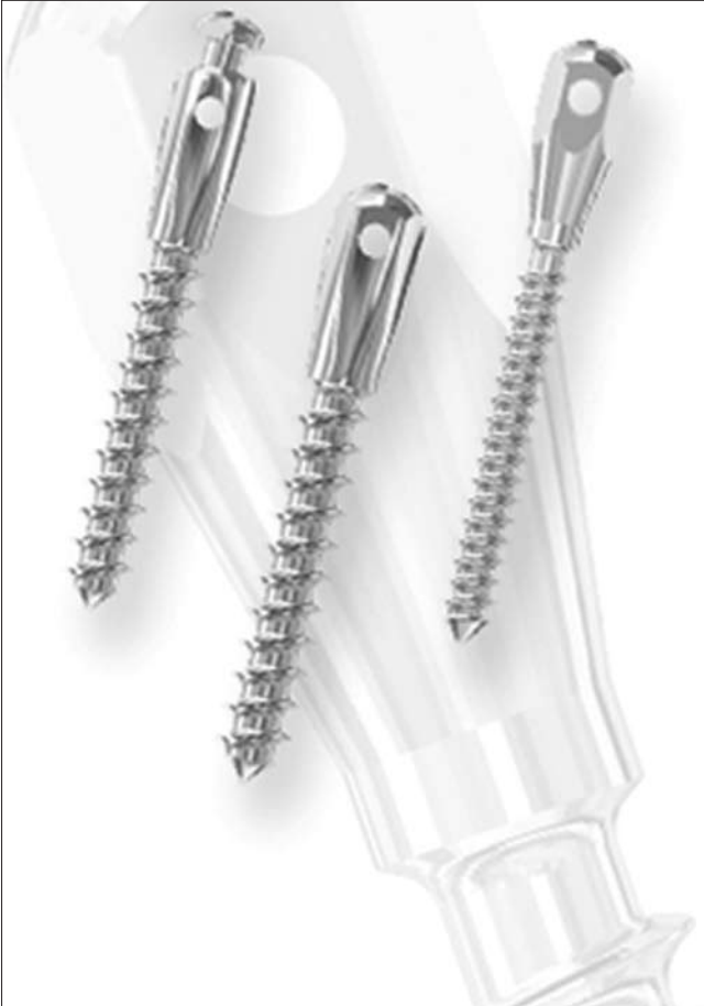
7. ábra. Leone minicsavarok

a rendelkezésre álló, minél nagyobb csontmennyiség figyelembevételével, a horgonylat behelyezésére a száypad felőli oldalon az 5–6 vagy 6–7, az áthajlás felől az 5–6 fogak közötti területet tartjuk legideálisabbnak.