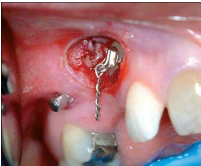
2c ábra. A bracket felragasztása a feltárt szemfogra