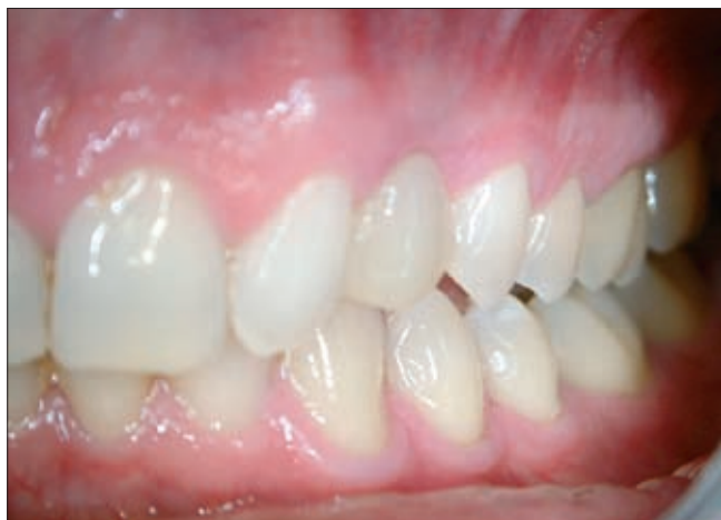
6b ábra. A tejfog extrakciójából származó foghiányt üvegszállal megerősített kompozit híddal pótltuk ideiglenesen, mellyel tökéletes esztétikai eredményt értünk el

dékozó fisztula és szűnni nem akaró fájdalom miatt, az ortodonciai kezelés megkezdése előtt eltávolítottuk. További 3 csavart kellett eltávolítani a szemfog elmozdulása után, de a tengely korrekciója előtt, a fejrész