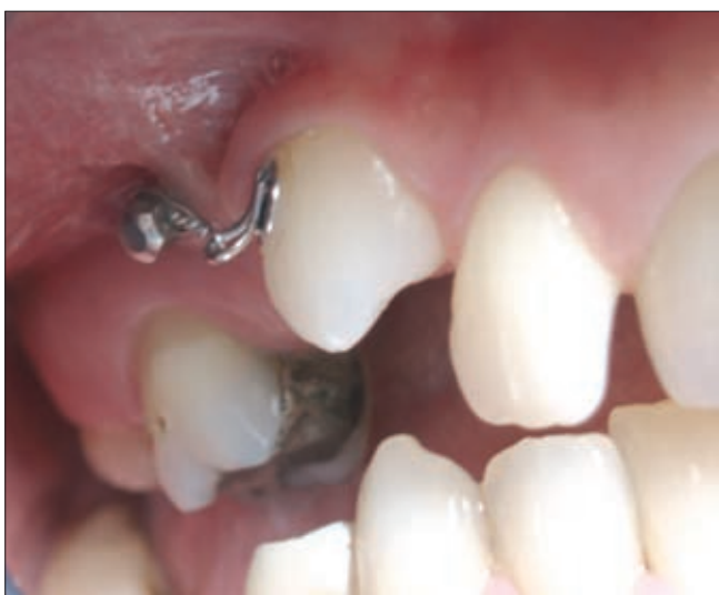
3b ábra. A fog elmozdulása 10 hónappal később

Az impaktált szemfogakat 27 esetben (87%) sikeresen extrudáltuk (4a–b; 5a–c ábra; 6a–c). A minicsavarral végzett átlagos kezelési idő 6, 8 hónap volt, ezáltal a rögzített fogszabályozó készüléket ennyi idővel kel-