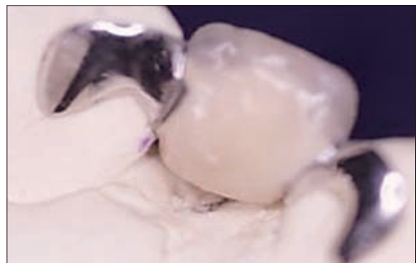
3. ábra. Ragasztott hid

Gondos kivitelezés esetén a ragasztott hidak jó ideiglenes megoldást jelentenek a foghiányok ellátásában.