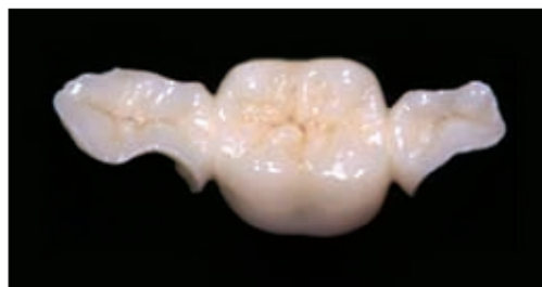
1. ábra. Inlay elhorgonyzású kerámiahíd

tauráció szélének elhelyezése kedvező [11, 25]. Előnyük, hogy tömött fogak esetén a szuvasodások és