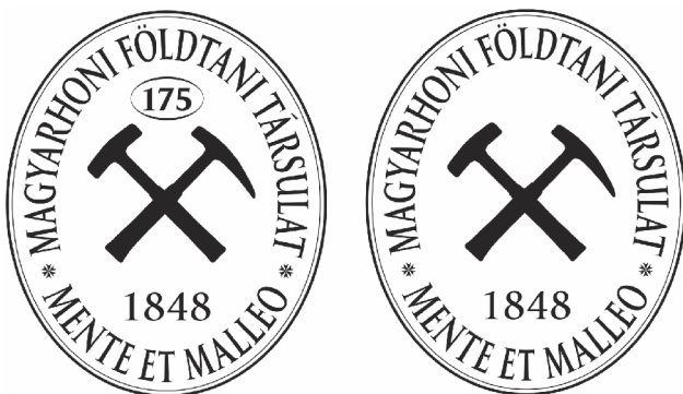
2. ábra. A MFT évfordulós logója és a lehetséges régi-új logó

lő társadalmi és kormányzati megbecsülésben részesüljön”, míg „az MFT vállalja, hogy több mint ezer főt számláló tagságával szakmai és erkölcsi támogatást és szakmai segítséget nyújt az SZTFH részére felelősségteljes munkájának ellátásához”. Azt gondolom, a hosszú, többfordulós egyeztetés eredményeként megszületett megállapodás megfelelő alapot biztosít arra, hogy a földtani kutatást érintő mindenkori állami szándék a Társulaton keresztül közvetlenül jusson el a hazai geológusokhoz, s a szakmában felmerülő, szabályozást érintő kérdések is utat találjanak a döntéshozók felé. Az elmúlt néhány hónapban mindkét irányú kapcsolatra több pozitív példa adódott, és azon dolgozunk, hogy a megállapodás biztosított keretet minél gazdagabb tartalommal tudjuk folyamatosan megtölteni. Az előzők mellett ez a dokumentum biztosítja azt is, hogy a közgyűlést újra itt, a hagyományos helyen tarthatjuk.