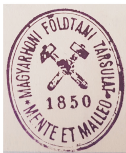
1. ábra. Az 1913-as iktatókönyv a Társulat eredeti logójával

bennük a Társulat szerepe, mely összeköti a magyar geológustársadalmat az európai geológusok közösségével, a tágabb szakma hazai szereplőivel, az érdeklődő társadalommal és az ifjúsággal.