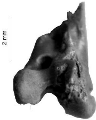
3. ábra. Rallicrex litkensis n. sp. bal oldali lábszárcsont disztális része (P 2010.3)