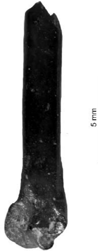
5. ábra. Rallicrex litkensis n. sp. jobb oldali ulna, disztális töredék (P 2010.14/1.)

Leírás: A töredékes disztális epifízis jellegei megegyeznek a R. polgardiensis fajéval, amelynél 8 db lelet Polgárdiból és egy Beremend 26-ról ismert. A kolozsvári leleteknél csak a tibiotarsus proximális epifízise ismert. Méretek tekintetében a R. polgardiensis -nél az F=4,21–5,80 mm, míg a G=4,42–5,98 mm. Az új fajnál ezek a méretek beillenek a mérethatárok közé. A Mátraszőlős 1 anyag előzőleg a R. polgardiensis -hez lett sorolva (KESSLER 2009b), de kora az új fajnak megfelelő. Valószínűsíthető, hogy a három Kárpát-medencei Rallicrex faj az endemikus nem egymást követő változatainak tekinthető és az oligocéntól a pliocén végéig élt a területen.