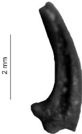
4. ábra. Rallicrex litkensis n. sp. karomcsont (P 2010.27).

Figure 4. Rallicrex litkensis n. sp. phalanx ungularis (P 2010.27)