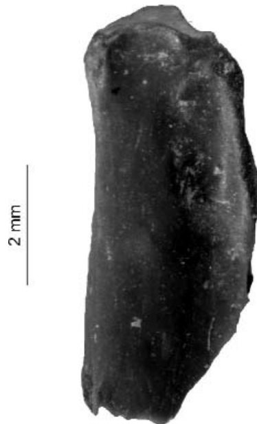
6. ábra. Rallicrex litkensis n. sp. kézujjperc (P 2010.14/2.)

Figure 5. Rallicrex litkensis n. sp. distal part of left ulna (P 2010.14/1.)