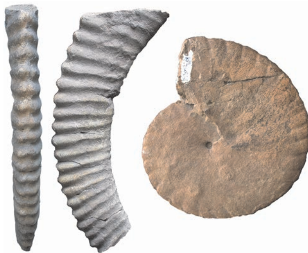
4. ábra. Két különlegesen jó megtartású, bár töredékes zónajelző alsó-kréta (barremi) ammonitesz a gerecsei Bersek-hegyen gyűjtött 11 000 cephalopodából. A kutatást FÜLÖP József irányította, a tényleges gyűjtőmunkát a STEINER Tibor vezette csapat végezte. Balról: Moutoniceras moutonianum (d’Orbigny), méret: 12 cm; jobbról: Subpulchellia changarnieri (Sayn), 9 cm

A szisztematikus gyűjtések révén felhalmozódott kövületanyag európai viszonylatban egyedülálló volt, és kellő alapot biztosított a hazánkban folyó további őslénytani kutatásokhoz, amelyeknek egyik fő célpontjává a jura vált. A többek között HANTKEN Miksa, HOFMANN Károly (1839–