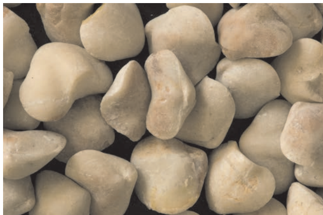
5. ábra. Linguithyris aspasia (Zittel) brachiopoda-faj példányai a Bakonyból származó Hierlatzi Mészköből. Egy-egy példány mérete kb. 1,2 cm

Figure 5. Linguithyris aspasia (Zittel) – brachiopods form the Jurassic Hierlatz Limestone of the Bakony Mountains. One specimen is about 1.2 cm in size