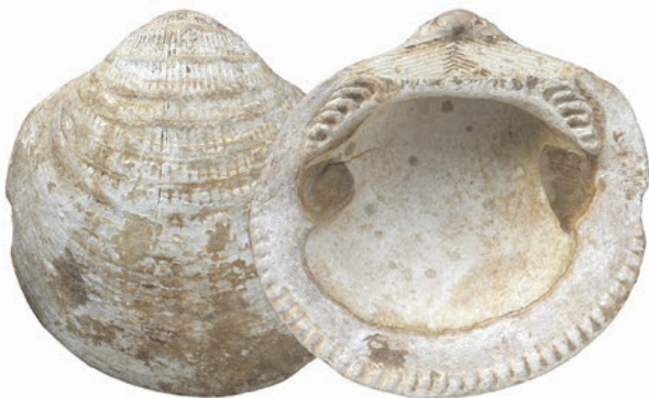
7. ábra. Glycymeris latiradiata (a régebbi irodalomban „ Pectunculus obovatus ”), a felső-oligocén egri emelet sekélytengeri üledékeinek, például az „ Pectunculusos homoknak ” az emblemikus ősmaradványa. A példány szélessége 6 cm

A kora- és középső-miocén korú gerinctelen állatokkal foglalkozó tanulmányok körében egyértelműen a puhatestűek vitték a prímet. BOGSCH László (1906–1986), az Eötvös Loránd Tudományegyetem Őslénytani Tanszékének későbbi igazgatója két Nógrád megyei lelőhelyről is gazdag badeni faunát dolgozott fel (BOGSCH 1936, 1943). CSEPREGHYÉ MEZNERICS Ilona (1906–1977), a Természettudományi Múzeum Föld- és Őslénytani Tárának munkatársa, majd vezetője több monográfiát is írt ebben a témakörben, melyek a hidasi, a kelet-cserhádi, a szobi és a letkési — elsősorban badeni korú — puhatestű faunákat dolgozták fel (CSEPREGHYÉ MEZNERICS