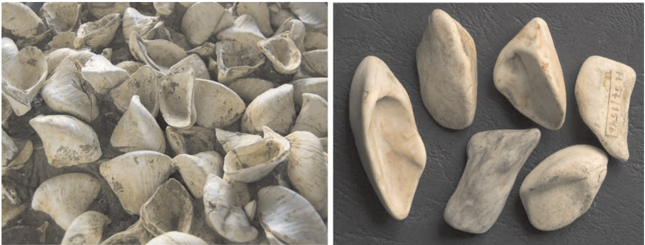
9. ábra. A) Congeria ungulacprae (Münster) tömeges felhalmozódása egy Dobóráról származó pannóniai kőzettömbben. A teknők vastag, lekoptatott bübi része a kecskeköröm. B) Legendák kőülete – valódi balatoni kecskekörmök a tihanyi magaspártok tövéből. A kagylómaradványok mérete 2–3 cm

LŐRENTHEY óriási energiát fektetett abba, hogy a ROTH Lajos (1879) által a Földtani Közlöny egy cikkének lábjegyzetében bevezetett és utána feledésbe merült „pannóniai rétegek” elnevezést felújítsa és meghonosítsa az akkoriban elterjedten használt „pontusi rétegek” elnevezés helyett. Lő-