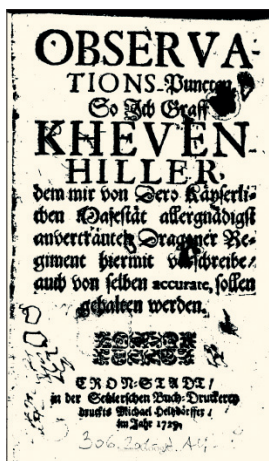
3. kép. Az Observations-Puncten 1729-es kiadásának címlapja

Érdemes azonban megjegyezni, hogy a szakirodalomban többen az Observations-Puncten valamely későbbi kiadására hivatkoznak, így elsikkad az a fontos momentum, hogy a fentebb említett császári rendelet után ez a rendelkezés volt a legelső ilyen összeállítás a Habsburg sereg történetében. 19