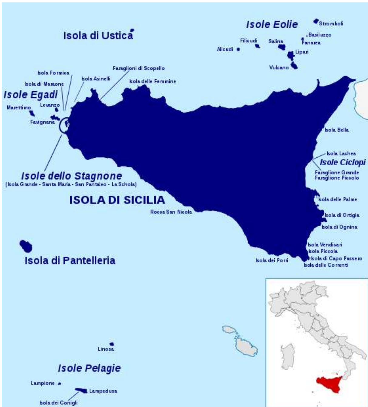
1. ábra: A Szicíliai-szoros térképe