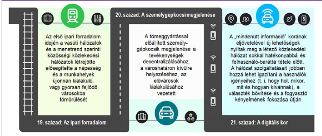
1. ábra: A MaaS koncepció kialakulásához vezető műszaki fejlődés. (Forrás: [3])

Ugyancsak ilyen kezdeti lépéseknek tekinthetjük olyan innovatív közlekedési szolgáltatások, illetve ilyenek nyújtására szakosodott, magánvállalkozó szolgáltatók megjelenését, mint pl. a következők: