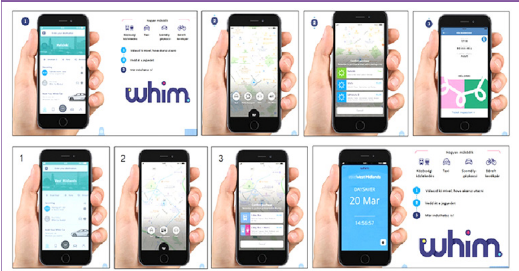
2. ábra: AWhim applikáción alapuló kísérleti rendszer Finnországban és Angliában. (Forrás: [8] [9])

Svédországban, Göteborgban 2013-2014 között fél évig, 70 háztartás (mintegy 200 felhasználó) részvételével működött egy hasonló, UbiGo elnevezésű kísérleti rendszer, amelynek középpontjában szintén a közlekedés, mint szolgáltatás állt, a saját tulajdonú autó használatának elhagyásával. Itt nem havi csomagokban, hanem pénzért előre megvásárolt kreditekben kellett fizetni az igénybe vett közlekedési szolgáltatásokért. A kísérletet sikeresnek ítélték, de folytatására (sem Göteborgban, sem Stockholmban, ahol 2018 márciusára ígérték a rendszer bevezetését), eddig nem került sor [12].