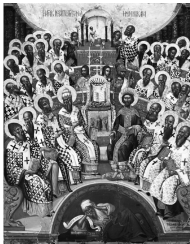
3. kép. Az első Niceai zsinat. Ikon, Michael Damaskinos, 1591, Sínai Szent Katalin Múzeum, Heraklion, Kréta