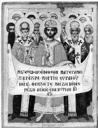
1. kép. Az első Niceai zsinat. Ikon, Protaton templom, Athos hegy, Görögország, 1770

Az alábbiakban azokat az ikontípusokat tekintem át röviden, amelyek magát a zsinatot jelenítik meg. Az ikonok kialakulásának pontos dátumát nehéz meghatározni, de bizonyosan nagy hatást gyakorolt az ünnep beiktatása, illetve a himnuszok megalkotása.