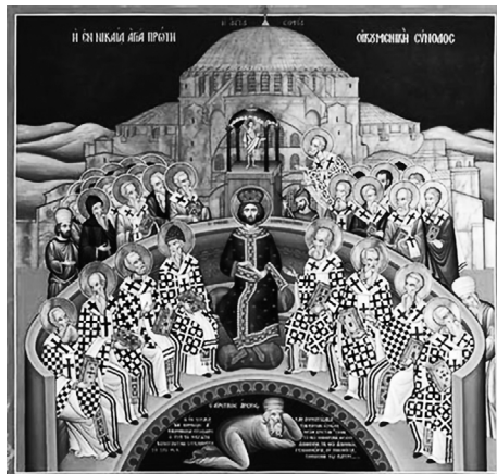
2. kép. Az első Niceai zsinat. Ikon, Mégalo Meteoron kolostor, Görögország. Az ikon alján az elítélt Ariosz

A zsinaton történt csodák közül kettő közismert. Az első ikon Szent Szipridon csodáját mutatja