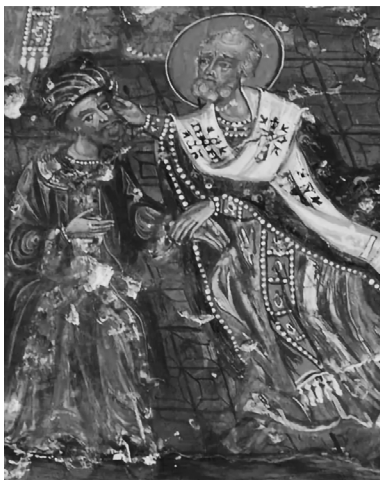
5. kép. Múrai Szt. Miklós arcon üti Ariost a niceai zsinaton. Ikon, Sümela kolostor, Törökország

A második ikon Szent Miklós püspök tettét örökíti meg, amikor a püspök pofon ütötte Ariost a blaszfémia miatt (5. kép). A hagyomány szerint tette miatt felfüggesztették hivatalából és elbocsátot-