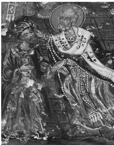
5. kép. Mürai Szt. Miklós arcon üti Ariost a niceai zsinaton. Ikon, Sümela kolostor, Törökország

A második ikon Szent Miklós püspök tettét örökíti meg, amikor a püspök pofon ütötte Ariost a blaszfémia miatt (5. kép). A hagyomány szerint tette miatt felfüggesztették hivatalából és elbocsátot-