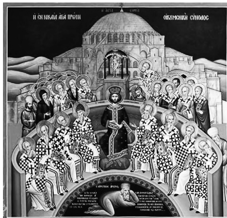
2. kép. Az első Niceai zsinat. Ikon, Mégalo Metéon kolostor, Görögország. Az ikon alján az elítélt Ariosz

A zsinaton történt csodák közül kettő közismert. Az első ikon Szent Szipridon csodáját mutatja