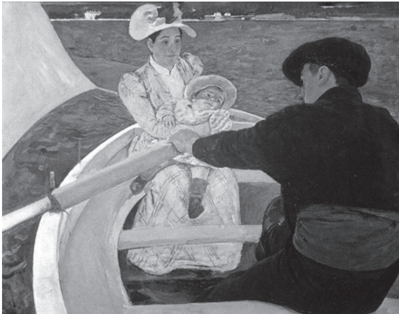
Mary Cassatt: Csónakázók (1893)

A tisztán kultúratudományi megközelítés legfőbb akadálya, hogy a kutató a vizsgált időszak újrateremtésére és megértésére egyaránt képtelen. Míg az interdiszciplináris megközelítés egyfajta megoldást kínál azzal, hogy alkalmazási területét kiszélesíti a populáris kultúrára, sajtókutatásra, társadalmi nemek tanulmányára, történettudományra, szociológiára, politikára, közgazdaság-tudományra stb. – végül mégis frusztrációt eredményez: egyre többet és többet tudunk például 1908 Budapestjéről, mégsem vagyunk képesek oly módon látni a fővárost, ahogyan azt 1908-ban tették. A komparatiztika által létesített absztrakt mező megszabadítja a szöveget határaitól, egyfajta szabad asszociációt biztosít, per se , mely figyelmen kívül hagyja a kulturális termékekhez kötődő időt, helyet, politikai és társadalmi hatalmat.