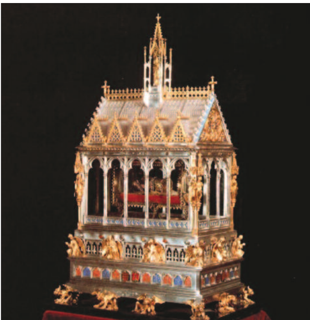
4. ábra. A neogótikus ereklyetartó