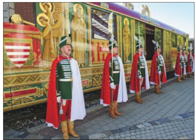
6. ábra. Az Aranyvonat