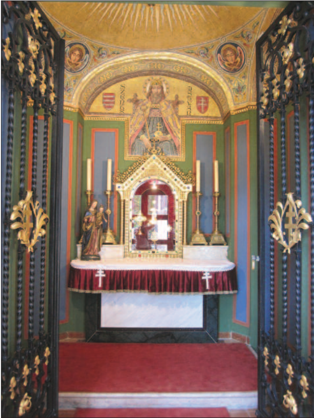
8. ábra. A rekonstruált Szent Jobb kápolna