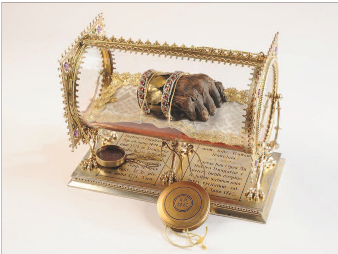
1. ábra. A Szent Jobb

A középkorban Buda várában állt a Szt. Zsigmond templom, de ez a várnak a törököktől való visszafoglalásakor rommá lett (alapfalai még láthatók). Nevét (titulusát) átvitték a királynő által a XVIII. sz. második felében építtetett, budavári Királyi Palota templomára,