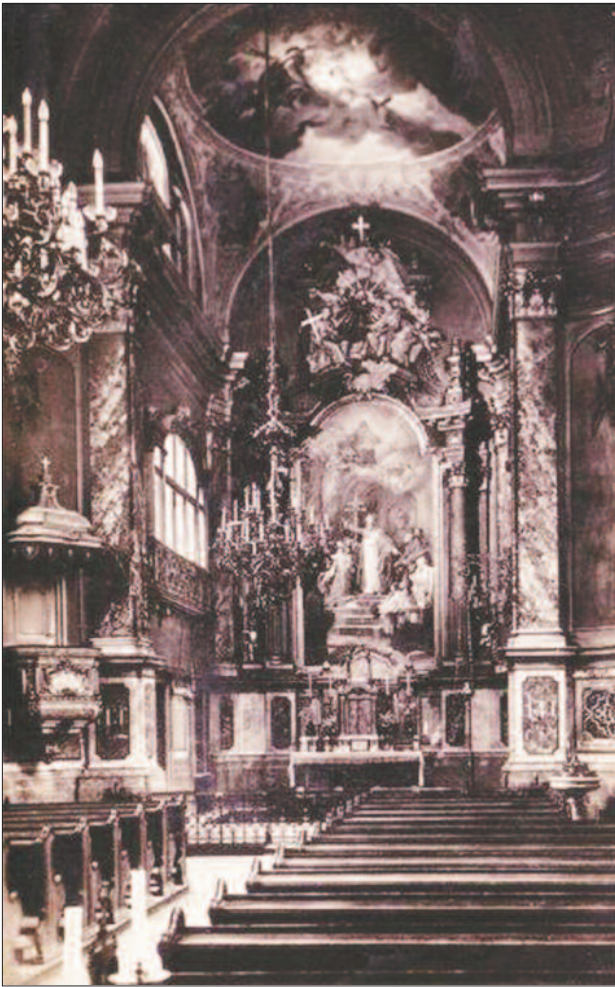
3. ábra. Az egykori vártemplom belseje