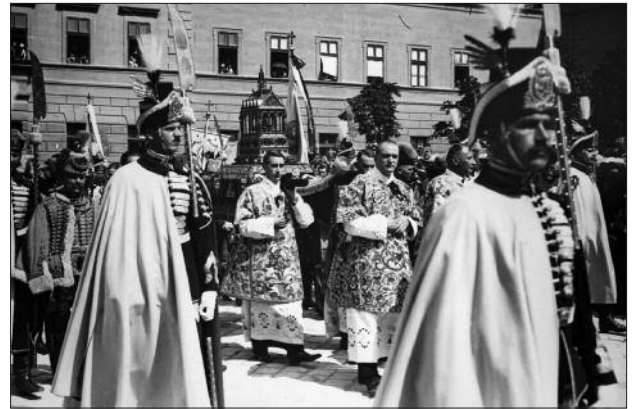
5. ábra. Szent István-napi körmenet