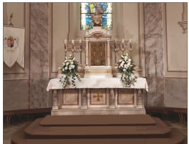
7. ábra. A vártemplom főoltára Pilisvörösváron