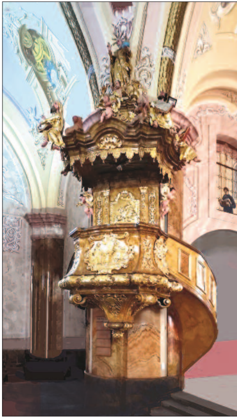
6. ábra. A budavári karmeliták szószéke Jánoshalmán