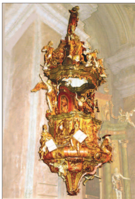
11. ábra. A szolnoki, volt ferences templom szószéke

Az 1055-ben alapított tihanyi bencés apátság Szt. Ányos temploma rokokó berendezésének (oltárok, padok, szószék, orgonaszekrény) asztalosmunkáit 1753