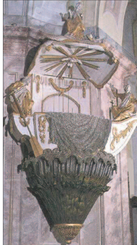
18. ábra. A császári szószék