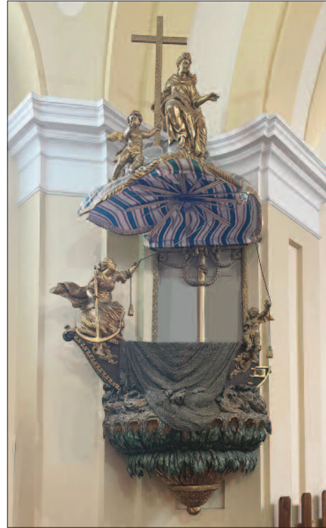
17. ábra. A győri szószék Somlóvásárhelyen