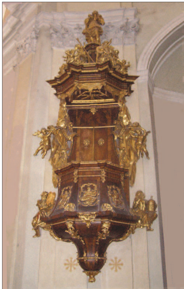
5. ábra. A pápai pálos templom szószéke

Az 1742-ben felépült pápai pálos (később bencés) Nagyboldogasszony-templom barna alapon gazdagon aranyozott szószékének kosarán a négy evangélista szobra, tetején a Jó Pásztor, puttókkal körülveve (5. ábra).