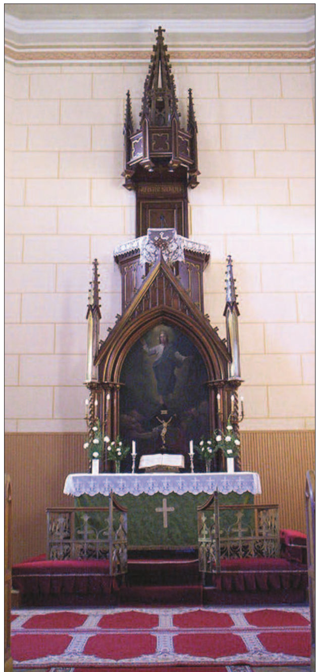
4. ábra. Neogótikus szószékoltár a pápai evangélikus templomban (1884)

A szószékek szobrai többnyire a négy evangélistát vagy a négy nyugati egyházatyát ábrázolják. Ezek attribútumaik alapján azonosíthatók: Szt. Máté = angyal, Szt. Márk = oroslán, Szt. Lukács = ökör, Szt. János = sas, Szt. Ágoston = püspöki öltözet, lángoló szív, könyv, Szt. Ambrus = méhkas, könyv, püspöki ornátus, Nagy Szt. Gergely = galamb, könyv, Szt. Jeromos = koponya, könyv, bíborosi kalap. A szószék koronáján Jézust mint a Jó Pásztor, vállán báránnyal, Mózes kőtábláit, a földgolyót tartó Jézust, az ördögöt legyőző Szt. Mihály arkangyalt vagy az isteni erények szimbólumait (hit = kereszt, remény = horgony, szeretet = lán-