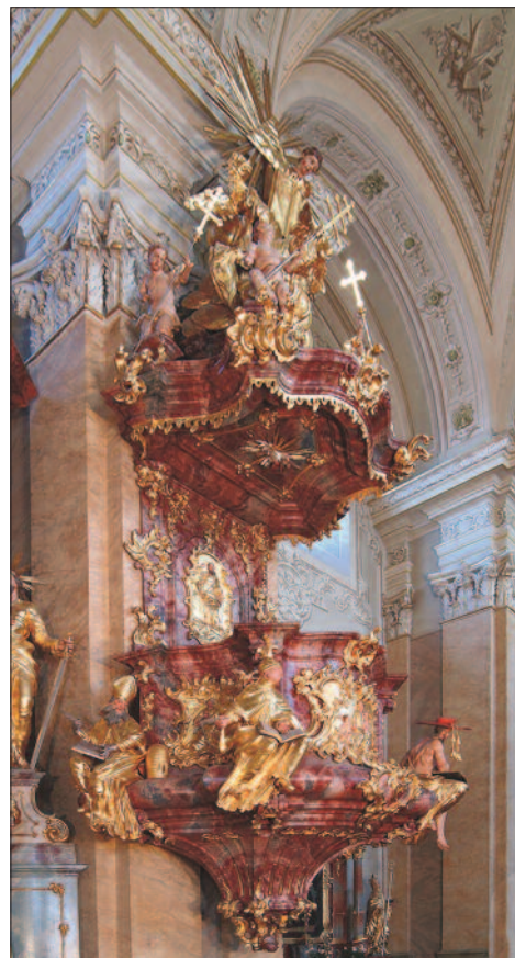
12. ábra. A tihanyi apátság szószéke