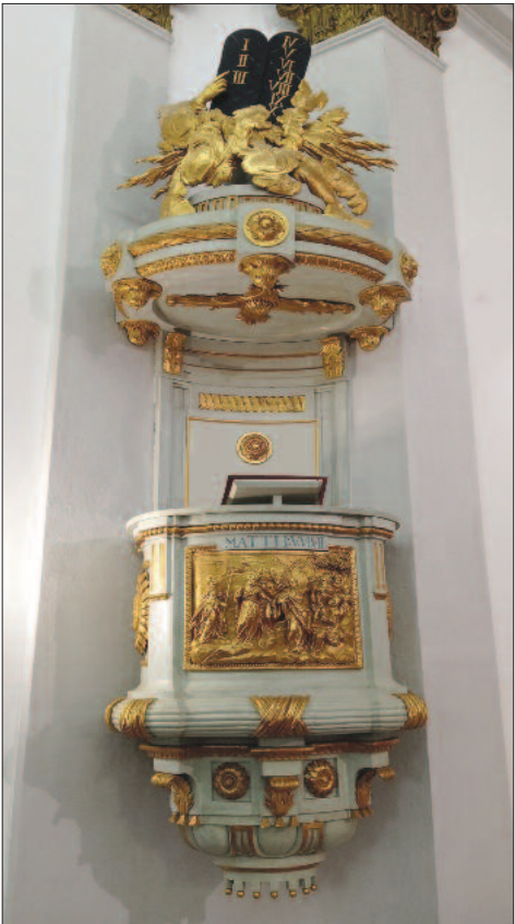
16. ábra. A majki szószék Oroszlányban