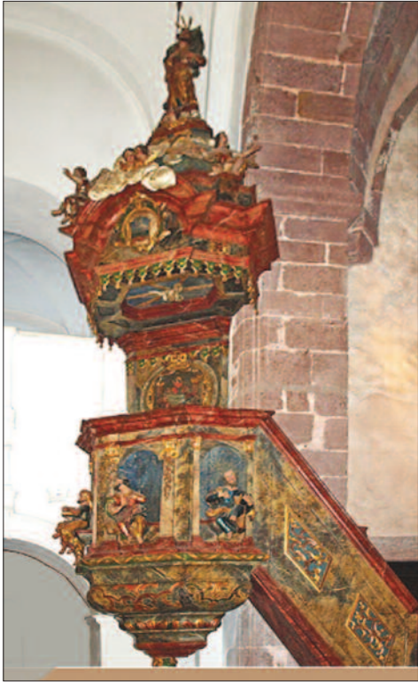
15. ábra. A felsőörsi szószék