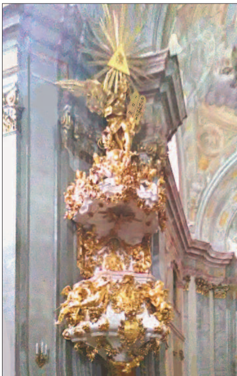
10. ábra. A székesfehérvári jezsuita templom szószéke