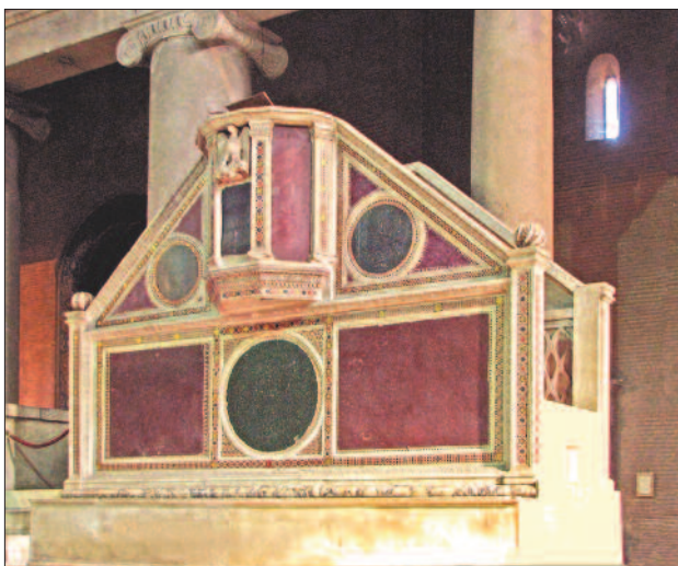
1. ábra. Ambó a római S. Lorenzo f. I. M. bazilikában

A barokk korban a templomépítészet arra törekedett, hogy a híveket egy térbe tömörítse, ahol mind egyikük látási és hallási kapcsolatban állhat az igehir-