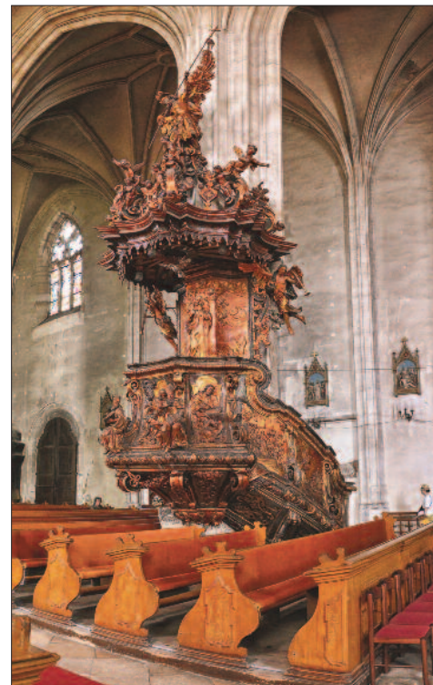
9. ábra. A kolozsvári Szt. Mihály templom szószéke