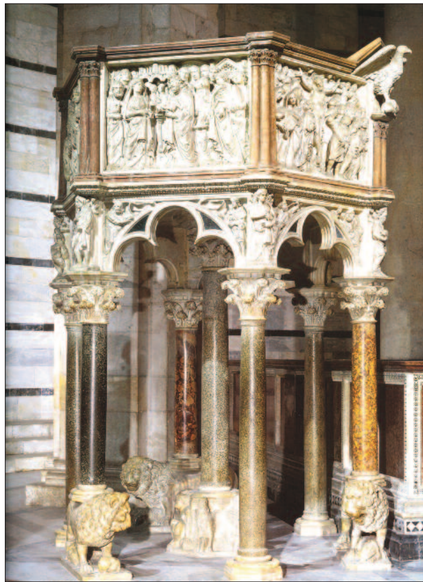
2. ábra. A sienai katedrális szószéke (Nicola Pisano, 1268)

detővel. A többnyire fából készült szószéket többhajós templomnál az utolsó pilléren, egyhajósnál a hajó oldal falán helyezték el. Ennek megfelelően lépcsője szabadon áll, illetve a sekrestyéből a fal belsejében vezet a pódiumra. A szószék padozatát a hengeres vagy sokszögű mellvéddel együtt a szakirodalom kosárnak nevezi (3. ábra). A mellvéd peremére könyvtartó állvány lehet erősítve. A padozat támaszon (az ún. cseppentőn ) nyugszik, amely a falhoz rögzített vagy oszlopon, pilléren áll, fordított kúp alakja a könnyedség látszatát kelti. A kosár felett elhelyezett, kerek vagy sokszögű, vízszintes lap, a hangvető , a hang felerősítésére szolgál. Ennek alján rendszerint a Szentlelket ábrázolták, galamb képében, sugárkoszorúban. Tetején a koronának nevezett figurális dísz vagy szoborcsoport teszi teljessé az alkotást. Egyes evangélikus templomok különlegessége a szószékoltár , amelyen a szószék az oltár felett, vele egybeépítve helyezkedik el (4. ábra). Ha-