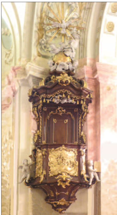
13. ábra. A kiscelli szószék Solymáron

Az 1784-ben épült, Szűz Máriáról nevezett solymári plébániatemplom szószéke (1762, 13. ábra) a II. József által betiltott sarus trinitárius rend kiscelli templomából való. Barna alapon aranyozás díszíti. A kiscelli főoltár az óbudai főplébániatemplomba került. Mindkettőnek Bebó Károly volt a készítője.