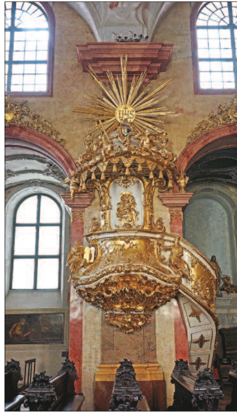
8. ábra. A győri jezsuita templom szószéke