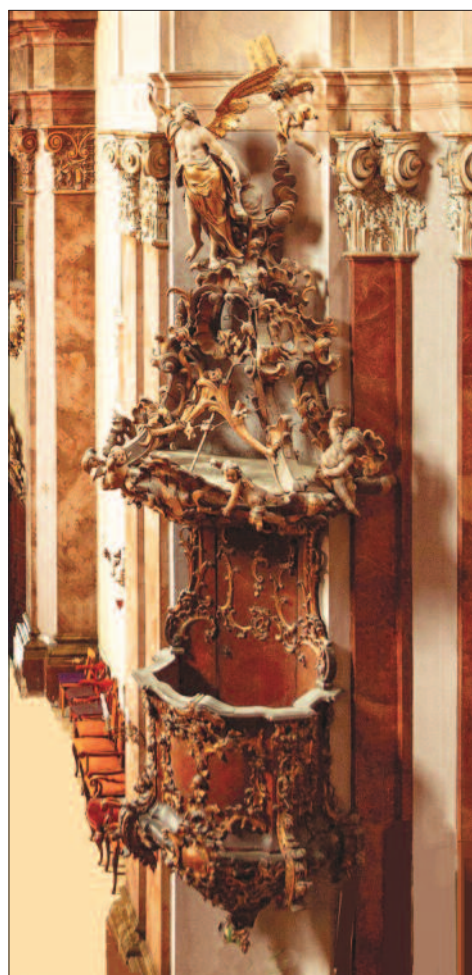
14. ábra. A székesfehérvári karmelita templom szószéke