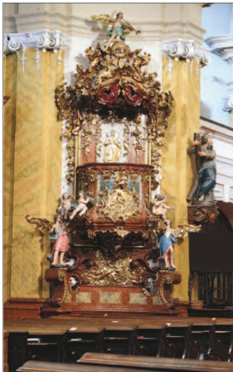
7. ábra. Az óbudai főplébániatemplom szószéke