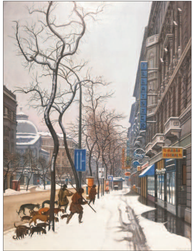
Mácsai István: Téli vadászat