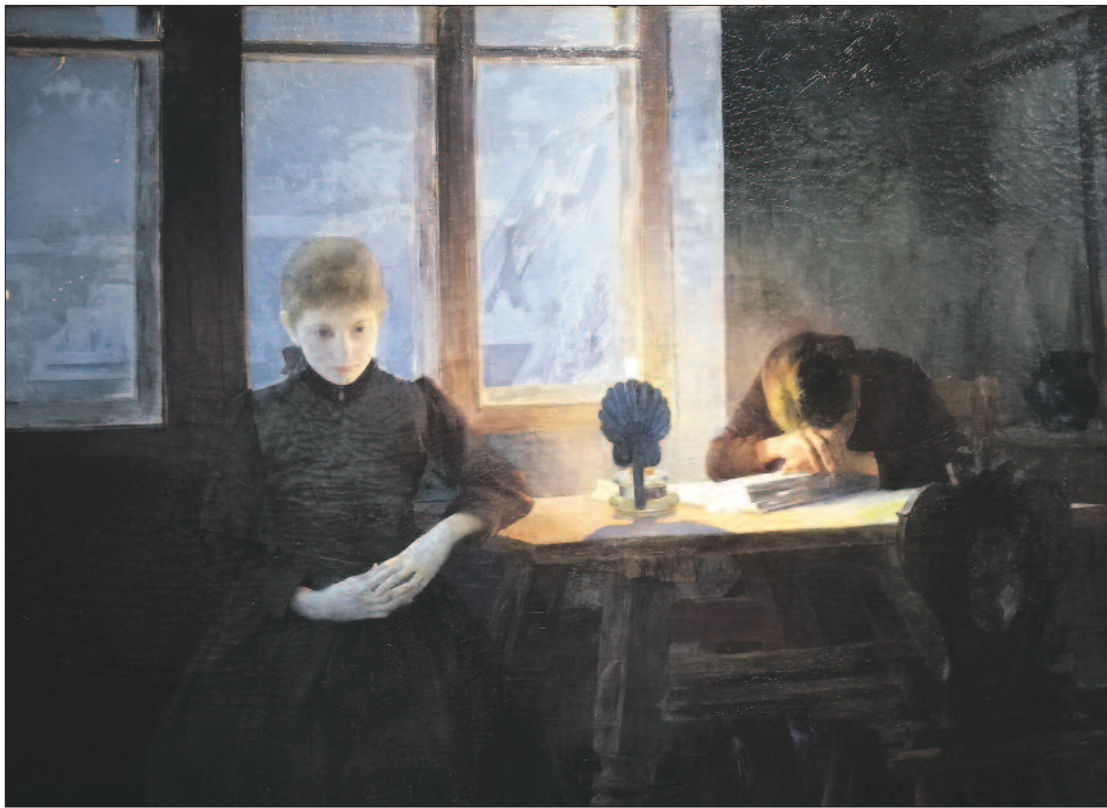
Csók István: Árvák