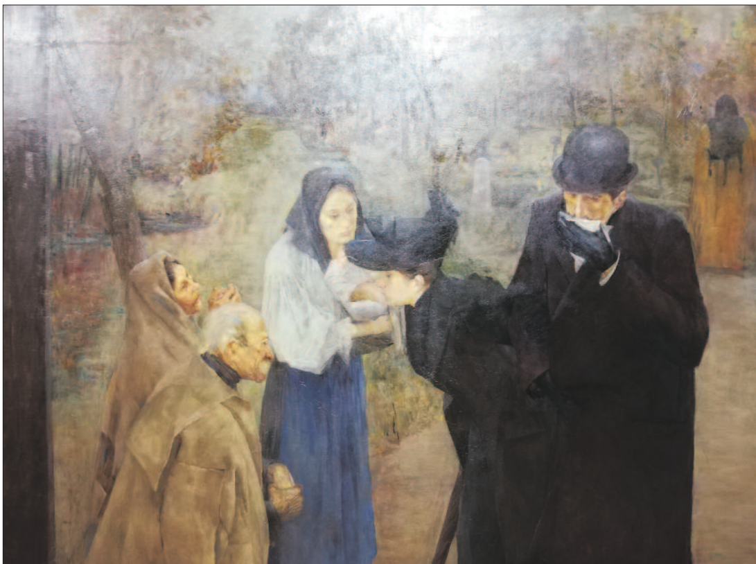
Thorma János: Szenvedők