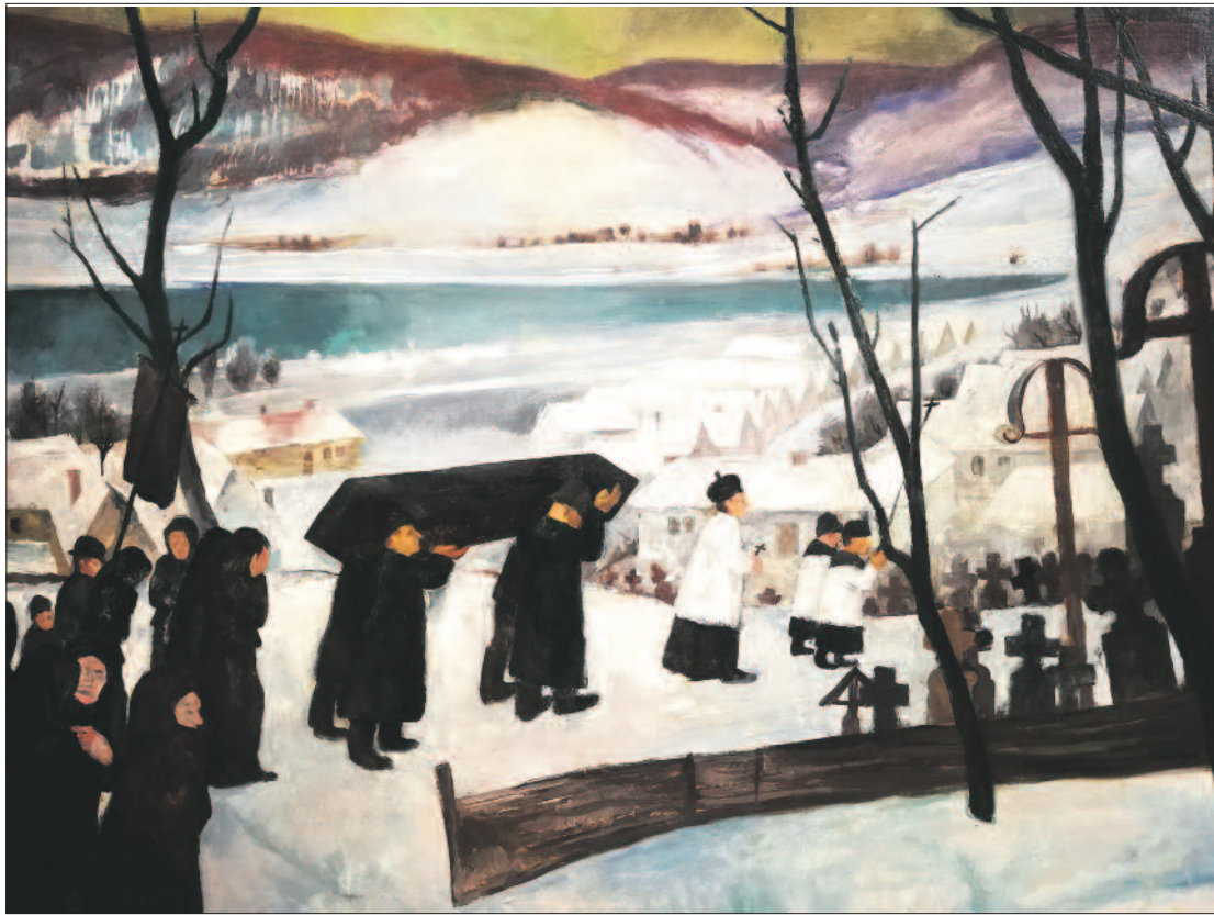
Szőnyi István: Zebegényi temetés

lukon visznek egy éjfekete koporsót, lassan haladnak a szertartást vezető pap után. Ezen a képen szinte fázunk a kékeszöldre fagyott Duna és a lilába hajló környező hegyek láttán. Elmondhatjuk, hogy a tél fogalmának szinte tökéletes vizuális kifejezése ez az alkotás.