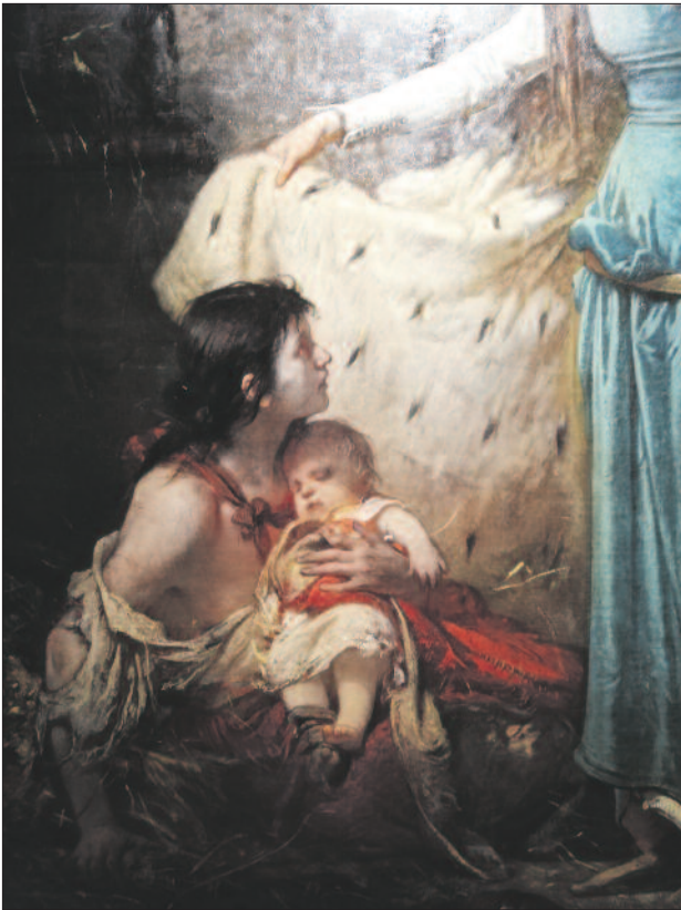
Liezen-Mayer Sándor: Magyarországi Szent Erzsébet