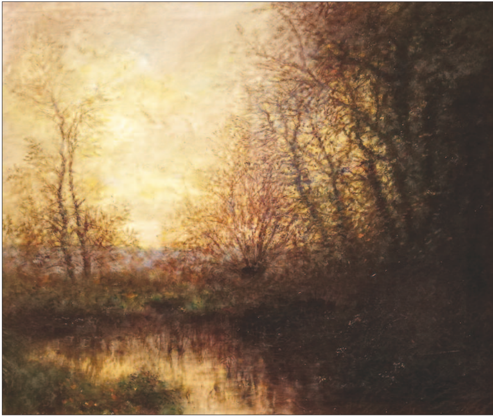
Mednyánszky László: Erdőben