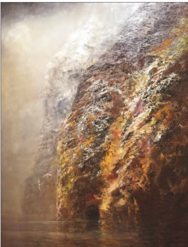
Mednyánszky László: A Dunajec partján