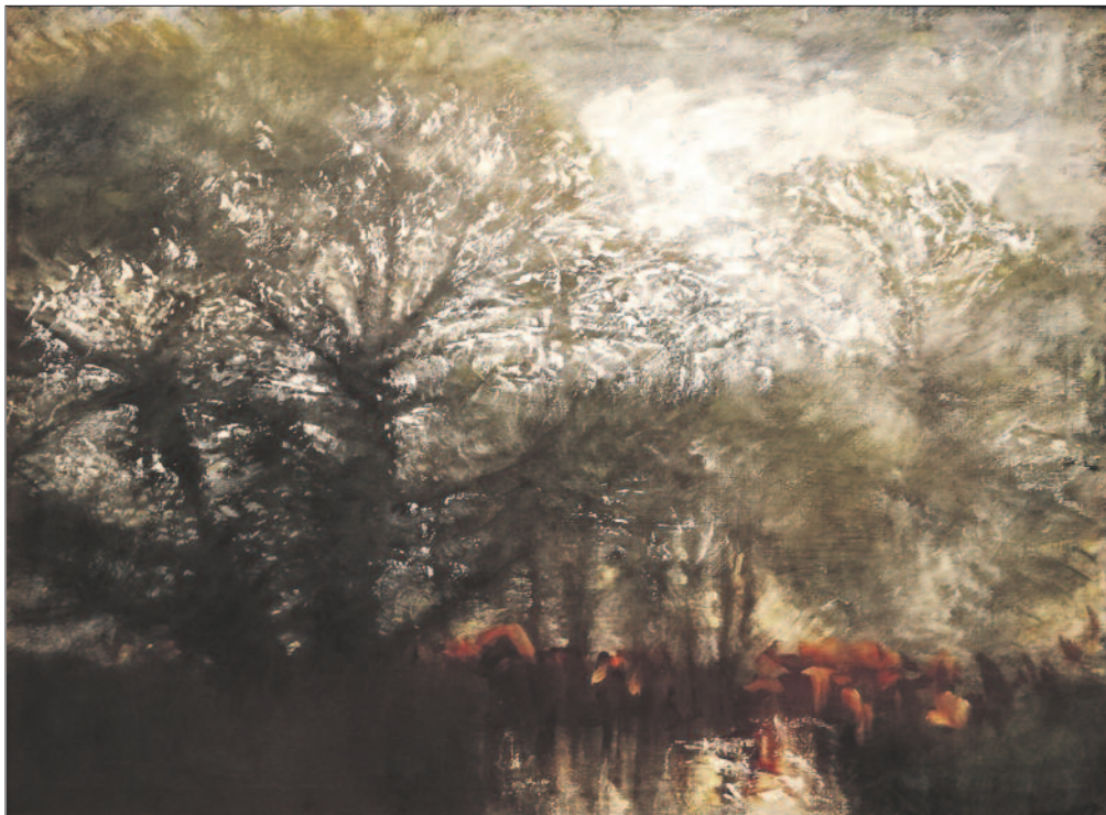
Mednyánszky László: Havas fák