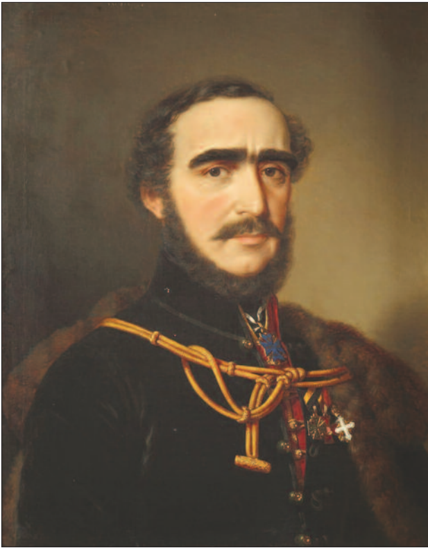
Gróf Széchenyi István