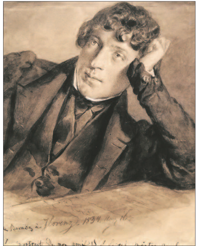
William Leighton Leitch skót festő arcképe

„Valamelyik nap látok egy bajusztalan urat lekuporodni a festőszékére, és kivenni nadrágja zsebéből egy kis festékes dobozt, és rövid idő alatt olyan szép, szélesen kezelt aquarellt festeni arról a szobáról, ahol mi dolgoztunk, hogy szinte meglepő volt. Bajusztalanságából gyanítottam, hogy ez az ember angol, igen rokonszenves kifejezése lévén, szóba álltam vele. (...) Ez az angol úr William Leitch volt, inkább tájfestő, mint figuralista” – olvashatjuk Barabás önéletrajzi könyvében. Ez az élmény adta számára az indítást akvarellfestészetének megújítása felé.