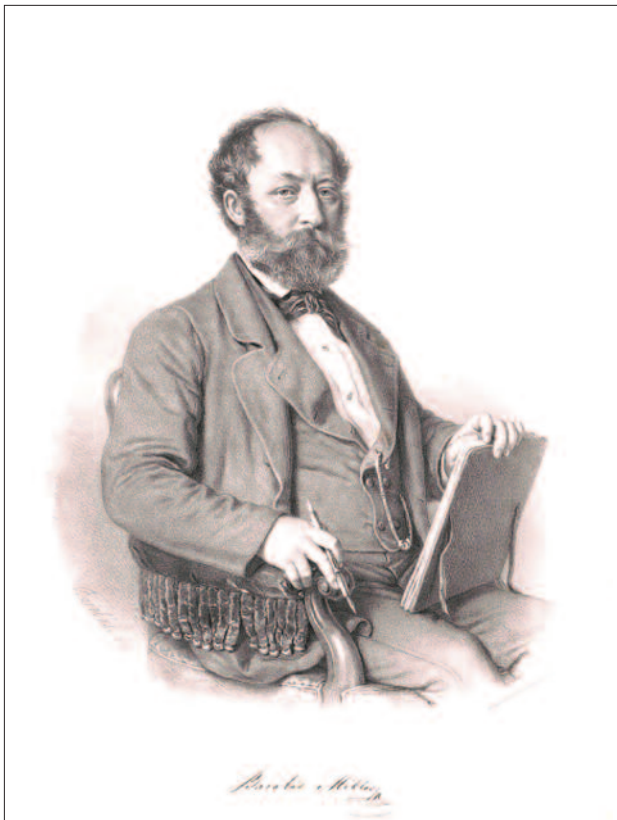
Barabás Miklós portré

óz sokoldalúsága ma már elképzelhetetlen lenne. Napjaink világa egészen más, még akkor is, ha az internet sokféle lehetőséget kínál. „A portrékon érezni lehet, hogy ezek az emberek jelentős személyiségek voltak. Ma is élnek közöttünk nagyon fontos és jó emberek, de a kortársainkról már nem lehetne ilyen erejű portrékat festeni. A 20. és a 21. század emberei mások, másképp nézünk az egyéniségre, az individuális értékekre, a nagy történelmi személyiségekre. Ma félünk a