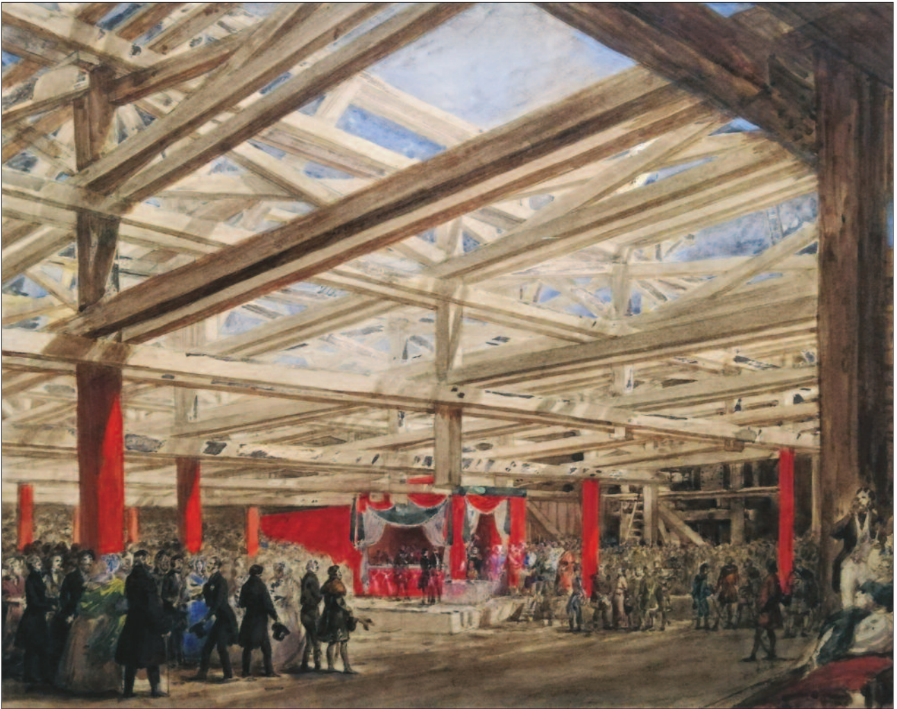
A Lánchíd alapkőletétele, 1842

közönség körében. A kiállításon szerepelt legtöbb műve azonban vízfestmény, láthatóan ezt a technikát kedvelte a leginkább, hiszen akkoriban az akvarell fénykorát élte a festők körében szerte Európában. Figyelemmel kísérte a Lánchíd építését is, rajzaival, képeivel tudósított a hatalmas munka minden fontos állomásáról. Az alapkőletételről egy különösen nagy méretű vásznon emlékezett meg. Barabás nemcsak Adam Clarkot, az építőmérnököt örökítette meg akvarellen és litográfián, hanem a tervezőmérnököt, Sir William Tierney Clarkot is. Akkoriban a fényképezés még nem volt olyan elterjedt, hogy bárki élhetett volna a látvány megörökítésének ezzel a lehetőségével. Ezért a portré műfaja még a 19. század második felében is virágzott. Amikor azonban Budapesten megnyíltak az első fotóatelier-k, Barabás Miklós is érdeklődni kezdett a fotográfia iránt, később azonban visszatért a festészethez. Hasonló utat járt be Borsos József is, a Lányok bál után című nagyszerű kép alkotója, aki a Múzeum körúton nyitott fotóműtermet az 1860-as években.