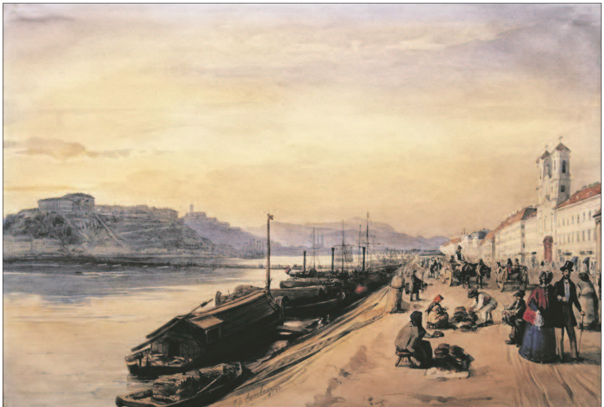
A pesti Aldunásor