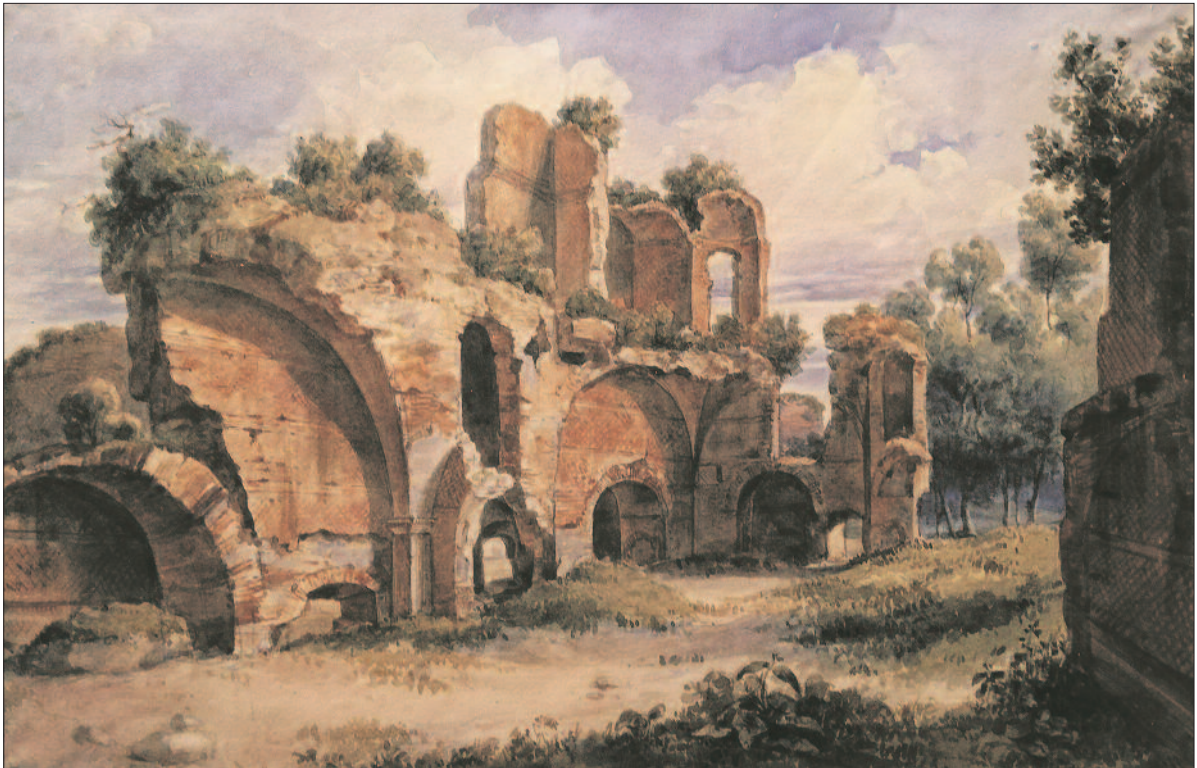
A görög könyvtár romjai