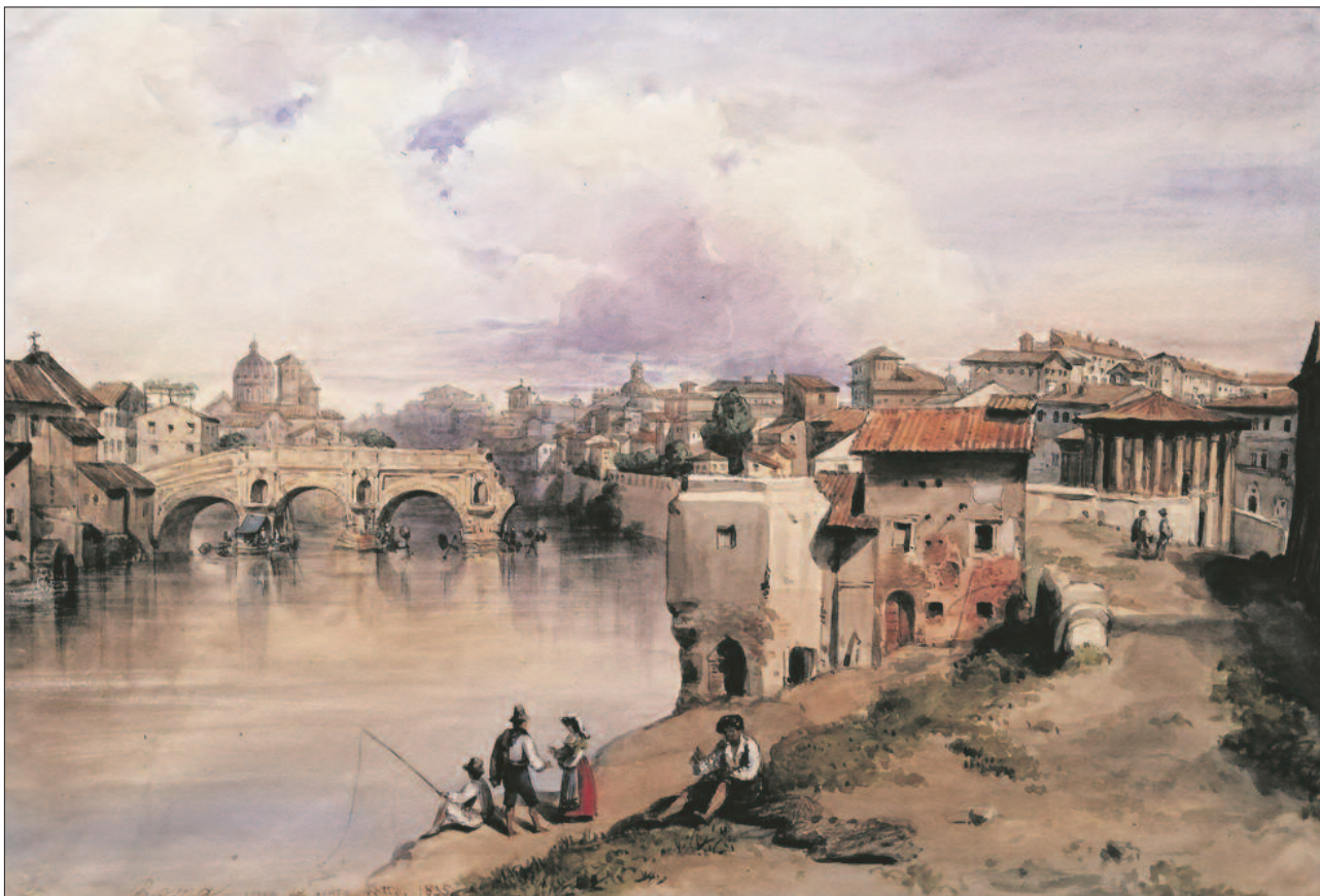
Róma a Ponte Rottónál

Barabás Miklós életútja, emberi kapcsolatai, virtu-