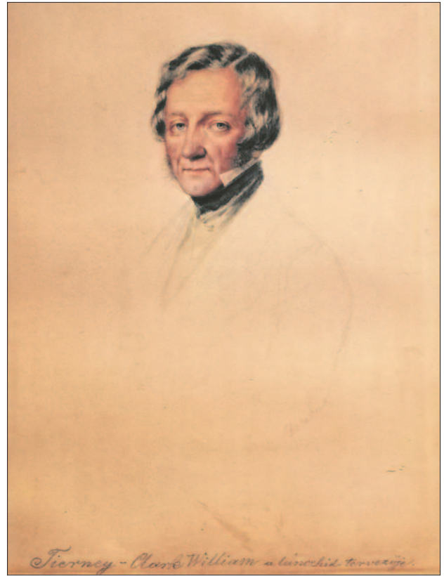
Sir William Tierney Clark portréja