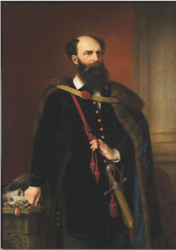
Gróf Batthyány Lajos