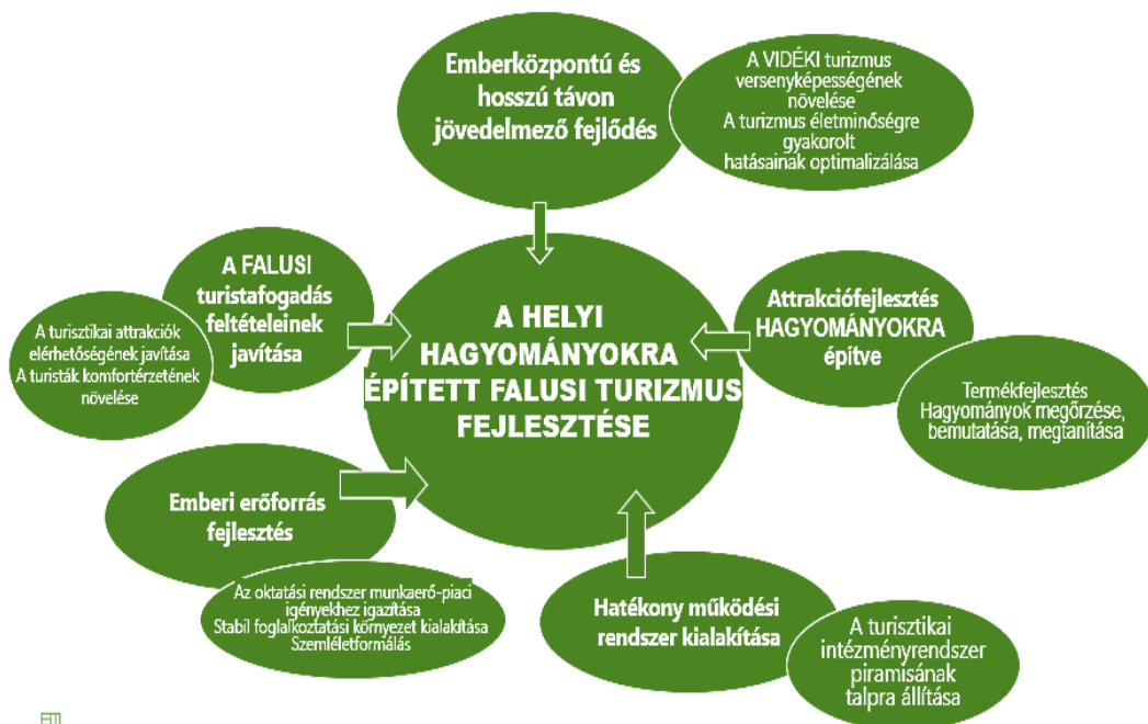
3. ábra. A falusi turizmus újra gondolt fejlesztési organogramja

világ a magyarázat, pedig, ha alaposabb vizsgálatot végzünk, nagyon sok esetben a források kedvezőtlen elosztása, és mindaz a korábban felsorolt sok tényező járult hozzá, amely a rövid távú gondolkodás, a kevésbé előre néző döntések eredménye. Büszkék voltunk, hogy a falu és a város különbsége eltűnt, pedig ez a szemlélet is közrejátszott abban, hogy a falusi hagyományok is a feledés homályába kerüljenek. Megszűnt a kalácska munka, megszűnt a közös értékteremtés öröme és megszűnt az összefogáson alapuló közösségi élet.