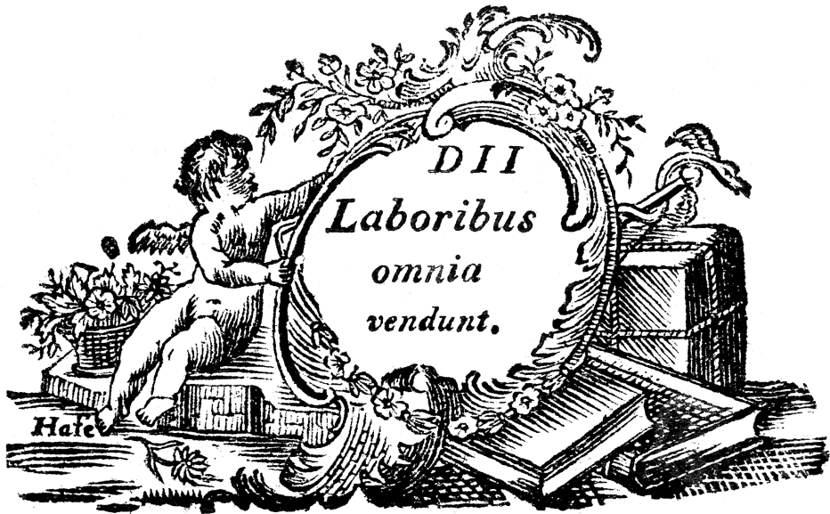
7. ábra. Landerer Mihály (Pozsony és Pest, 1804)