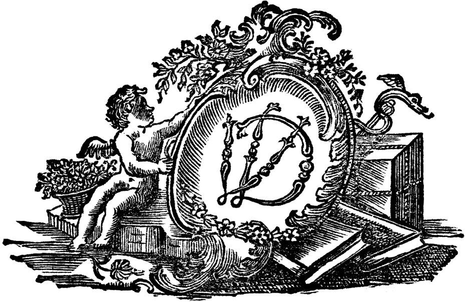
4. ábra. Vincent Dederich (Bamberg, 1780)