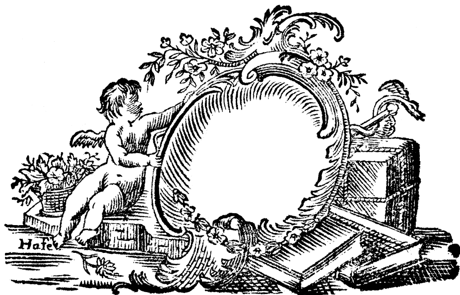
2. ábra. Van den Hoeck özvegye (Göttingen, 1776)