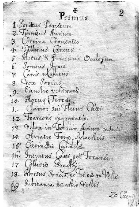
2. ábra. Az első tizenkilenc 'váratlan esemény'

A kézirat forrása Heinrich Khunrath 7 könyve Zebelis arab király és bölcs jóslatairól, mely 1592-ben jelent meg Prágában. 8 Khunrath egy berlini kódex nyomán készítette könyvét, 9 mely eredetileg Joachim I. Nestor (1484–1535) brandenbur-