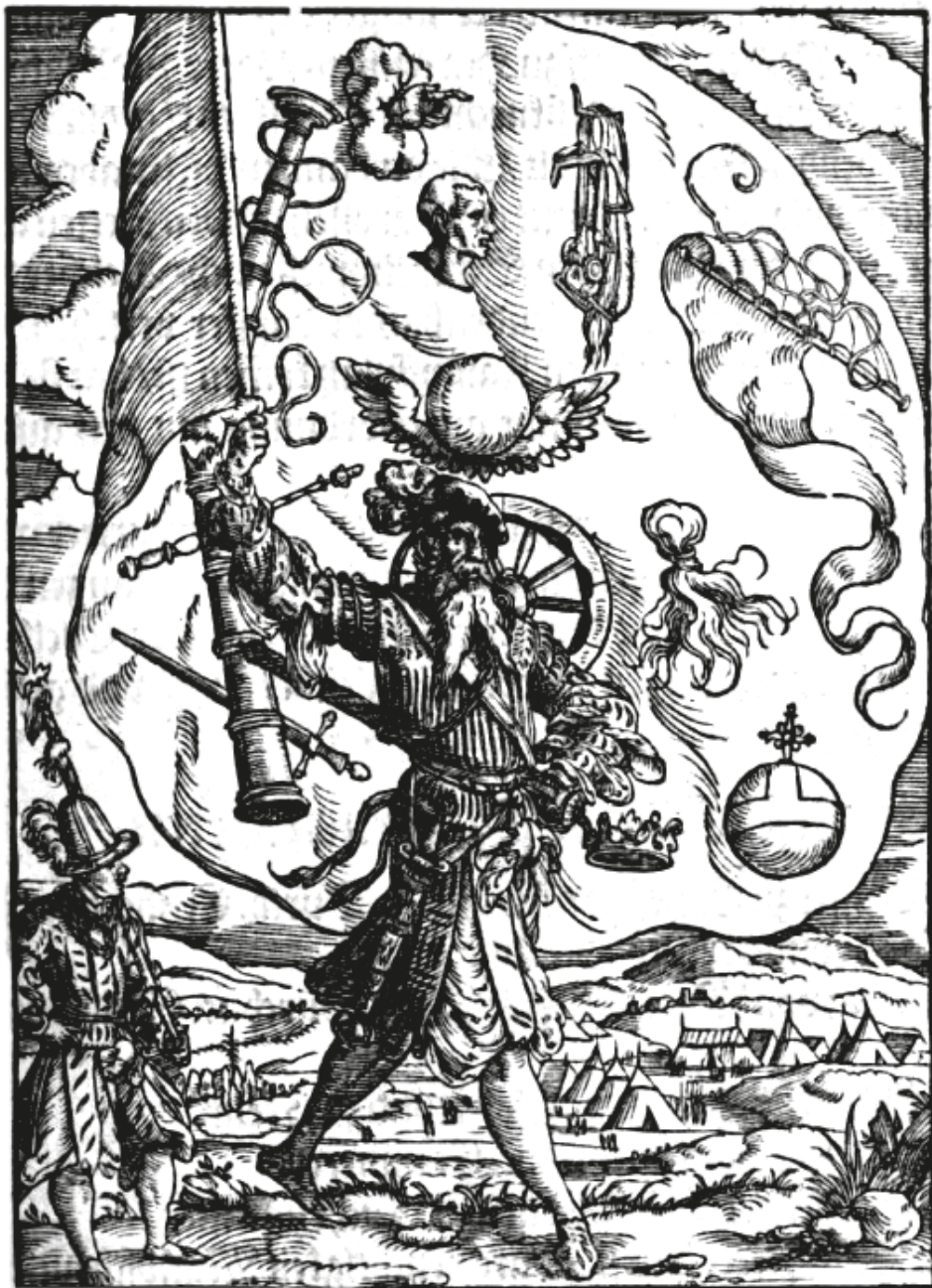
6. ábra. Könyvillusztráció, [FRANCOLIN, Hans von], Thurnier Buch, Warhafftige Beschreibunge aller kurzweil und Ritterspil..., Frankfurt, Feyerabend, 1566, IXr