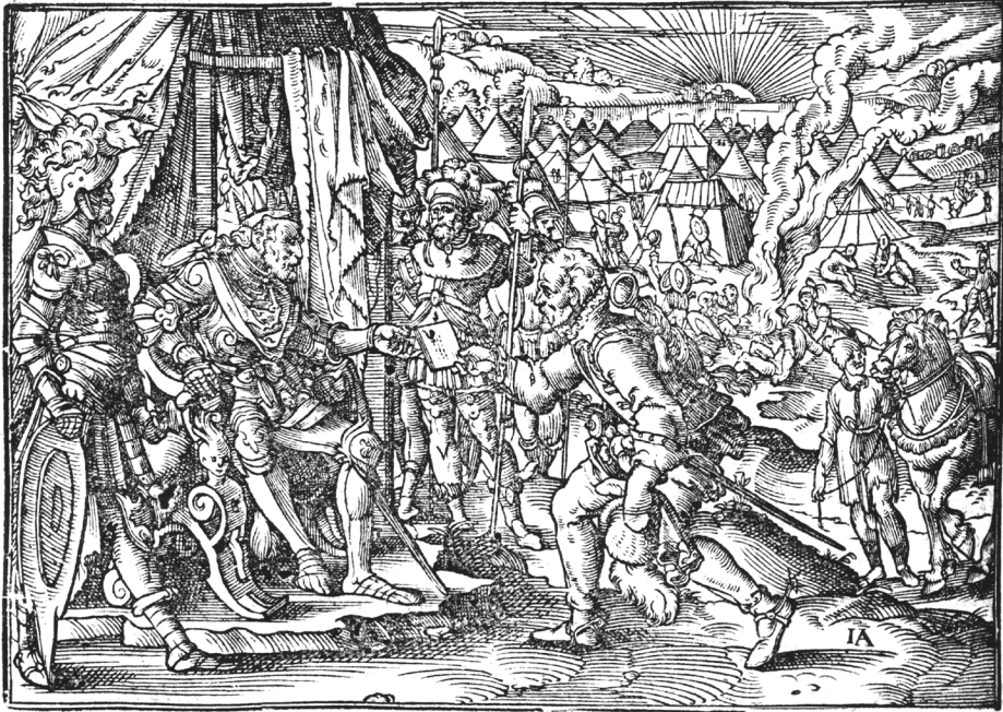
22. ábra. Könyvillusztráció, [BONFINI, Antonio], Ungerische Chronica... , Frankfurt, Feyerabend, 1581, 240r

Magdolna nevű leányának (1443–1495) személyében, vita alakult ki azonban az esküvő helyét illetően. A Habsburg származású fiatal király egy ideig habozott a szóba jöhető helyszínek, Bécs, Buda és Prága között, végül azonban a cseh kormányzó (a későbbi király), Podjebrád György (1420–1471) erőszakos fellépése hatására „bejelentették, hogy a menyegzőt Prágában fogják megtartani”. 112 A király kíséretével maga is Prágába érkezett, ahol külön bizottságot neveztek ki a menyegzői ünnepség megszervezésére, illetve egy roppant előkelő és nagyszámú – 170 lovagból, valamint 40 szűzből és matrónából álló – küldöttséget állítottak össze a menyasszony elhozatalára. Bár a „királyi esküvőt mértéktelen költséggel előkészítették”, s számos környékbeli fejedelem jelezte részvételét az eseményen, a király „a nagy várakozás és készülődés kellős közepén” 113 váratlanul meghalt. A fametszettel Feyerabend több korábbi kiadványában is találkozunk: az 1566-os Thurnierbuch ban és későbbi kiadásaiban (1578, 1579) többször szerepelt a lovagi tornák után rendezett bálók, táncmulatságok (Der erst Thurnier / Wie man den Abendtantz anfieng / und die Danck außgab) illusztrációjaként. 114