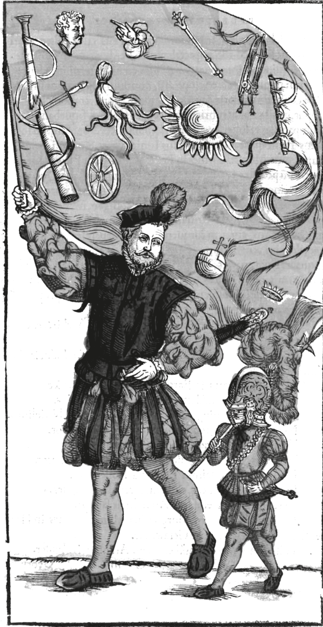
5. ábra. Könyvillusztáció, FRANCOLIN, Hans von, Rervm praeclare gestarvm, intra, et extra moenia mvnitissimae ciuitatis Viennensis... explicatio, Viennae, Raphael Hofhalter [1561?], Xlv