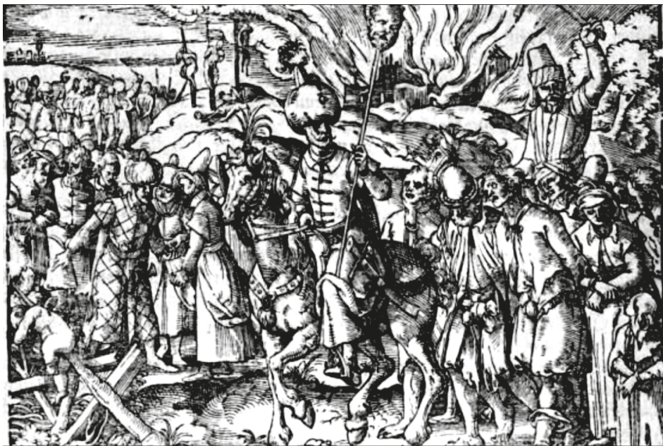
18. ábra. Könyvillusztráció, [BONFINI, Antonio], Ungerische Chronica..., Frankfurt, Feyerabend, 1581, 48v

Az 1581-es Bonfini-kiadás illusztrációinak a Feyerabend-kiadványok metszeivel való rokonságát a Történelem – kép kiállítás katalógustételének szerzője is megemlíti: „Valamennyi fejezetet egy tömör tartalmi összefoglalás vezet be, s az 1545-ös berni kiadáshoz... hasonlóan ebben a kötetben is a fejezetek élén különböző művészekről származó, a témához igazodó fametszetek találhatók. Közülük némelyik a magyar viselettörténet szempontjából különösen becses, mások pedig a Feyerabend-nyomda és -kiadó más metszetes kiadványainak illusztrációira emlékeztetnek. Számos metszeten Jost Amman szignatúrája látható.” 90