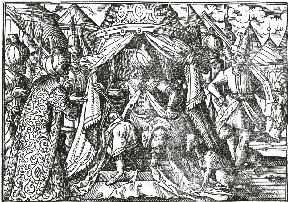
7. ábra. Könyvillusztráció, HERBERSTEIN, Siegmund, Die Moscouitische Chronica, Das ist Ein gründtliche beschreibung oder Historia / deß mechtigen vnd gewaltigen Großfürsten in der Moscauw..., Frankfurt, Feyerabend, 1576, 123v

képei már antikizálók voltak, azaz sokkal „korhűbbek”, „hitelesebbek”, mint az 1505-ös kiadáséi. Az ilyenfajta hitelességre törekvéssel egyébként az európai könyvkiadásban már korábban is találkozunk: a fiatal korban fogolyként Drinápolyba került Georgius de Hungaria (1422 k.–1502), azaz Magyarországi György törökországi élményeit bemutató, Sebastian Franck által latinból németre fordított, 1530-as kiadványban például már hitelesnek tűnő törökábrázolások szerepelnek. 38