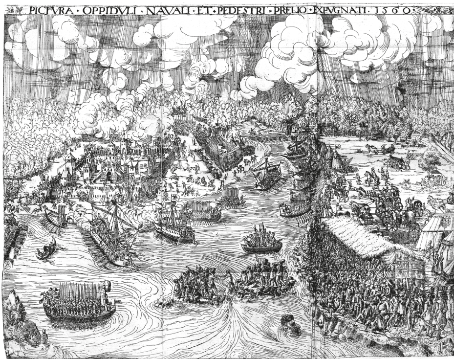
3. ábra. Könyvillusztáció, Thurnier Buech Warhafftiger Ritterlicher Thate[n]... / durch Hanssen von FRANCOLIN Burgunder... beschriben, Wien, Raphael Hofhalter, [1561?], LXXVIv utáni kép

készített rézkarcok 24 az udvari ünnepeket (bál, ünnepi vacsora), illetve a gyalogos, lovas és vízi (3. ábra) tornajátékokat mutatták be.