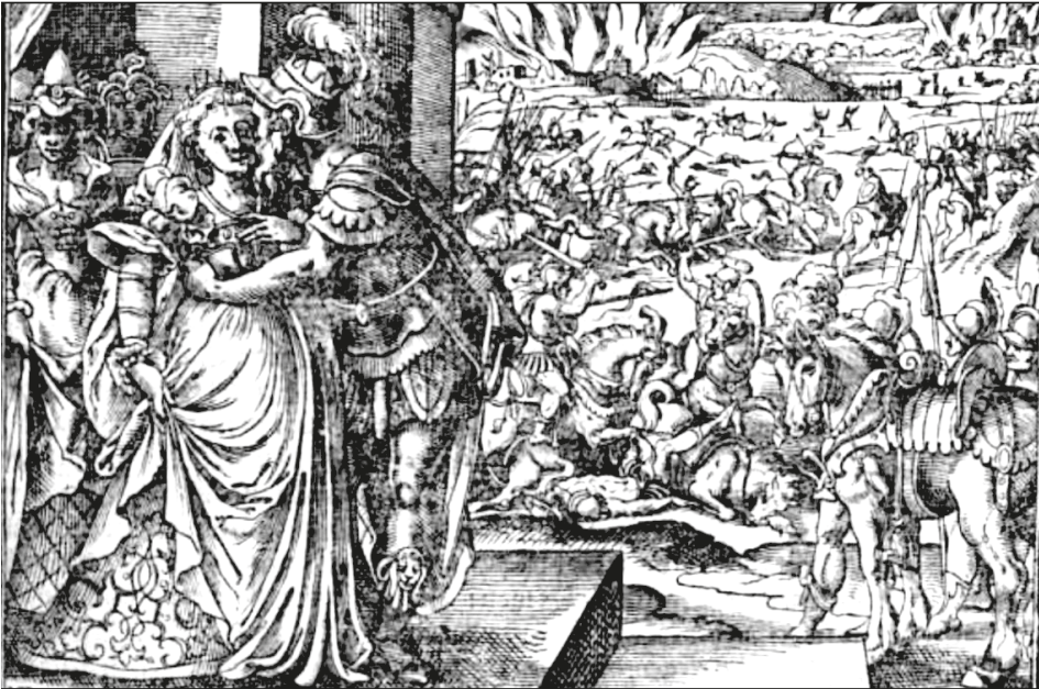
19. ábra. Könyvillusztráció, [BONFINI, Antonio], Ungerische Chronica..., Frankfurt, Feyerabend, 1581 150r

A II. András (1176 k.–1235) uralkodását ismertető rész előtti antikizáló fametszeten (150r) egy díszes épület lépcsőjén álló nőt látunk, akit egy előkelő öltözött férfi ölel át. (19. ábra) Bizonyára nem véletlen, hogy ebben a könyvben találjuk Bánk bán feleségének Gertrud királyné öccse általi elcsábítása történetét, 102 hiszen a férfi erőteljes mozdulata a szemlélő számára az erőszakos közeledést is érzékeltethette. A kép ugyanakkor eredeti kontextusában épp ennek ellenkezőjét ábrázolta, mivel a római polgárjogot kapott görög történetíró, Plutarchos (46/48–125/127) munkájának illusztrációjaként a Gracchusok anyja, az erényes római nő tökéletes megtestesítője, Cornelia Scipionis Africana (Kr. e. 190 k. – Kr. e. 100 k.) boldog házasságát szemléltette. 103