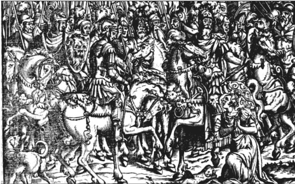
23. ábra. Könyvillusztráció, [BONFINI, Antonio], Ungerische Chronica... , Frankfurt, Feyerabend, 1581, 298r

Az eredetileg Titus Livius ókori történetéhez készült antikizáló fametszettel, 115 melyen egy folyó- vagy tengerparti városhoz érkező, díszes ruhájú lovasokból és gyalogosokból álló menetet látunk, a Mátyást királlyá választó rákosmezei országgyűlés leírásában (268r) találkozunk: „Mivel pedig a diétát a Rákos mezőn, Pest külvárosánál szokás tartani, a királyválasztó országgyűlésre elsőként [Szi-lági] Mihály érkezett meg számos csapatral, előkelők és nemesek pazar seregével.” 116 Ugyanígy tartalmi egyezést találunk a szövegkörnyezetével annak az illusztrációnak az esetében is, amelyiken egy népes társaságtól körülvelt, trónon ülő királyt látunk (290v). A kép alatt olvashatjuk Mátyás királynak az országgyűlésen, trónján ülve elmondott beszédét, melyben a csehekkel folytatandó háború szükségességét indokolta. „A király lenyűgöző szónoklata után kivétel nélkül mindenki az ő véleményére állt.” 117 Az antikizáló kép eredetileg az 1568-as Titus Livius-kötetben tűnt fel Romulus macht Ordnungen cím alatt. 118