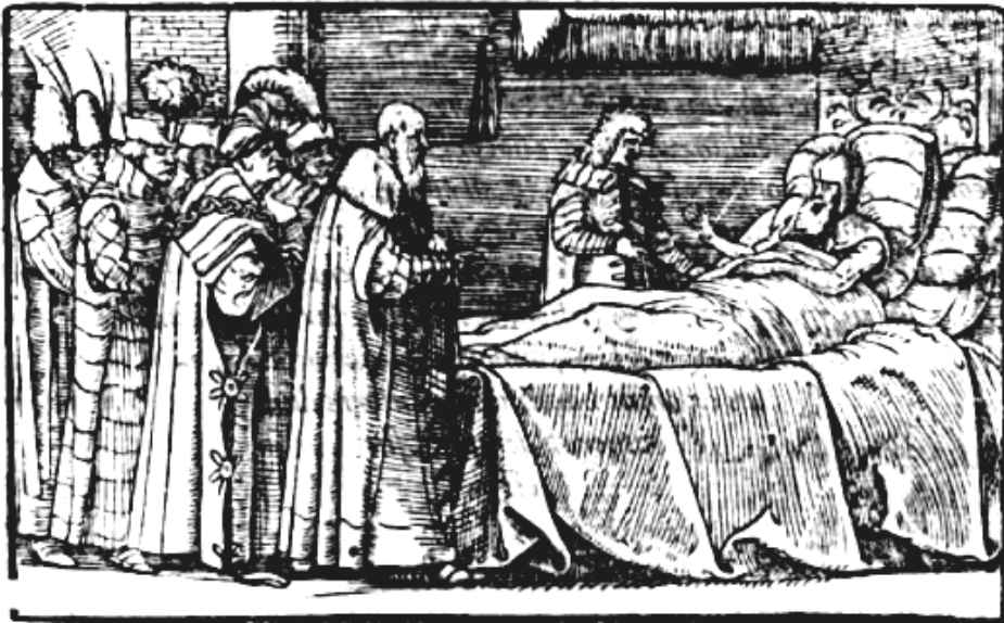
16. ábra. Könyvillusztráció, [BARLETIUS, Marinus], Scanderbeg..., Frankfurt, Feyerabend, 1577, 155r