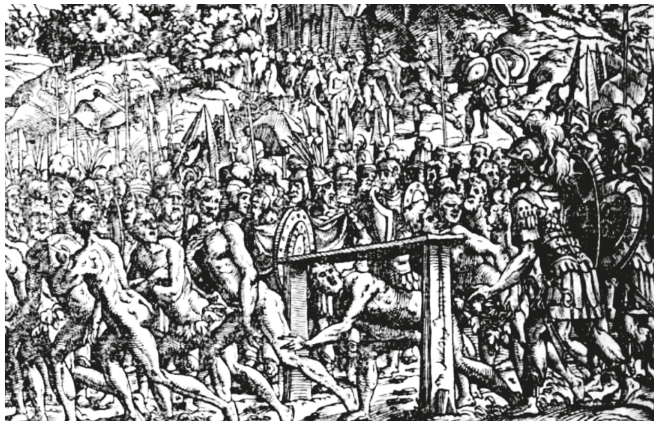
24. ábra. Könyvillusztráció, [BONFINI, Antonio], Ungerische Chronica..., Frankfurt, Feyerabend, 1581, 367v

hetjük meg a törökök óriási méretű hadi készülődéséről: 133 a török hódítások kegyetlenségére emlékeztethette az olvasókat.