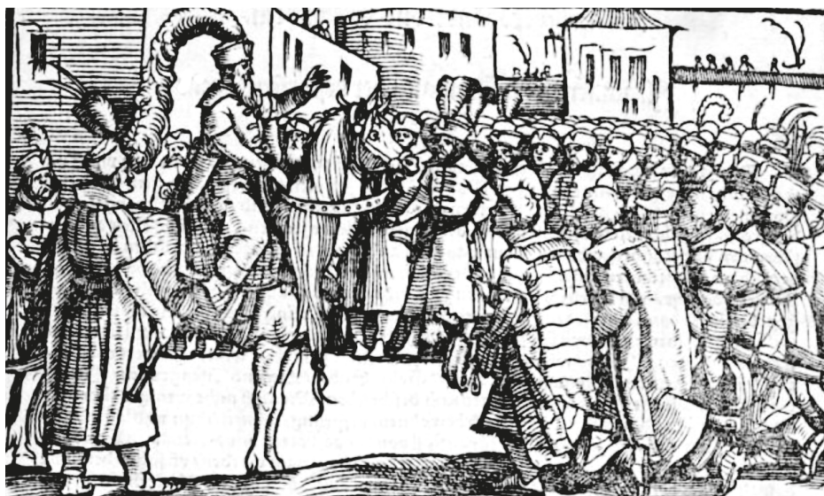
13. ábra. Könyvillusztráció, [BONFINI, Antonio], Ungerische Chronica... , Frankfurt, Feyerabend, 1581, címlapkép

„a szöveg tartalmához kapcsolódnak, és az ábrázolt személyek korhű viselete miatt az illusztrált kötet különösen jelentős történeti forrásnak számít”. 70 Valóban, az illusztrációkon a jóval régebbi korokban élt embereket is 16. századi öltözékben látjuk, gyakran a korábban említett, tipikusan magyar viseletben, övvel összefogott köntösben és strucc- vagy darutollas süvegben. Ezt figyelhetjük meg például a kötet első, az őshaza leírásához mellékelt illusztrációján (Ir) vagy az Attila és Buda harcát bemutató fametszeten (XXXVv). 71 (12. ábra) Zsámboky János 1558-ban Bécsben megjelentette Pietro Ranzano (1428–1492) Epithoma rerum Hungaricarum át, 1568-ban pedig Bázelen Bonfini magyar krónikájának teljes szövegét adta ki latin nyelven, mindkettőt illusztrációk nélkül. 72