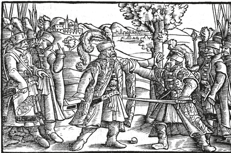
12. ábra. Könyvillusztráció, [BONFINI, Antonio], Des Aller Mechtigsten künigreichs inn Vngern... , Basel, Ruprecht Winther, 1545. XXXVv