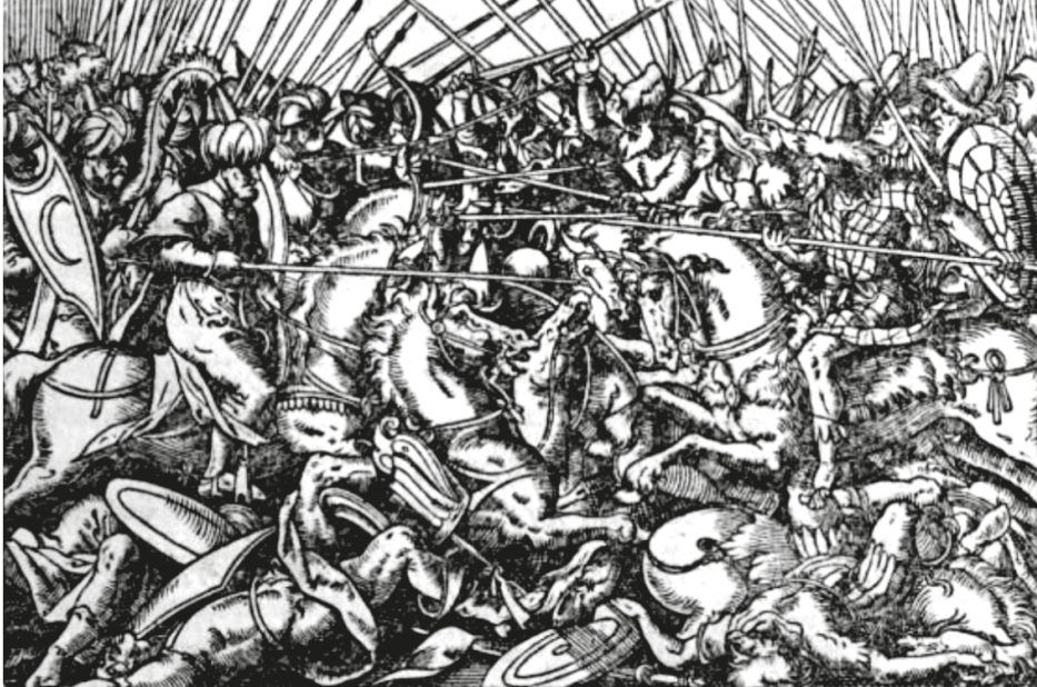
14. ábra. Könyvillusztráció, FRONSPERGER, Leonhard, Kriegßbuch... III , Frankfurt, Feyerabend, 1573, CXXXVv

vű kiadásában is. 73 A kiadó a címlapképen (13. ábra) és a Zrínyi Györgynek szóló ajánlás lovas vitézt ábrázoló fametszetén kívül mind a 45 könyv elejére elhelyezett egy-egy illusztrációt, némelyiket többször is közreadva. A képek többsége azonban nem ehhez a kötethez készült, hiszen már a Feyerabend által korábban kiadott