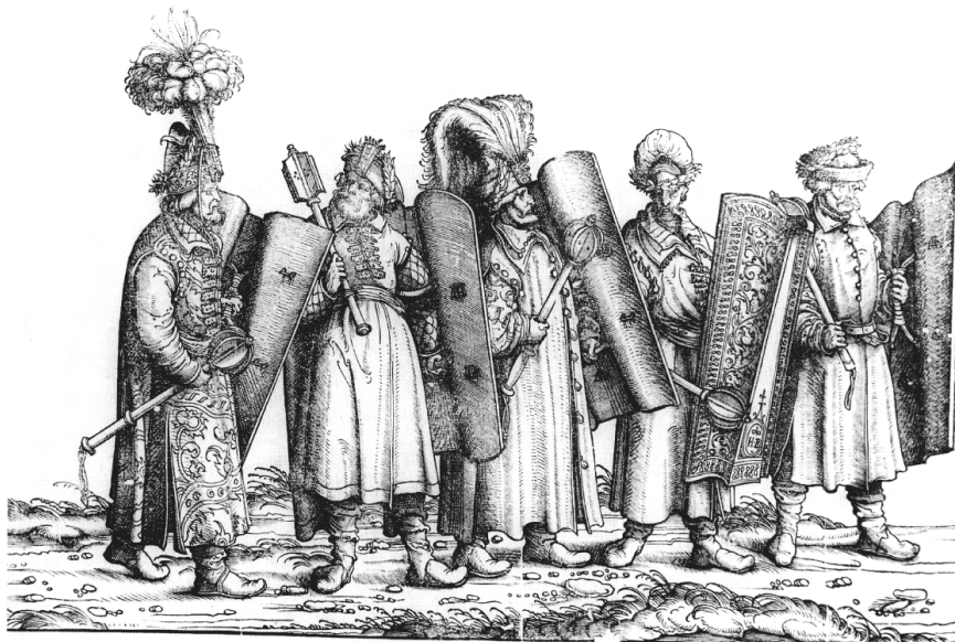
10. ábra. Hans BURGMAIR, Fegyveresek I. Miksa Diadalmenetén, 1516–1518 (ENDRÓDI 2000, i. m. 201.)