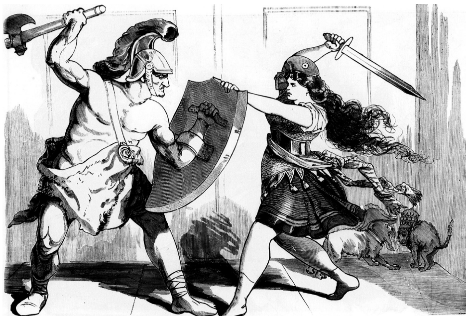
1. ábra. Kis háború és nagy háború

politikus esetében nem látszik a rajzon üldözője, mégis Napóleon lábtartása, lengedező frakkja könnyen előhívja az asszociációt a Metternich-karikatúrára. 20