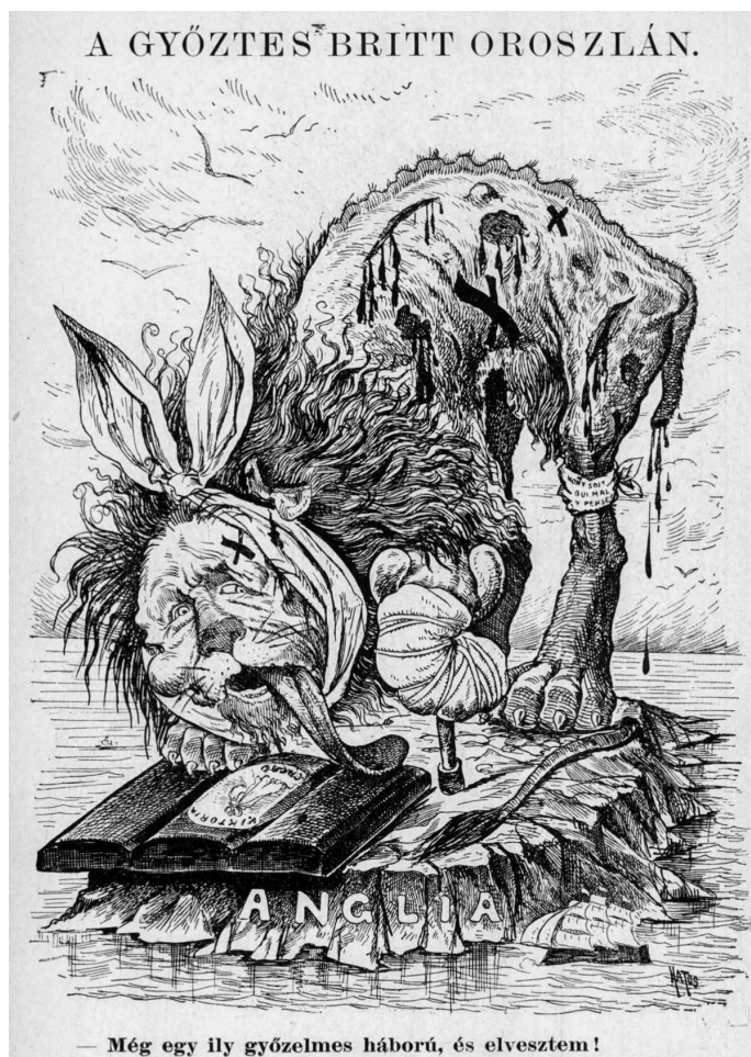
3. ábra. A győztes brit oroszlán

pártatlanul. Brit szereplőhöz köthető egy másik bibliai szimbólum is a harcok ábrázolásakor, amikor Kitchener Káinként egy Bibliával készül lesújtani az ugyancsak a Bibliát olvasó és imádkozó Ábelre. Ez a háború egyenlővé vált az első gyilkossággal, ami súlyos bélyeggel pecsételi meg Kitchenert – üzeni a Bolond Istók . A „Szabadság” feliratú szobron Isten tűnik fel, kezével intó, figyelmeztető mozdulatot téve: a háborús kegyetlenségek nem férnek össze a keresztény eszmékkel. 36