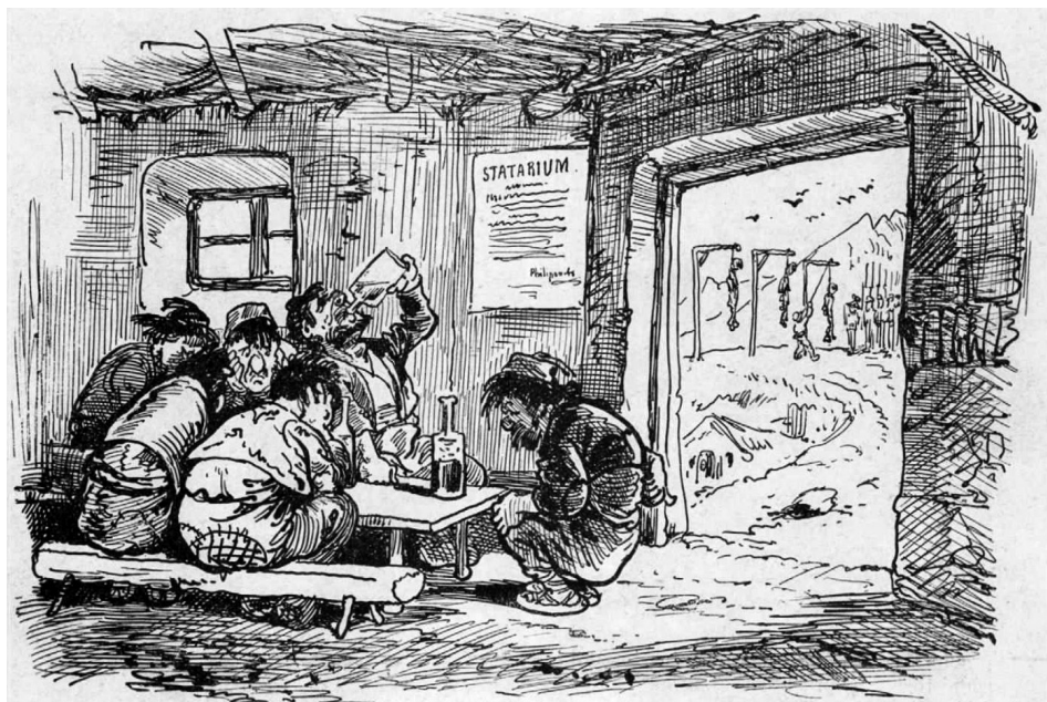
2. ábra. Az okkupáció kultúrája