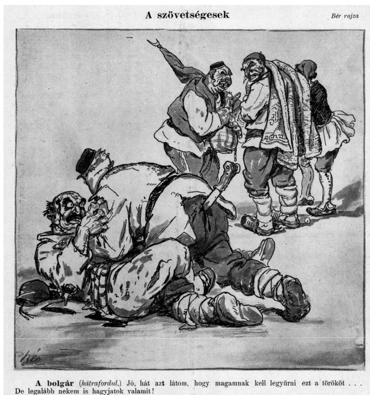
4. ábra. A szövetségesek

A küzdelmeket e háború esetében is vizualizálták állatok segítségével. A balkáni országok hol a törököt, hol pedig egymást marcangolva jelennek meg kutya vagy farkas képében: a megvadult, nyáladzó állatok egymásnak vagy ellenfelüknek esnek. 48 Kevesebb alkalommal, de a marakodást más állatokat felsorakoztató jelennetekkel ugyancsak kifejezték: a baromfiudvarban kakasok – a balkáni országok – viaskodnak, varjak (ugyancsak a balkáni államok) elevenen akarják felfalni a törököt, vagy kosként akasztja össze a szarvát a görög, a bolgár és a szerb. 49 Legnagyobb számban azonban – a búr háborúkhöz hasonlóan – nem olyan karikatúrákat találunk, ahol az állatok küzdelme testesíti meg a harcokat, hanem olyanokat, amelyeken a balkáni államok a törököt vagy egymást szúrják le törökkel, kardokkal, vagy egymást agyonverik pusztá kézzel, esetleg bottal (4. ábra). 50 Eze-