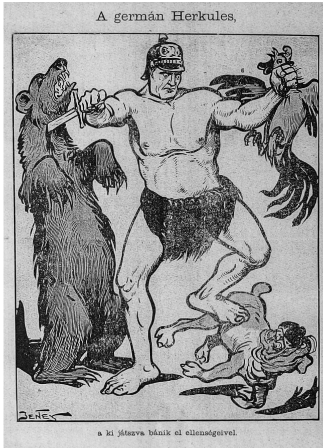
5. ábra. A germán Herkules

4. Sport: birkózás és bokszt – test-test elleni küzdelem. A német és a francia birkózók összecsapását nézik szövetségeseik, egyik oldalon az olasz, az orosz és John Bull, míg a másikon a török, az osztrák és a magyar. A rajz publikálásakor a verduni csata körülbelül két hónapja tartott, de a kép alá írt versike szerint semmi kétség afelől, hogy melyik sportoló fog nyerni. 76 A központi hatalmak egy másik tagja is sikeres a küzdősportban: az „Angol–török bokszt-mérkőzés”-en a török kíméletlenül üti ki a brit fogait. 77