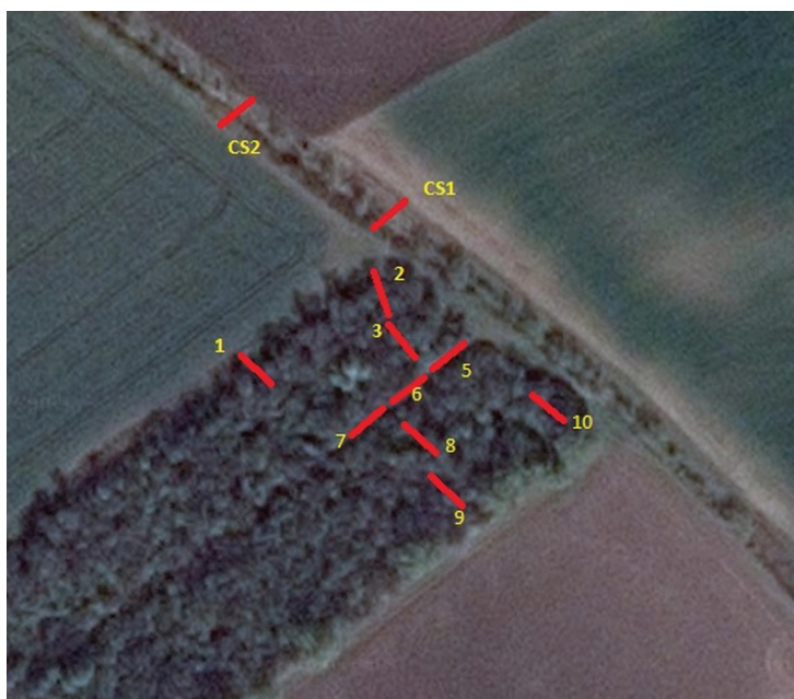
1. ábra. A hálók elhelyezkedése a kutatási területen (http1).

Kutatásunkat Békés megye délkeleti részén, Kevermes település közigazgatási határán belül az egykori fácántelep területén végeztük (EOV 815638 123876), amely egy 7 hektár kiterjedésű ezüsthát (Elaeagnus angustifolia). A kutatóhely ennek az erdőnek az északi részén került kialakításra egy kb. 0,5 hektáros foltban (1. ábra). Alapvetően bokros élőhelyről van szó függetlenül attól, hogy több magas fa is fellelhető a területen. Az erdő átlagos magassága 3,5–4 méter, a domináns ezüsthát mellett néhány ennél magasabb szil ( Ulmus sp. ), akác ( Robinia pseudoacacia ) és vadkörte ( Pyrus pyraster ) is megtalálható itt elegyben. A cserjeszintet fekete bodza ( Sambucus nigra ) és kökény ( Prunus spinosa ) alkotja, míg az alsóbb szinteken gyakori a hamvas szeder ( Rubus caesius ). Az erdőszélen sűrűbb