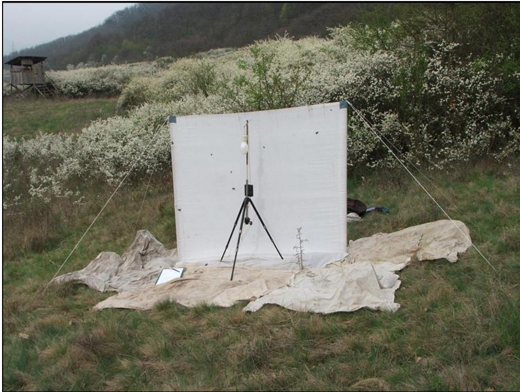
1. kép. A generátoros éjszakai lámpázás eszközei