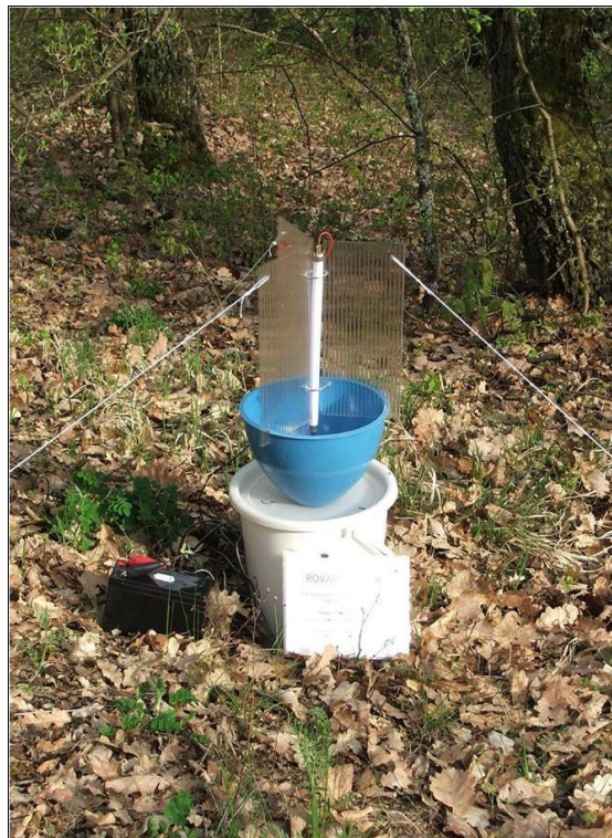
2. kép. Vödörcsapda