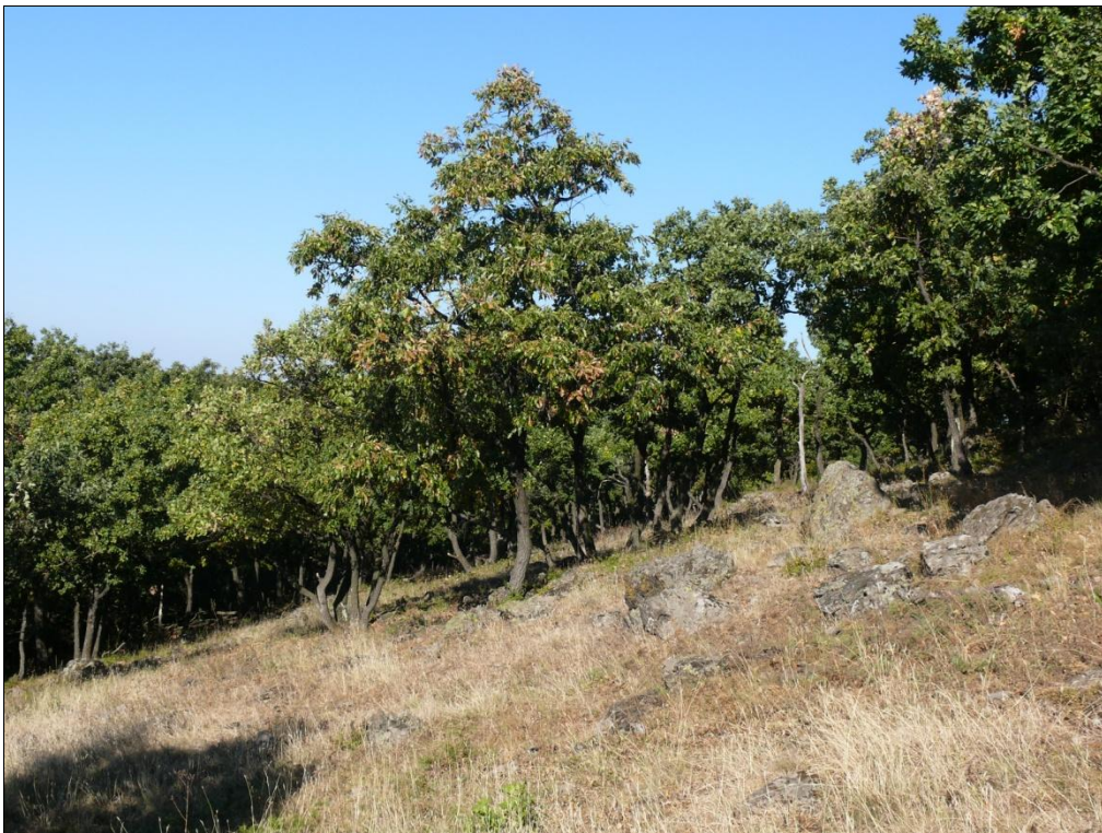
3. kép. Xerothem tölgyes a Nagy-Hársason (Jobbágyi)