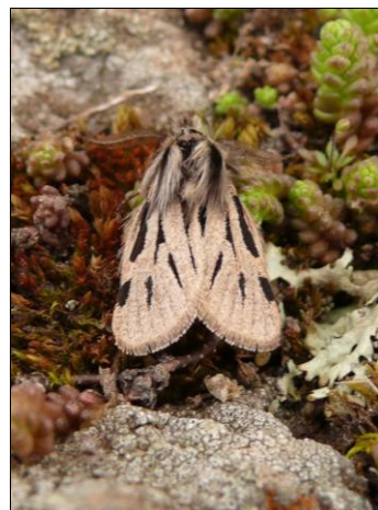
4. kép. Ocnogyna parasita