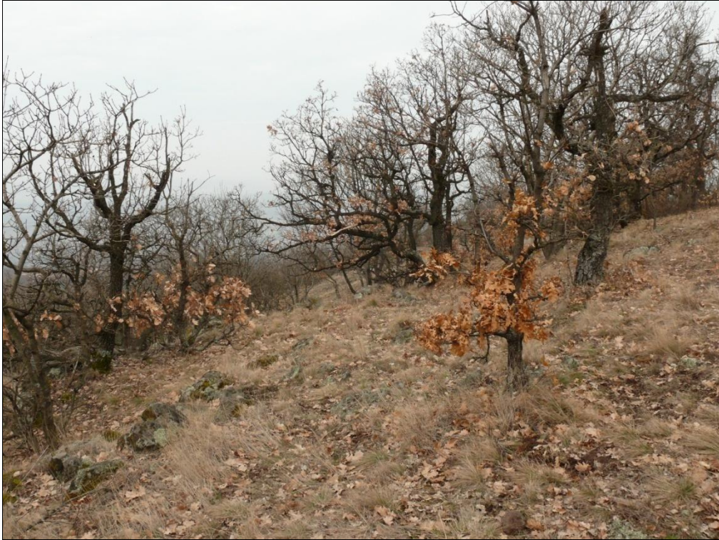
2. kép. Molyhos tölgyes a Horka-tetőn (Szurdokpüspöki)