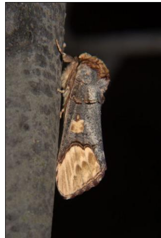
2. kép. Phalera bucephaloides