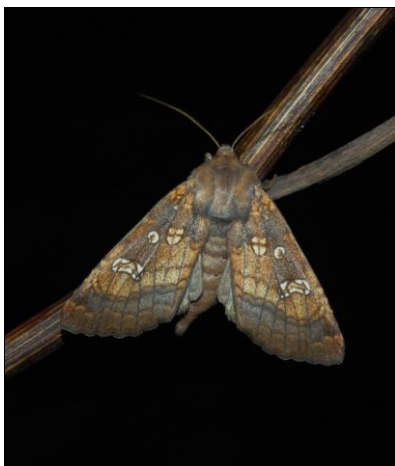
3. kép. Gortyna borelii lunata