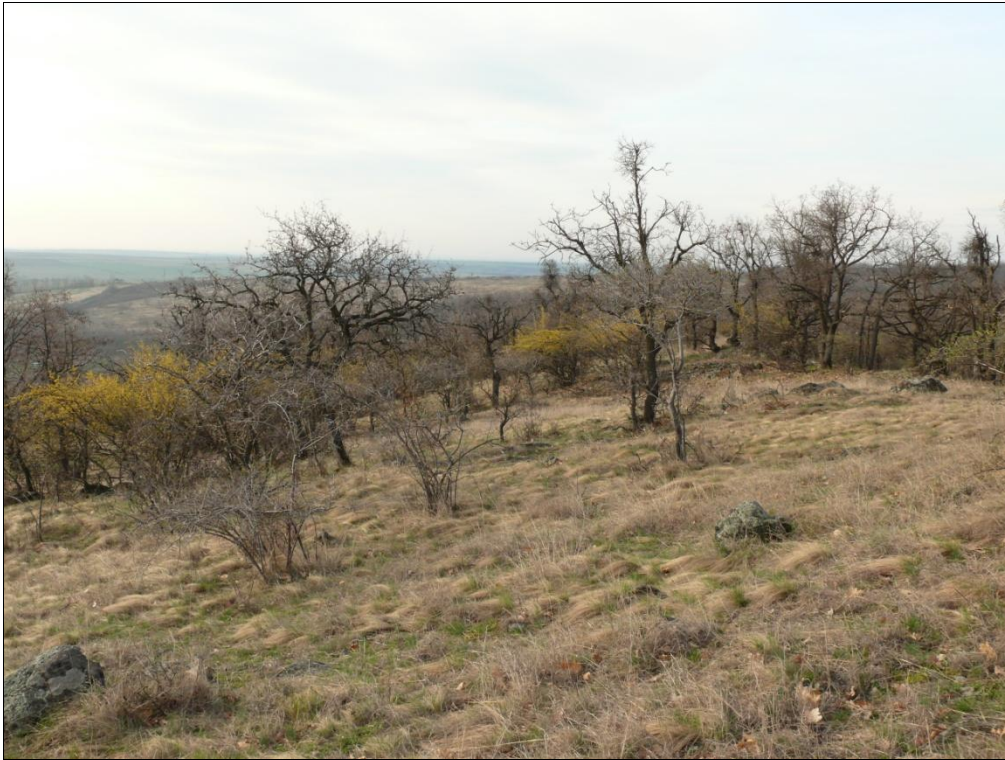
1. kép. Sziklagyepekkel mozaikoló molyhos tölgyes a Macskaváron (Kisnána)