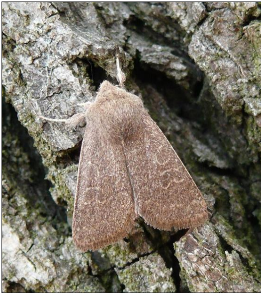
1. kép. Magyar tavaszi-fésűsbagoly (Dioszeghyana schmidtii)