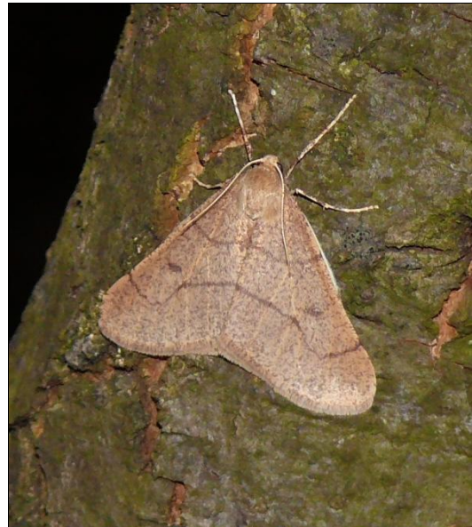
2. kép. Magyar téliaraszoló (Erannis ankeraria)