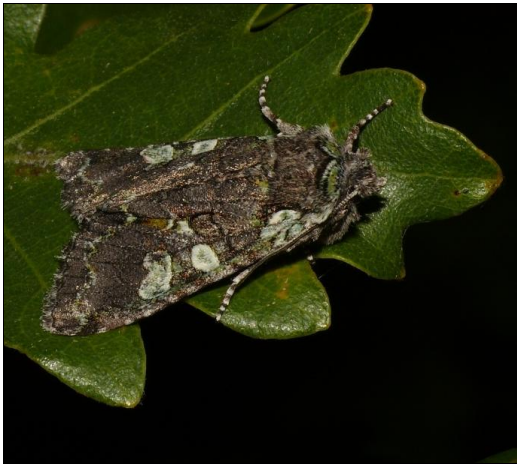
1. kép. Dichonia aeruginea

5. Függelék: A vizsgált területeken előforduló, természetvédelmi szempontból jelentős lepkefajok.