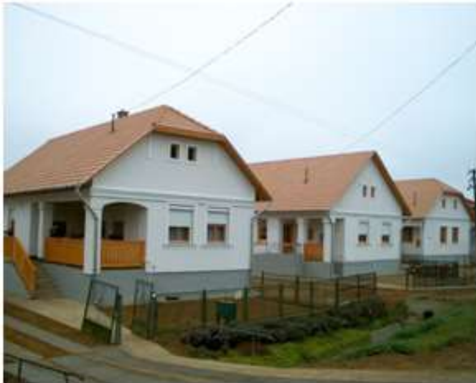
1.sz. kép: A megújult Bereg 2001

Folyamatos volt a számlák számszaki ellenőrzése. Vezetői ellenőrzés keretében vizsgálták az átutalási megbízások megfelelőségét. Rendszeres volt az analitikus nyilvántartások meglétének ellenőrzése. A kifizetések összegéről többször történt egyeztetés a Szabolcs-Szatmár-Bereg Megyei Közigazgatási Hivatallal, valamint a Bereg Újjáépítő KKt-vel. A tevékenységet a belső ellenőrzés, az Állami Számvevőszék és a Kormányzati Ellenőrzési Hivatal ellenőrizte.