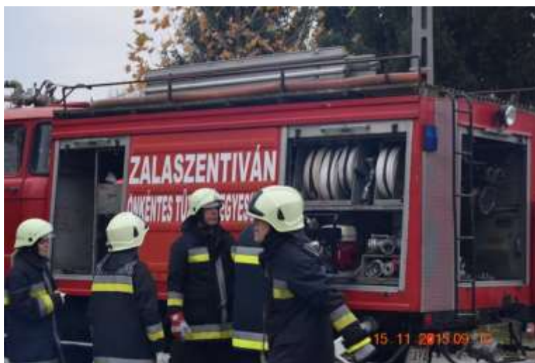
1. ábra: Zalaszentiván ÖTE.

A helyi kezdeményezések felkarolásánál mindenképpen olyan szervezetet kell választani, amely ezt a tevékenységet önként végzi, tételes állami támogatást így nem, vagy csak korlátozottan igényel. Erre az önszerveződés alapján, jelentős gyökerekkel rendelkező Önkéntes Tűzoltó Egyesületek 2 egyértelműen jó megoldást kínálhatnak. Miután egyesületi formában működnek, felügyeleti jogkört csak az ügyészség gyakorolhat felettük. Ezért a hivatásos szervek tekintetében szükség volt egy olyan minősítési rendszer kialakítására, amely alapján el lehet dönteni, hogy az adott egyesület alkalmas-e a közös munkára, tudásuk, eszközeik felhasználhatóak-e a jelentős veszélyekkel járó tűzoltási, műszaki mentési feladatok alkalmával. „A döntést befolyásoló, vagy annak szakmaiságát meghatározó körülményként további sarokkövek fogalmazhatók meg, úgymint a mindent felülíró életmentés elsődlegessége, a biztonság és a szakszerűség fontossága, valamint a stressz elkerülésével a nyugalom megőrzése, vagyis a döntési képesség folyamatos fenntartása” [2]