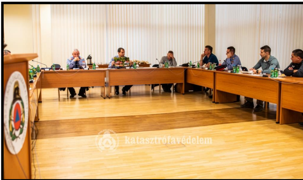
2. számú kép: Munkacsoport ülése

Amennyiben az OKF kinyilvánítja az ERDI képzési rendszerhez való csatlakozást, a Szervezeti és Műveleti Irányelv bűvár tevékenységre vonatkozó részét módosítani kell, a szövegkörnyezetet és a fejezeteket szükséges mértékben az ERDI képzési rendszeréhez kell igazítani, valamint a szakmai kritériumokat (személyi, tárgyi), az alkalmazást a kategóriáknak megfelelően kell átdolgozni. A munkacsoport javaslata alapján nem kell feltétlenül mindenkinek az ERDI rendszeréhez csatlakozni azonnal, ez a feladat ütemezhető. Az ezzel kapcsolatos munka elindult, felső vezetői döntés kell a továbblépéshez. Amennyiben ez a döntés megszületik, akkor az ERDI képzési rendszerhez való csatlakozás önkéntesen vállalt feladat, amelyet a BM OKF támogat. A Szervezeti és Műveleti Irányelv általános része továbbra is az alapelv.