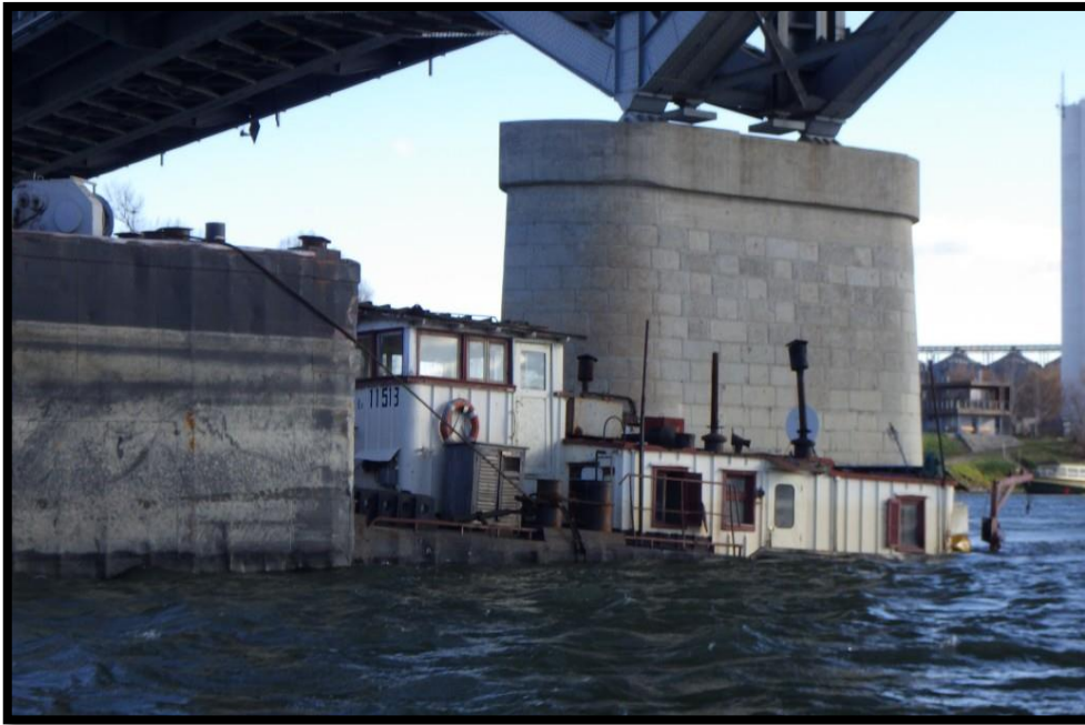
1. számú kép: Mentés Baján a Türr István hídnál

Az elmúlt 5 évben 3 komoly hajóbaleset volt Baján a Türr István Duna hídnál. 2016-ban volt az első jelentősebb hajóbaleset, ahol személyi sérülés nem volt, de tapasztalatot szereztük a magas vízállásnál és a híd lábánál való merülésben, mentésben.