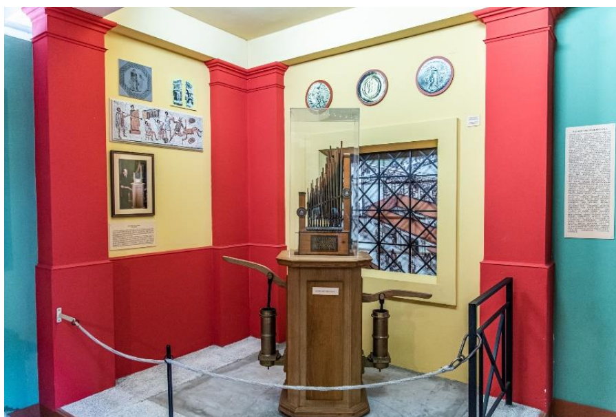
Aquincumi víziorgona rekonstrukciója

„Ubi Dolor Ibi Vigiles” Ahol a fájdalom ott a tűzoltó A Római Birodalom élen járt a tűz elleni védekezésben is, voltaképpen a mai tűzoltóság történetét a római egységekig vezethetjük vissza. Pannónia területén Aquincumban, Savariában és más városokban a tűzoltás és az éjjeli őrseg feladatait a különböző kézműves társulatok, főleg a faberek és a centonariusok testületei, collegiumai látták el.