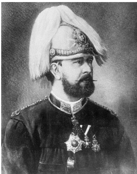
gróf Széchenyi Ödön

Mindkét szervezetnek, az Önkéntes és a Hivatásos Tűzoltóságnak is gróf Széchenyi Ödön lett a főparancsnoka.