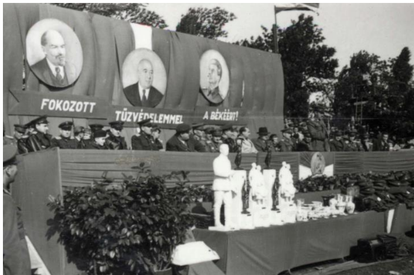
Tűzoltóság szocialista átszervezése

A vármegyékben a tűzrendészeti felügyeletet – az országos tűzoltó-főparancsnok vezetése alatt álló – tűzoltó osztályparancsnokságok gyakorolták, amelyeknek a működésük területükön lévő összes városi, községi és vállalati tűzoltóság alá volt rendelve. A tűzoltóosztályok létszámuknak megfelelően tűzoltóosztályokra, illetve tűzoltó őrsökre tagozódtak. Ha a vármegyei székhely, törvényhatósági jogú vagy megyei város volt, tűzoltóságának parancsnoka egyben a vármegyei tűzoltóosztályának a parancsnoki tiszteletét is ellátta.