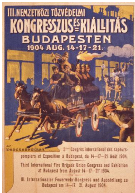
1904-es Tűzvédelmi Kongresszus plakátja

1900. augusztus 12-én Párizsi Világkiállítás idején több ország kezdeményezésére alakították meg a nemzetközi tűzoltószövetséget. Magyarország alapító tagja volt a szövetségnek, a magyar küldöttséget Gróf Széchenyi Viktor, a Magyar Országos Tűzoltó Szövetség elnöke vezette.