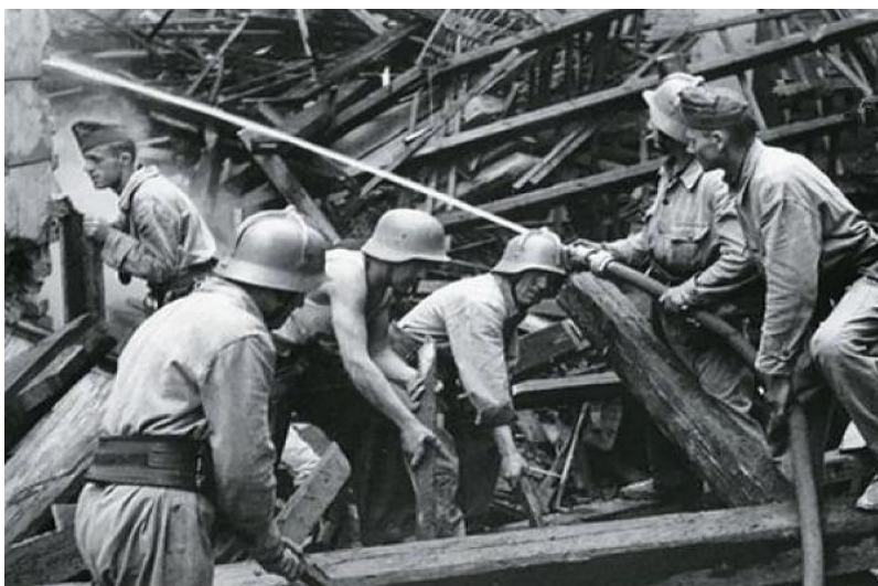
Tűzoltók munkában a II. világháborúban

1940-ben kiadásra került a Tűzrendészeti szervek egyenruházati, öltözködési és tiszteletadási Szabályzata, amely a kor szellemének megfelelő egyenruházatot vezetett be. A háborús viszonyokhoz való alkalmazkodás jegyében került rendszeresítésre a honvédségi mintájú acélsisak. A sisakot keresztbordákkal ütésállóbbá, belső szereléssel áramütés ellen védetté tették, hogy a tűzoltói céloknak jobban megfeleljen. Szürke színe is megkülönböztette a honvédségi sisaktól.