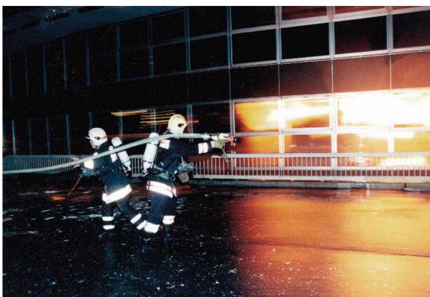
Budapest Sportcsarnok tüze 1999

önkormányzat részére a tűzoltóság működését és fenntartását szolgáló állami vagyont, illetve a költségvetési előirányzatként nyilvántartott eszközöket. Az önkormányzati tűzoltóság szakmai felügyeletét ekkor a Tűz- és Polgári Védelmi Országos Parancsnokság látta el. Ez a felügyeleti forma azonban nem bizonyult hosszú életűnek, hiszen az 1996-ban megjelent új Tűzvédelmi törvény 31 és a Polgári védelemről szóló törvény 32 hatálybalépésével két új országos hatáskörű rendvédelmi szerv jött létre a BM Tűzoltóság Országos Parancsnoksága és a Polgári Védelem Országos Parancsnoksága.