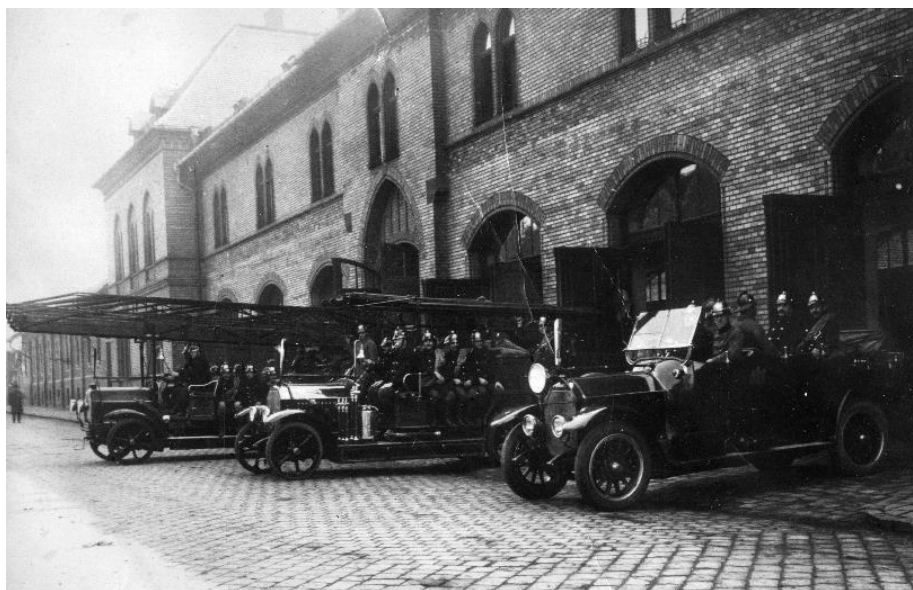
Fővárosi tűzoltóság szereit 1920-as évek

A rendelet lassan váltotta be a kiadásához fűzött reményeket. A tűzoltóságok szervezése nagyon vontatottan haladt.