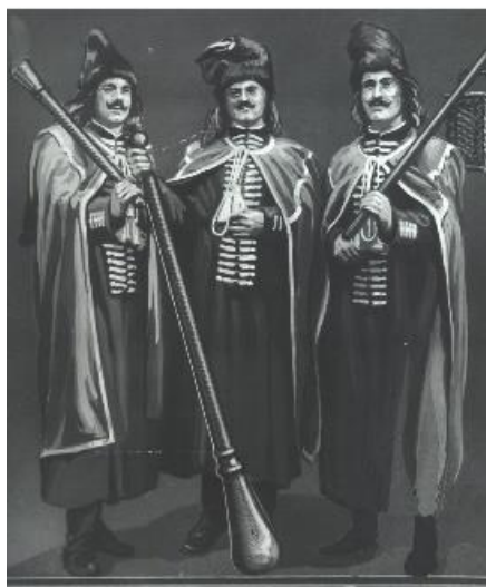
Debreceni diák tűzoltók

történelmi Magyarország diáktűzoltóságai (Debrecen, Sárospatak, Hódmezővásárhely, Kunszentmárton, Marosvásárhely, Nagyenyed, Gyulafehérvár, Székelyudvarhely, Eperjes, Nagyszombat, Kalocsa) az önkéntes tűzoltóságok elődjeként a kollégiumok épületeinek védelmére szerveződtek, de a városban keletkezett tüzek oltására is felhasználták őket.