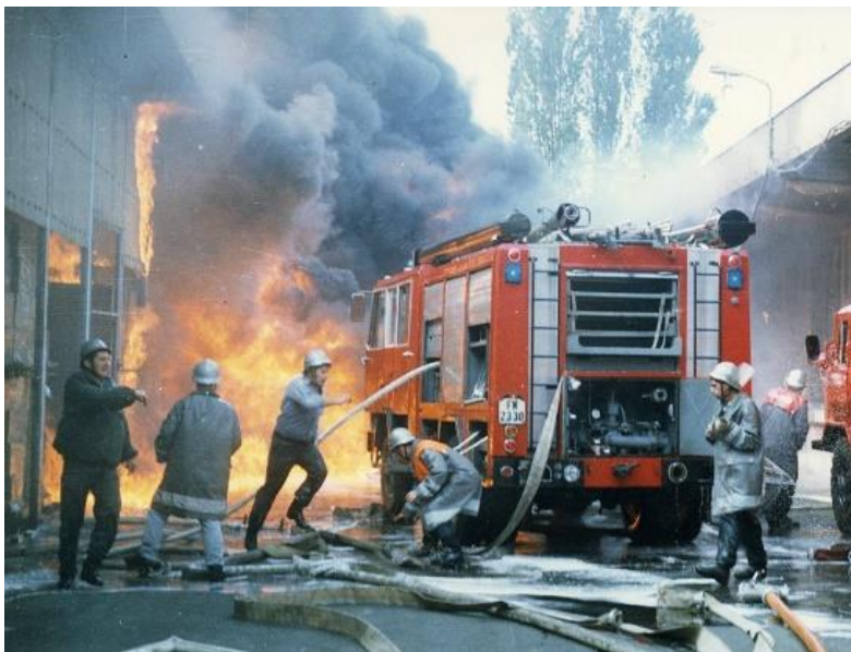
Tűzoltók a Kádár korszakban

Az állami tűzoltóság területi szerveinek szolgálati rendszeréről szóló 2028/1974. (VII. 21.) Mt. számú határozat alapján januártól decemberig minden érintett parancsnokságon be kellett vezetni a készségi állomány 24/48 órás szolgálati rendszerét 24 óra szolgálat - 48 óraszabad idő. 27